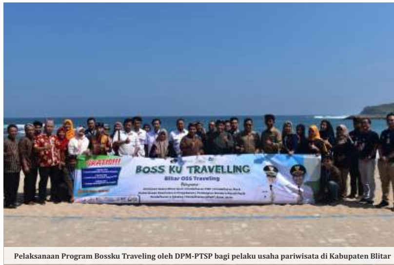
Pelaksanaan Program Bossku Traveling oleh DPM-PTSP bagi pelaku usaha pariwisata di Kabupaten Blitar

Selain investasi di Kabupaten Blitar, indikator kinerja DPM-PTSP sebagai instansi pelayanan publik yakni terkait perijinan. Puguh menerangkan perijinan secara garis