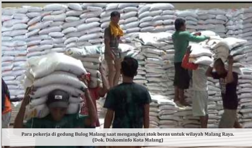
Para pekerja di gedung Bulog Malang saat mengangkat stok beras untuk wilayah Malang Raya.

MALANG - Stok pangan serta kenaikan harganya menjadi isu yang mengkhawatirkan jelang akhir tahun ini. Perusahaan umum (Perum) Bulog cabang Malang memastikan ketersediaan di gudangnya saat ini aman dan siap memenuhi kebutuhan masyarakat hingga Januari 2024.