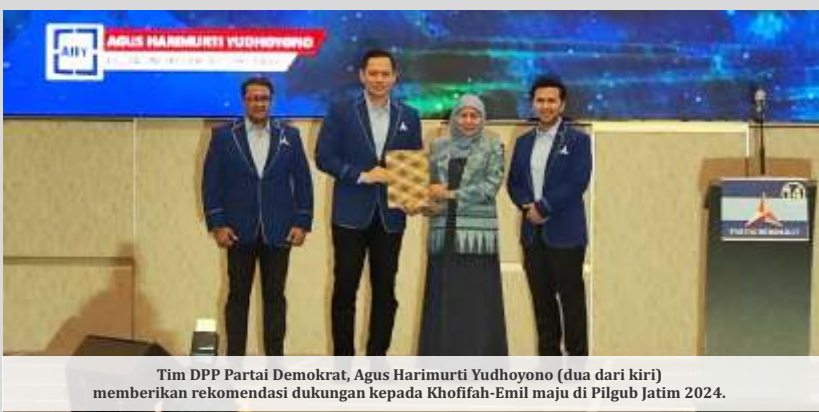
Tim DPP Partai Demokrat, Agus Harimurti Yudhoyono (dua dari kiri) memberikan rekomendasi dukungan kepada Khofifah-Emil maju di Pilgub Jatim 2024.

SURABAYA - Partai Demokrat secara resmi memberikan rekomendasi pada Khofifah Indar Parawansa untuk maju dalam pemilihan kepala daerah (Pilkada) Jatim 2024 mendatang. Dengan demikian sudah ada tiga partai yang memberikan rekomendasi pada Khofifah, yaitu PAN, Partai Gerindra, dan Partai Demokrat.