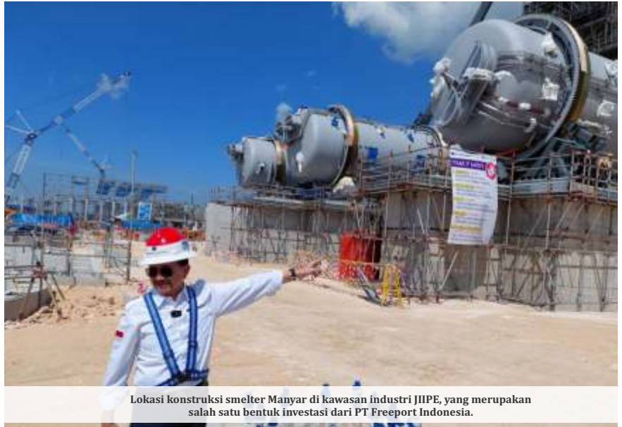
Lokasi konstruksi smelter Manyar di kawasan industri JIPE, yang merupakan salah satu bentuk investasi dari PT Freeport Indonesia.

Kota Surabaya, Jawa Timur, hingga triwulan III (Januari-September) tahun 2023 mencapai Rp17,230 triliun.