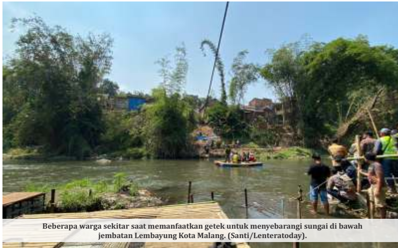
Beberapa warga sekitar saat memanfaatkan getek untuk menyeberangi sungai di bawah jembatan Lembayung Kota Malang. (Santi/Lenteratoday).

menegaskan bahwa penyelesaian proyek harus memperhatikan kualitas serta fungsi jembatan. "Sehingga harus tepat mutu, tepat fungsi, jangan terlalu dipaksakan demi karena ketakutan denda per mil itu sehingga kerja seandainya sendiri. Ini agar tetap mutu, fungsi, lebih diutamakan," jelas Fathol.