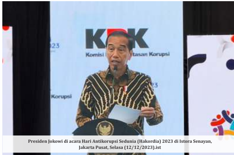
Presiden Jokowi di acara Hari Antikorupsi Sedunia (Hakordia) 2023 di Istora Senayan, Jakarta Pusat, Selasa (12/12/2023).ist

Selain itu ia juga melihat UU Pembatasan uang kartal juga perlu segera diselesaikan. Supaya transaksi uang fisik bisa dibatasi dan harus dilakukan melalui perbankan sehingga lebih akuntabel dan transparan.