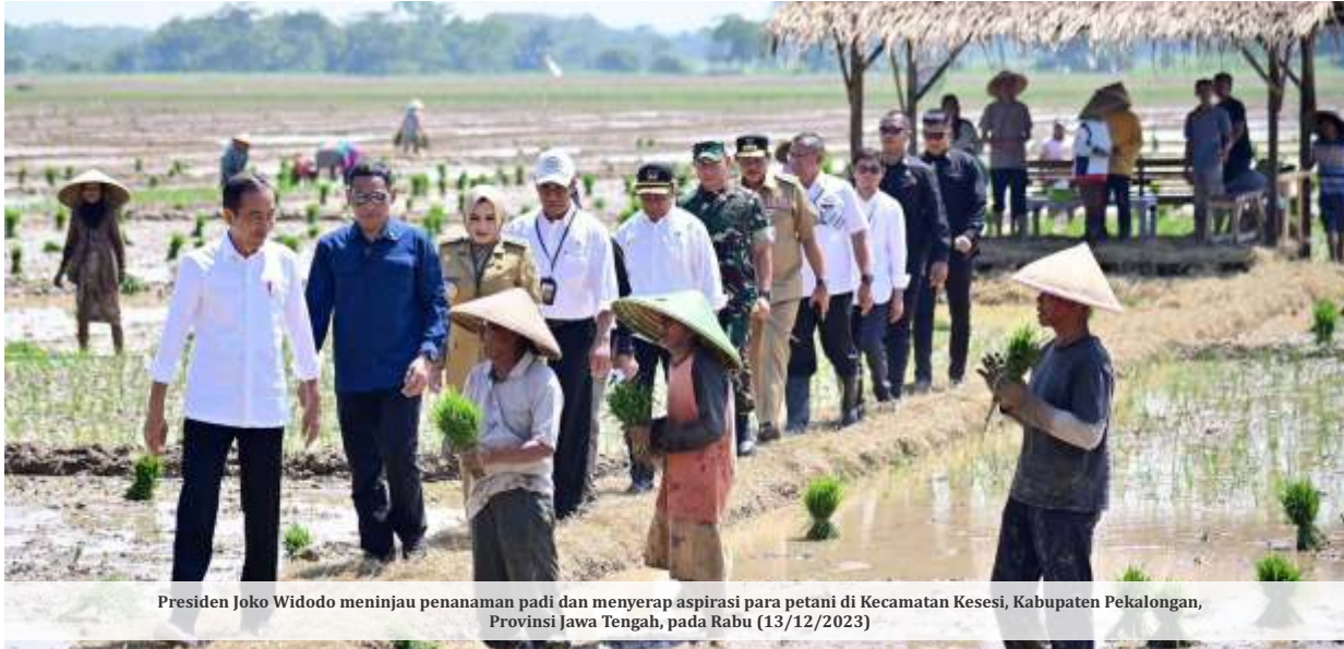
Presiden Joko Widodo meninjau penanaman padi dan menyerap aspirasi para petani di Kecamatan Kesesi, Kabupaten Pekalongan, Provinsi Jawa Tengah, pada Rabu (13/12/2023)

JAKARTA - Presiden Joko Widodo memastikan 1.002 keluarga penerima manfaat (KPM) di Gedung Bulog, Kecamatan Wiradesa, Kabupaten Pekalongan bakal mendapat bantuan beras hingga Maret 2024.