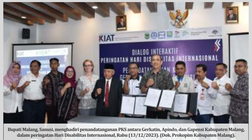
Bupati Malang, Sanusi, menghadiri penandatanganan PKS antara Gerkatin, Apindo, dan Gapensi Kabupaten Malang, dalam peringatan Hari Disabilitas Internasional, Rabu (13/12/2023). (Dok. Prokopim Kabupaten Malang).

Lebih lanjut, Sanusi juga menegaskan bahwa Pemkab Malang juga memberikan penghargaan kepada Apindo dan Gapensi Kabupaten Malang atas komitmen yang telah ditunjukkan. Pihaknya berharap agar perjanjian ini menjadi tonggak awal menuju pembangunan