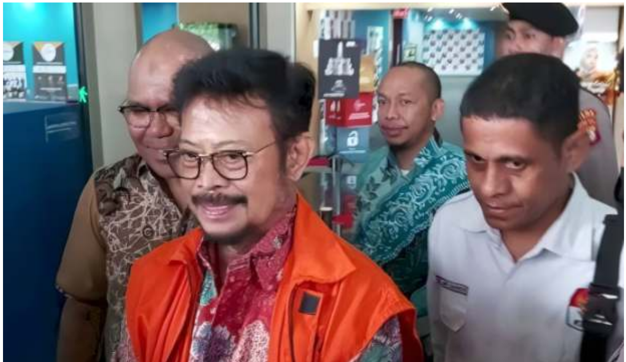
Syahrul Yasin Limpo (SYL) kembali diperiksa Dewan Pengawas (Dewas) KPK, Rabu (10/1/2024).