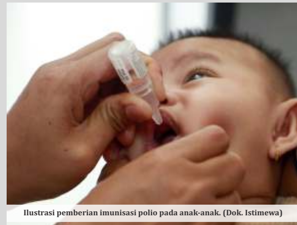
Ilustrasi pemberian imunisasi polio pada anak-anak.

Sementara itu, pada 5 Januari 2024 lalu, Direktorat Jenderal Pencegahan dan Pengendalian Penyakit (P2P) Kementerian Kesehatan RI, telah mencatat temuan tiga penyakit kasus lumpuh layu akut (Acute flaccid paralysis/AFP) yang disebabkan oleh Virus Polio Tipe Dua. Dua kasus ditemukan di provinsi Jawa Tengah dan Jawa Timur pada Desember 2023 lalu. Sedangkan satu kasus lainnya ditemukan di Jawa Timur pada 4