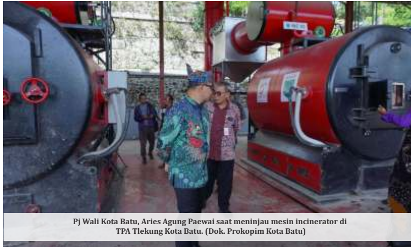
Pj Wali Kota Batu, Aries Agung Paewai saat meninjau mesin incinerator di TPA Tlekung Kota Batu.

Selain itu, ditegaskannya bahwa kehadiran 3 mesin incinerator di TPA Tlekung, juga akan difokuskan pada pengolahan sampah yang telah ada, residu zero waste, dan penanganan khusus untuk sampah warga Tlekung.