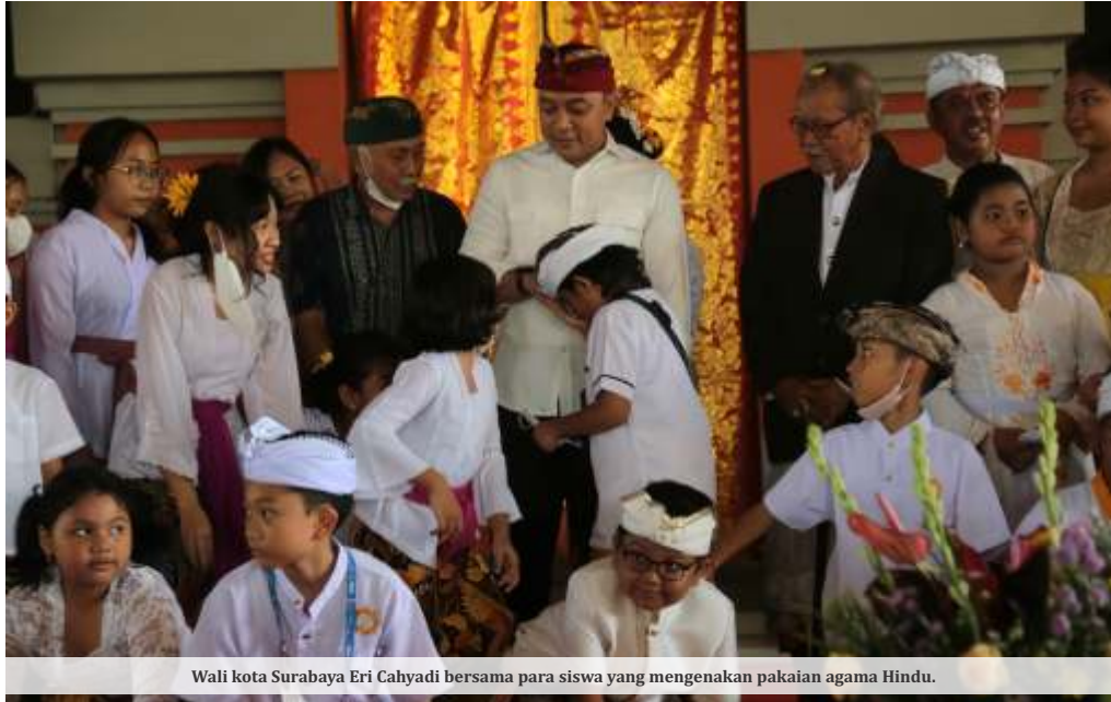
Wali kota Surabaya Eri Cahyadi bersama para siswa yang mengenakan pakaian agama Hindu.

"Kalau anak-anak sudah menghafal kitab sucinya, maka Surabaya akan menjadi kota yang aman dan damai tentunya penuh