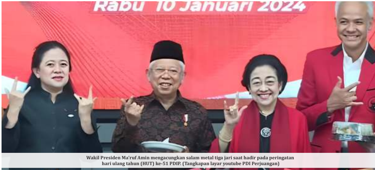
Wakil Presiden Ma'ruf Amin mengacungkan salam metal tiga jari saat hadir pada peringatan hari ulang tahun (HUT) ke-51 PDIP.

JAKARTA - Ketua Umum PDIP Megawati Soekarnoputri meminta agar Komisi Pemilihan Umum (KPU) dan Badan Pengawas Pemilu (Bawaslu) bekerja dengan benar. Dia mengingatkan Pemilu 2024 seharusnya berlangsung secara demokratis, langung, umum, bebas dan rahasia (luber).