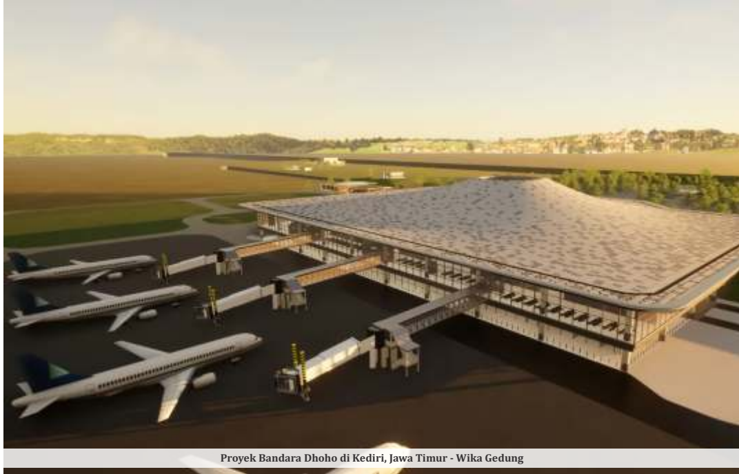
Proyek Bandara Dhoho di Kediri, Jawa Timur - Wika Gedung

Pada tahap awal, Bandara Dhoho memiliki kapasitas terminal 1,5