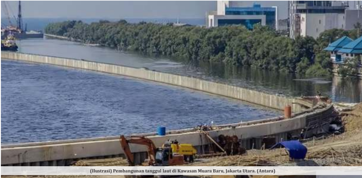
(Ilustrasi) Pembangunan tanggul laut di Kawasan Muara Baru, Jakarta Utara.

JAKARTA - Kerugian ekonomi akibat rob mencapai triliunan rupiah tiap tahunnya. Sebagai langkah antisipasi pemerintah akan membangun tanggul pantai dan tanggul laut (giant sea wall) sebagai salah satu proyek jangka panjang.