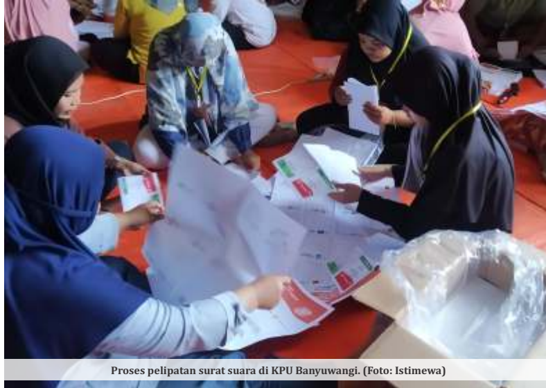
Proses pelipatan surat suara di KPU Banyuwangi.

KPU Kota Kediri juga mengajukan penggantian 3.745 surat suara rusak yang diketahui saat tahapan sortir dan lipat (sorlip). Kerusakan yang ditemukan diantaranya robek, warna memudar dan terdapat noda tinta yang mengenai gambar calon peserta Pemilu 2024.