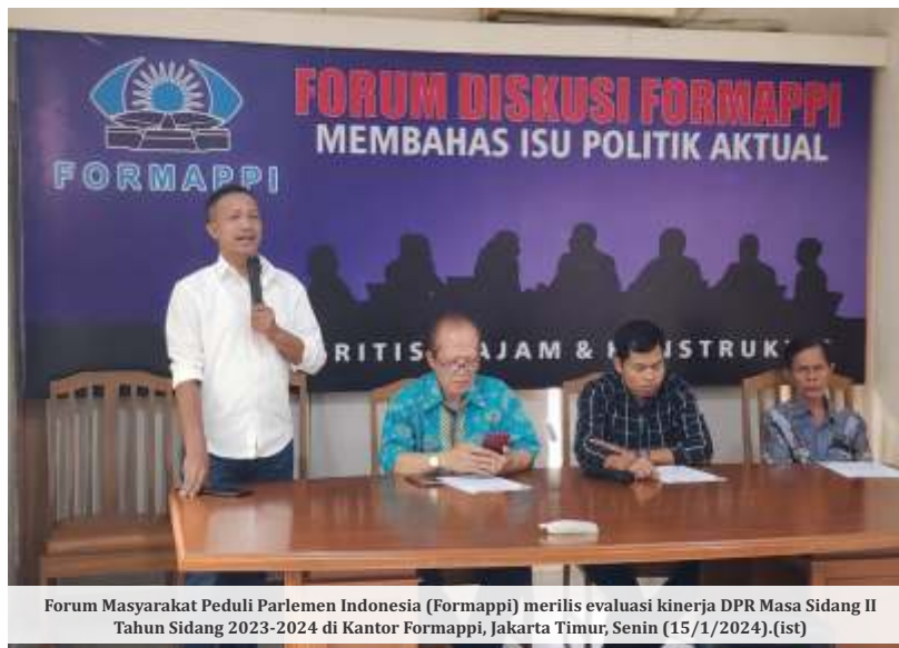
Forum Masyarakat Peduli Parlemen Indonesia (Formappi) merilis evaluasi kinerja DPR Masa Sidang II Tahun Sidang 2023-2024 di Kantor Formappi, Jakarta Timur, Senin (15/1/2024).