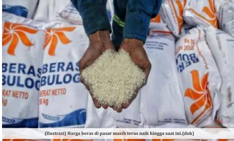
(Ilustrasi) Harga beras di pasar masih terus naik hingga saat ini.

menekan harga beras dalam negeri itu, ujarnya, karena alokasinya banyak digunakan untuk memenuhi kebutuhan bantuan sosial (bansos). Harga beras pun tidak mengalami penurunan karena penggunaannya tidak memiliki efek terhadap pasar.