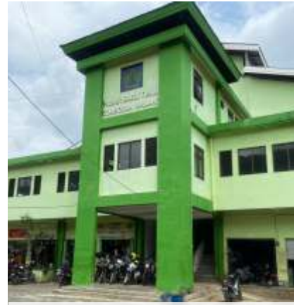
Tampak bangunan Pasar Baru Timur, kawasan Pasar Comboran Kota Malang (kiri), namun para pedagang kini masih menempati kios-kios di pinggir jalan, Senin (15/1/2024).