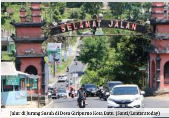
Jalur di Jurang Susuh di Desa Giripurno Kota Batu.

BATU - Jurang Susuh di Desa Giripurno, Kota Batu, sering menjadi lokasi kecelakaan karena medannya menanjak. Hal ini mendapat perhatian dari Pemerintah Kota (Pemkot) Batu dengan mewacanakan pembangunan fly over di lokasi tersebut.