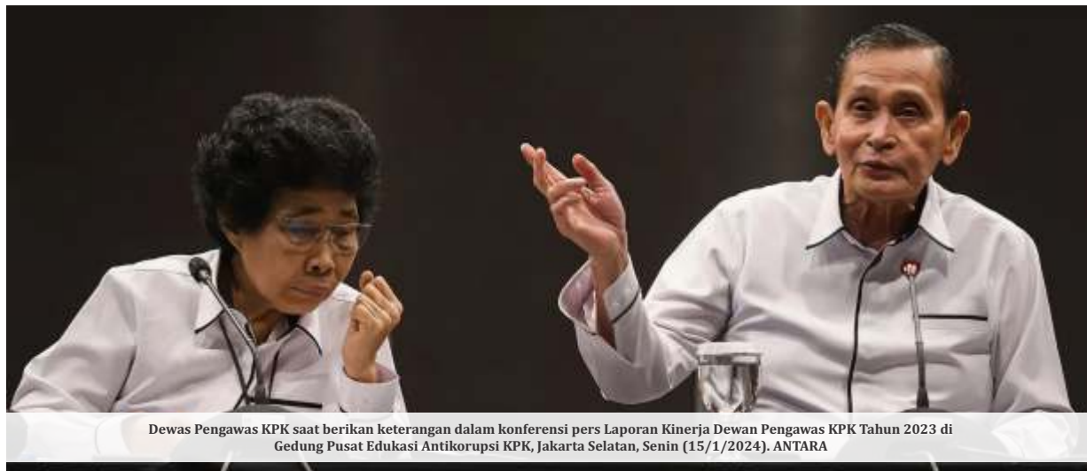
Dewas Pengawas KPK saat berikan keterangan dalam konferensi pers Laporan Kinerja Dewan Pengawas KPK Tahun 2023 di Gedung Pusat Edukasi Antikorupsi KPK, Jakarta Selatan, Senin (15/1/2024).

JAKARTA- Guncangan ke Komisi Pemberantasan Korupsi (KPK) masih berlanjut. Dewan Pengawas (Dewas) KPK menjelaskan perkembangan terkait kasus pungutan liar atau pungli di Rutan KPK. Dewas menyatakan besaran nilai pungli itu mencapai Rp 6,1 miliar.