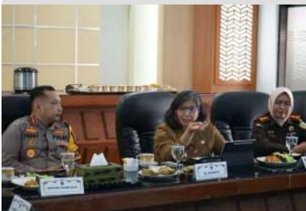
Penjabat Wali Kota Kediri Zanariah.

KEDIRI - Pemerintah Kota Kediri dengan Tim Pengendali Inflasi Daerah (TPID) menemukan harga sejumlah komoditas mengalami fluktuasi di pekan kedua Januari 2024 ini. Untuk itu, TPID Kota Kediri mencermati stok