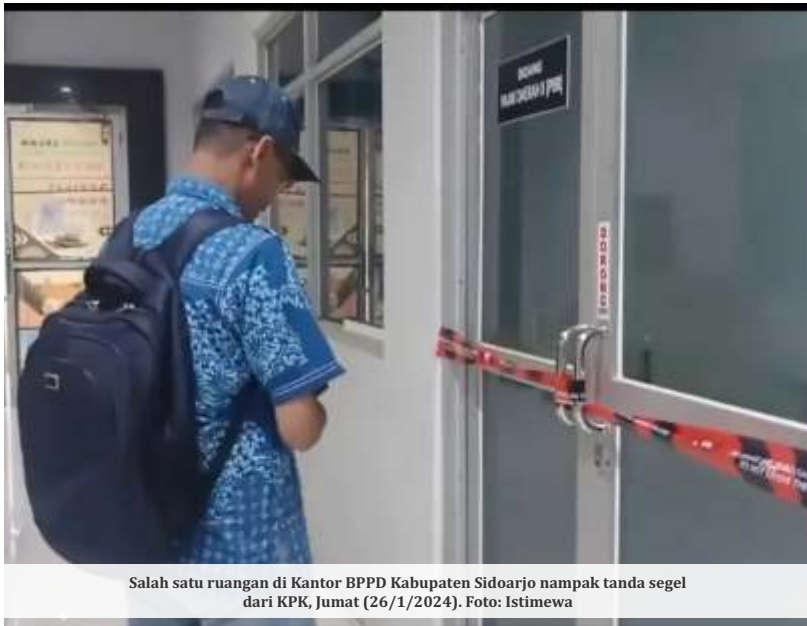
Salah satu ruangan di Kantor BPPD Kabupaten Sidoarjo nampak tanda segel dari KPK, Jumat (26/1/2024).