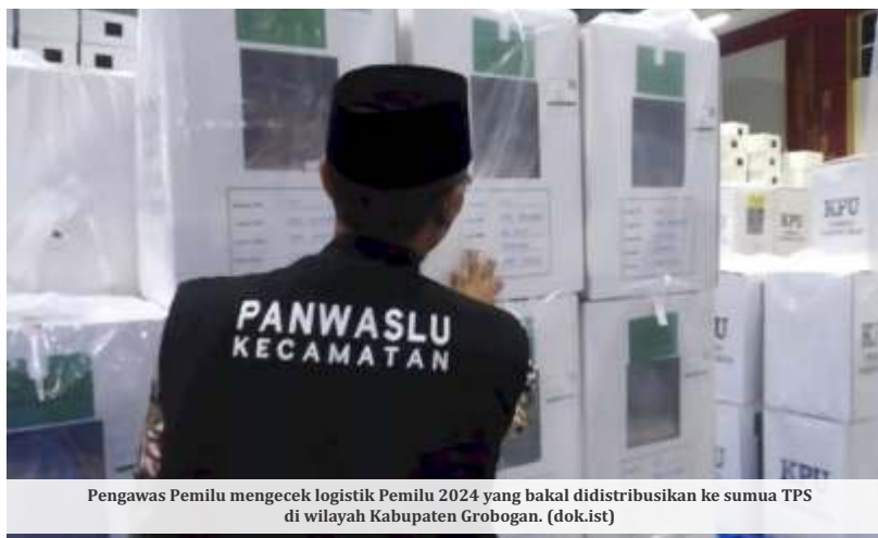
Pengawas Pemilu mengecek logistik Pemilu 2024 yang bakal didistribusikan ke semua TPS di wilayah Kabupaten Grobogan.

pemohon tersebut mewakili kepentingan 270 kepala daerah yang terdampak. Sekali lagi saya sangat mendukung dan menyambut baik upaya judicial review ini," ujarnya.