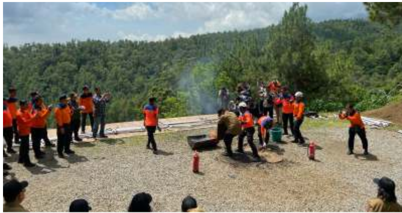
Peserta DiLA saat mengikuti simulasi pemadaman kebakaran di Coban Rais, Kota Batu, Sabtu (27/1/2024). (Santi/Lenteratoday)

Lebih lanjut, Pj Aries juga menyebutkan adanya potensi perputaran ekonomi yang tinggi berkat pelaksanaan DiLA di Coban Rais ini. Dengan pelaksanaan sejak