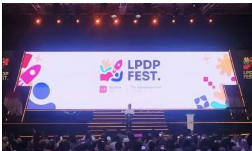
Presiden Joko Widodo saat membuka Kkegiatan LPDP Fest 2023 di Jakarta.

Sementara Menteri Koordinator Bidang Perekonomian Airlangga Hartarto menegaskan dana dari APBD untuk LPDP tidak akan disetop. "(Program maupun sumber) LPDP tidak disetop. Hanya LPDP akan