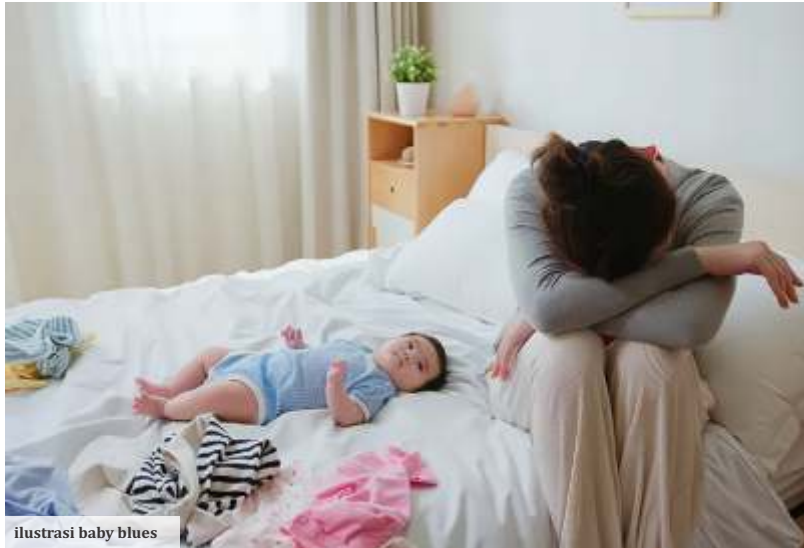
ilustrasi baby blues

seorang klien yang bercerita kepadanya setelah mengalami kondisi yang tidak menyenangkan pada kehamilan pertama sehingga memicu kondisi baby blues.