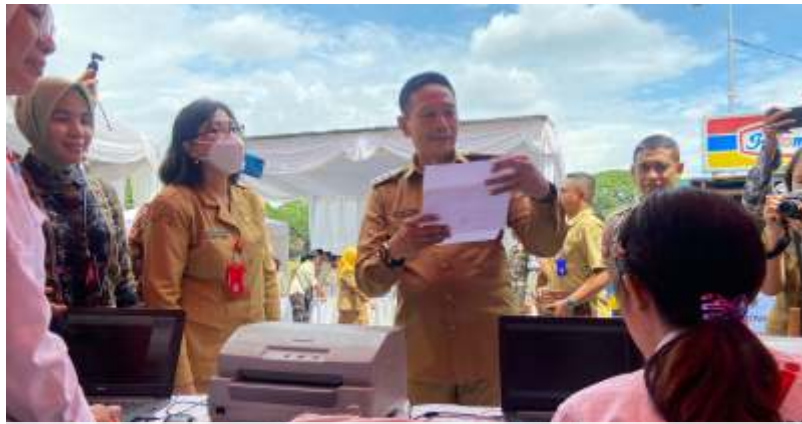
Pj Wali Kota Malang, Wahyu Hidayat, saat memanfaatkan layanan pembayaran SPPT PBB yang disediakan oleh Bapenda Kota Malang, Senin (29/1/2024).

Lebih lanjut, dengan peluncuran SPPT PBB 2024, Handi juga