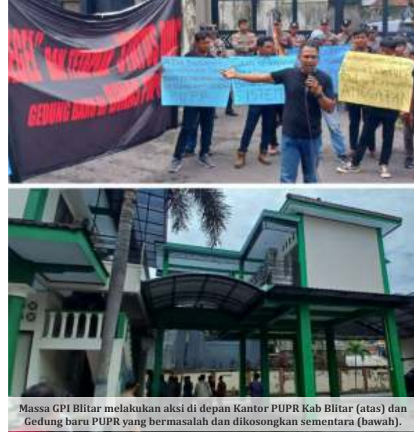
Massa GPI Blitar melakukan aksi di depan Kantor PUPR Kab Blitar (atas) dan Gedung baru PUPR yang bermasalah dan dikosongkan sementara (bawah).

Sampai kapan pengosongan sementara ini, Dicky mengaku sampai proses hukumnya selesai. “Semoga tidak lama, agar bisa segera dimanfaatkan lagi. Pengosongan ini tidak berpengaruh pada kinerja dan pelayanan PUPR, hanya saja terpaksa