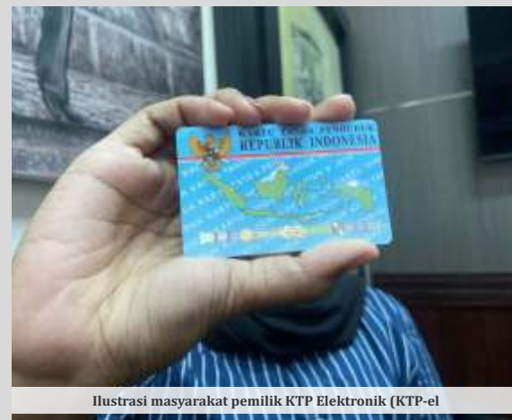
Ilustrasi masyarakat pemilik KTP Elektronik (KTP-el)

"Sedangkan kalau untuk kecamatan terbanyak, itu ada di