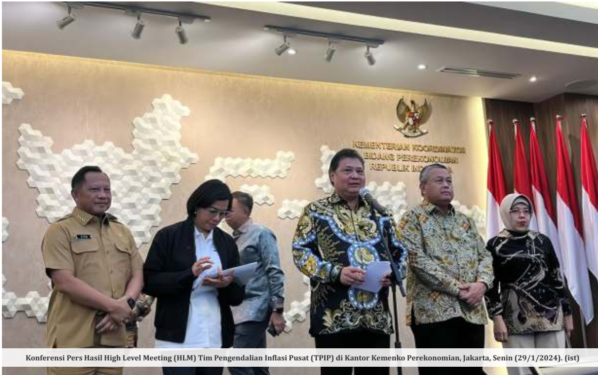
Konferensi Pers Hasil High Level Meeting (HLM) Tim Pengendalian Inflasi Pusat (TPIP) di Kantor Kemenko Perekonomian, Jakarta, Senin (29/1/2024).

JAKARTA-Pemerintahan Presiden Joko Widodo (Jokowi) membagikan bantuan sosial (bansos) tambahan berupa bantuan langsung tunai (BLT) sebesar Rp200.000 selama tiga bulan ke depan untuk masyarakat yang membutuhkan. Dengan jumlah 18,8 juta Kelompok Penerima Manfaat (KPM), total anggarannya sekitar Rp 11,25 triliun. Dari mana sumber dananya?