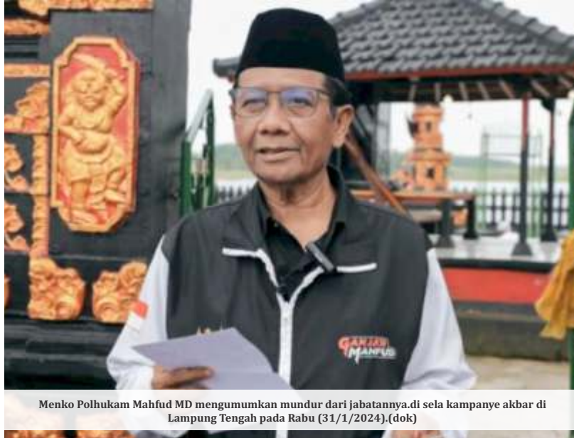
Menko Polhukam Mahfud MD mengumumkan mundur dari jabatannya di sela kampanye akbar di Lampung Tengah pada Rabu (31/1/2024). (dok)

Lebih jauh, Dito menjelaskan ada 2 rapat di Istana pada Januari ini. Dia merasa rapat juga masih kompak. "Walaupun isunya berbeda koalisi