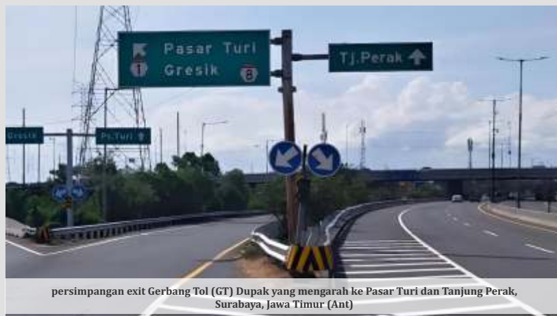
persimpangan exit Gerbang Tol (GT) Dupak yang mengarah ke Pasar Turi dan Tanjung Perak, Surabaya, Jawa Timur (Ant)

"Evaluasi penyesuaian tarif tol juga untuk memastikan iklim investasi