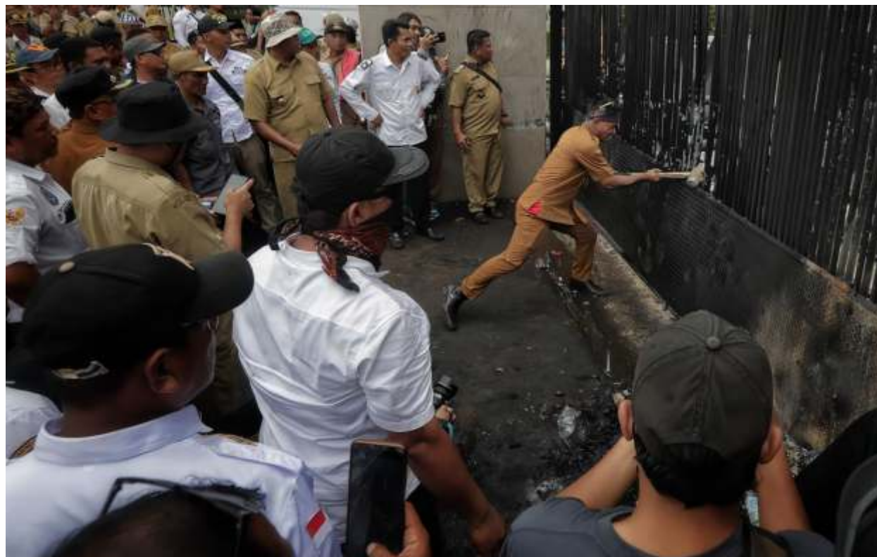
Massa dari Asosiasi Pemerintah Desa Seluruh Indonesia (Apdesi) merusak pagar saat menggelar demonstrasi di depan Gedung MPR/DPR, Senayan, Jakarta, Rabu (31/1/2024).

JAKARTA- Kepolisian sudah memprediksi akan terjadi keributan dalam demo Asosiasi Pemerintah Daerah Desa Seluruh Indonesia (APDESI), Rabu (31/1/2024). Temuan polisi di lapangan, massa sudah mempersiapkan 30 ban bekas untuk dibakar