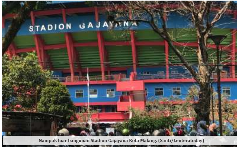
Nampak luar bangunan Stadion Gajayana Kota Malang. (Santi/Lenteratoday)

Baihaqi mengungkapkan, pemilihan cabang olahraga (cabor) yang akan dimasukkan dalam DBOD Kota Malang masih dalam tahap