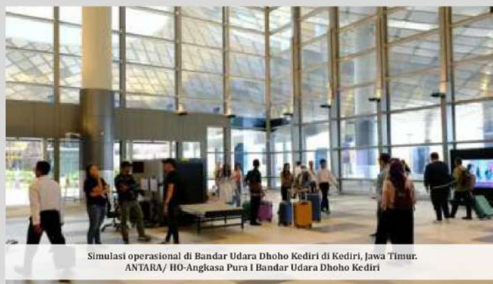
Simulasi operasional di Bandar Udara Dhoho Kediri di Kediri, Jawa Timur.

Kendaraan mereka bisa langsung diparkir di area parkir seluas 37.108