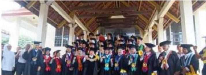
Sejumlah akademisi, beberapa diantaranya Universitas Gadjah Mada (atas) dan Universitas Indonesia (UII) menyampaikan Petisi Bulaksumur sebagai bentuk keprihatinan terhadap dinamika perpolitikan nasional dan pelanggaran prinsip demokrasi menjelang pemilu 2024.

JAKARTA -Pada tahun 2024, menjelang akhir masa pemerintahan Presiden Joko Widodo (Jokowi), para akademisi menyuarakan kegelisahan mereka. Para dosen, termasuk guru besar sejumlah perguruan tinggi negeri ataupun swasta, menyatakan sikap.