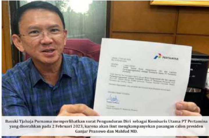
Basuki Tjahaja Purnama memperlihatkan surat Pengunduran Diri sebagai Komisaris Utama PT Pertamina yang diserahkan pada 2 Februari 2023, karena akan ikut mengkampanyekan pasangan calon presiden Ganjar Pranowo dan Mahfud MD.