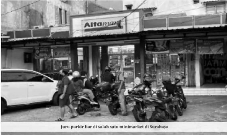
Juru parkir liar di salah satu minimarket di Surabaya

SURABAYA – Masyarakat Kota Surabaya merasa akan keberadaan parkir liar yang semakin menjamur di setiap minimarket di Kota Surabaya. Keresahan dari masyarakat ini pun diamini oleh anggota Komisi B DPRD Kota Surabaya, Mahfudz.