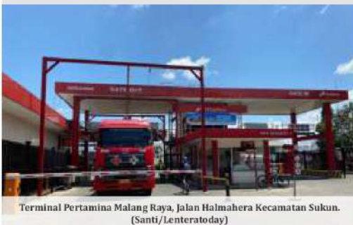
Terminal Pertamina Malang Raya, Jalan Halmahera Kecamatan Sukun.

JAKARTA – PT Pertamina (Persero) memutuskan untuk tidak menaikkan harga seluruh jenis bahan bakar minyak (BBM) umum atau non-subsidi di tengah tren kenaikan harga minyak mentah dunia dan juga kurs per