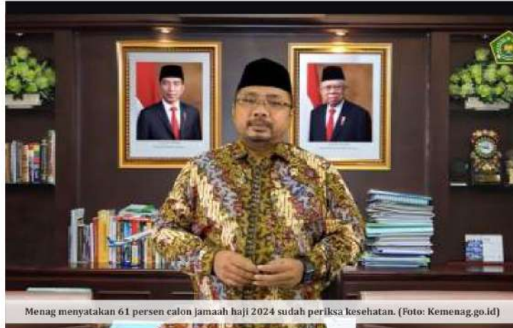
Menag menyatakan 61 persen calon jamaah haji 2024 sudah periksa kesehatan.

Pelunasan Biaya Perjalanan Ibadah Haji (Bipih) 1445 H/2024 M tahap I dibuka sejak 10 Januari 2024. Sampai hari ini, sudah lebih 113 ribu jamaah haji reguler yang melakukan