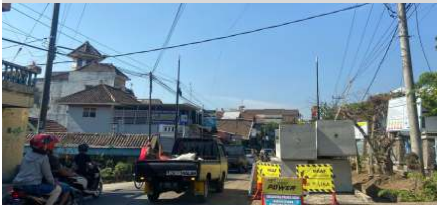
Proyek pelebaran jalan di Jalan Semeru yang dilaksanakan oleh Pemkot Batu di akhir tahun 2023 lalu.

BATU - Pemerintah Kota (Pemkot) Batu terus berupaya untuk melakukan peningkatan infrastruktur jalan di wilayahnya. Menurut Kepala Dinas Pekerjaan Umum dan Penataan Ruang (PUPR) Kota Batu, Alfi Nurhidayat, progres pada tahun 2023 mencerminkan komitmen kuat untuk meningkatkan kualitas dan kondisi jalan yang optimal.