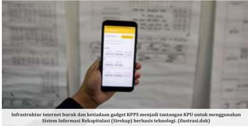
Infrastruktur internet buruk dan ketiadaan gadget KPPS menjadi tantangan KPU untuk menggunakan Sistem Informasi Rekapitulasi (Sirekap) berbasis teknologi. (ilustrasi.dok)

Hal tersebut disampaikan usai ditanya tentang 11 tempat pemungutan suara (TPS) di Kecamatan Bogor Selatan, Kota Bogor, Jawa Barat yang masuk dalam area blank spot