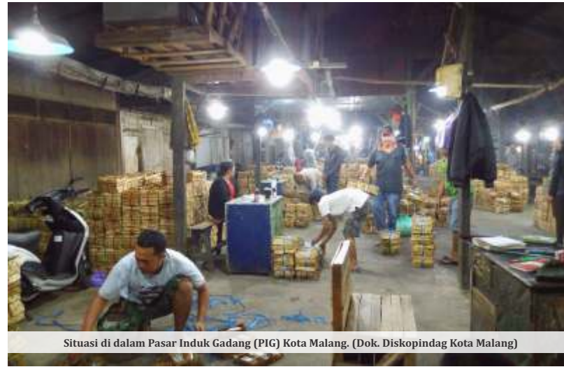
Situasi di dalam Pasar Induk Gadang (PIG) Kota Malang.

"Kami terus upayakan untuk mencari titik solusinya. Karena memang ujung dari masalah kesemrawutan di PIG itu selama ini belum selesai pembangunan revitalisasinya. Nah saat ini saya dengan tim akan mengkaji terkait dengan PKS nya. Untuk melihat kira-kira permasalahannya ini dasarnya di mana. Setelah itu kita akan kita panggil pihak ketiganya, yakni PT Patra Berkah Itqoni (PBI). Kita bicarakan