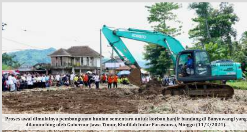
Proses awal dimulainya pembangunan hunian sementara untuk korban banjir bandang di Banyuwangi yang dilanlaunching oleh Gubernur Jawa Timur, Khofifah Indar Parawansa, Minggu (11/2/2024).

Dalam kesempatan ini, Gubernur Khofifah menyampaikan, proses relokasi sebelum peluncuran pembangunan sempat mengalami