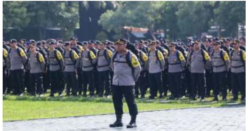
Personel Polda Jatim yang di-BKO ke daerah rawan saat Pemilu 2024.

Untuk wilayah yang perlu mendapatkan penebalan pasukan adalah Polresta Banyuwangi dan empat Polres di Madura, terutama di Sumenep serta di Blitar Kota. "Kita belajar dari tahun 2019. Dulu di Madura ada kotak suara hilang, diadakan PSU (pemungutan suara ulang) lagi kemudian bentrok pendukung yang fanatik antara pendukung capres maupun cawapres sampai berdampak pembakaran