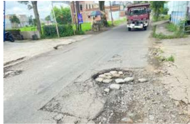
Salah satu kondisi jalan di Kecamatan Karangploso Kabupaten Malang.

"Kalau dari PP 34, untuk menaikkan status jalan harus naikkan fungsi dulu. Nah, ini kita sedang konsultasikan dengan BPK dan Monitoring Center for Prevention (MCP) Komisi Pemberantasan Korupsi (KPK). Yang jelas, kita naikkan fungsinya itu jalan-jalan strategis yang memang belum masuk kewenangan kita, yang menghubungkan antar kecamatan yang terpenting," papar Oong.