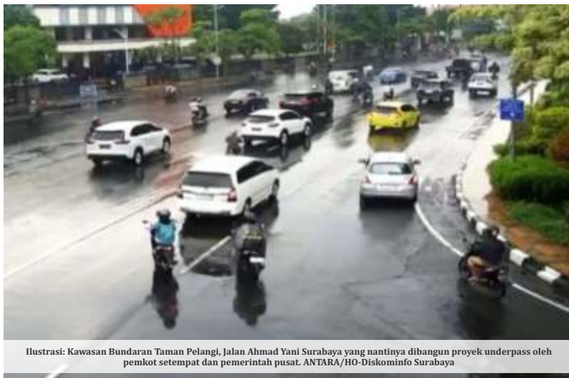
Ilustrasi: Kawasan Bundaran Taman Pelangi, Jalan Ahmad Yani Surabaya yang nantinya dibangun proyek underpass oleh pemkot setempat dan pemerintah pusat.

berkoordinasi dengan pemerintah provinsi terkait sejumlah proyek strategis lain yang bisa dibiayai oleh pemerintah pusat.