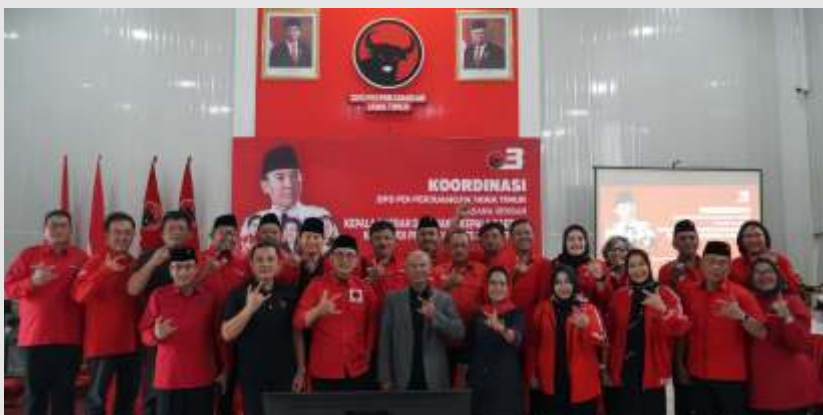
Rapat koordinasi internal yang digelar oleh DPD PDI Perjuangan Jatim, Minggu (3/3/2024) bersama para kepala daerah di Jawa Timur. Upaya ini menjadi ajang-ajang menyambut Pilkada serentak 2024.

SURABAYA - Dewan Pimpinan Daerah (DPD) PDI Perjuangan Jatim mulai ancap-ancang menatap Pilkada serentak 2024 yang rencananya bakal berlangsung November mendatang. Semua daerah mulai dipetakan, tak terkecuali para petahana untuk diusung kembali.