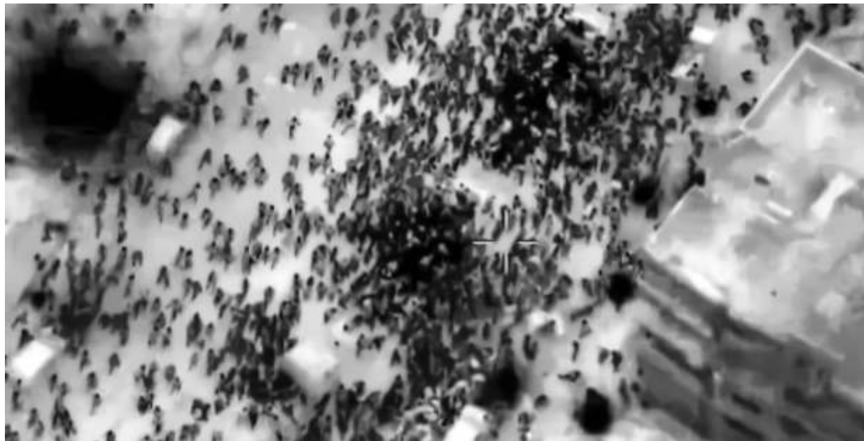
Foto yang dirilis oleh tentara Israel pada 29 Februari 2024 ini menunjukkan serangan ke warga Gaza yang antri di sekitar truk-truk bantuan di Kota Gaza. Sekitar 104 orang tertembak mati, kata kementerian kesehatan di Gaza yang dikelola Hamas.

GAZA - Kurang dari sepekan umat Islam menjalankan ibadah puasa, seorang Menteri Israel meminta bulan suci Ramadan dihapuskan. Sosok yang menyampaikan itu Amichai Eliyahu dikenal sebagai tokoh kanan Yahudi.