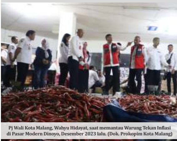
Pj Wali Kota Malang, Wahyu Hidayat, saat memantau Warung Tekan Inflasi di Pasar Modern Dinoyo, Desember 2023 lalu.

MALANG - Penjabat (Pj) Wali Kota Malang, Wahyu Hidayat, mempertimbangkan aktivasi Warung Tekan Inflasi (WTI) jelang Ramadan 2024 ini. Wahyu mengatakan, keputusan tersebut bergantung pada level inflasi Kota Malang.