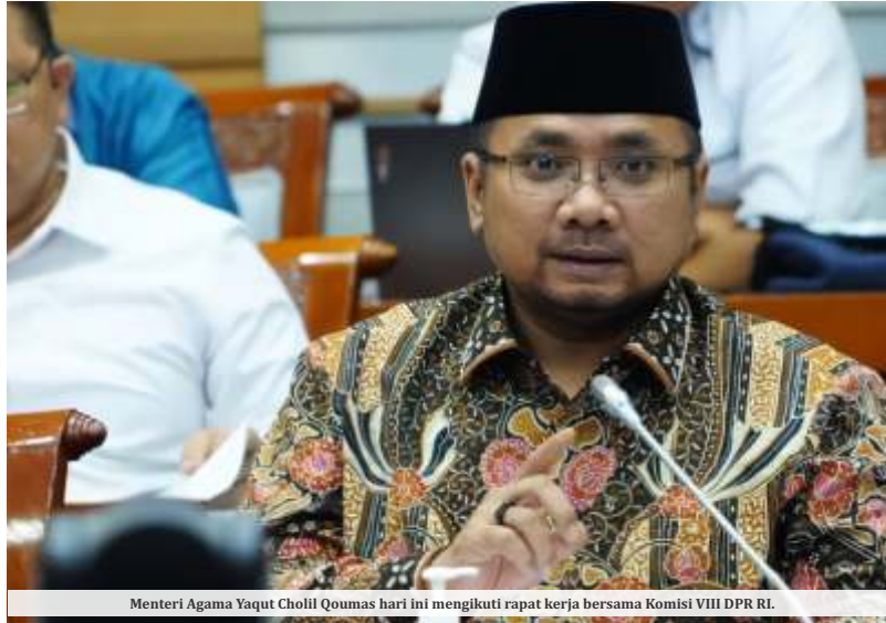
Menteri Agama Yaqut Cholil Qoumas hari ini mengikuti rapat kerja bersama Komisi VIII DPR RI.

"Daya tampung asrama embarkasi kapasitas belum memadai untuk menampung jumlah jemaah yang cukup besar setiap harinya. Kekurangan daya tampung seperti di asrama haji Bekasi saat ini daya