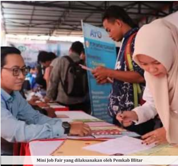
Mini Job Fair yang dilaksanakan oleh Pemkab Blitar

BLITAR - Angka pengangguran di Kabupaten dan Kota Blitar mencapai sekitar 40 ribu orang. Mayoritas pengangguran di Bumi Penataran ini merupakan lulusan SMA/SMK.