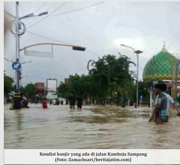
Kondisi banjir yang ada di jalan Kamboja Sampang

mengecek di depan Koramil Blega Bangkalan, situasi arus lalu lintas dari arah Bangkalan menuju Sumenep dan Sampang demikian juga sebaliknya belum bisa dilintasi mengingat masih banjir dengan ketinggian sekitar 1 meter," kata Komarudin.