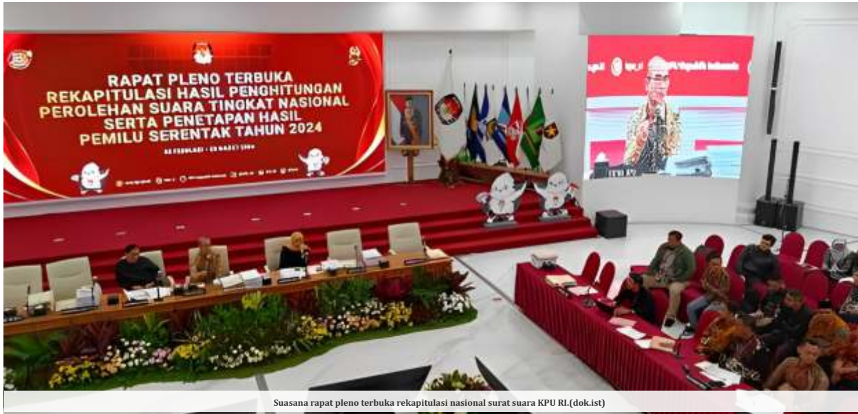
Suasana rapat pleno terbuka rekapitulasi nasional surat suara KPU RI.