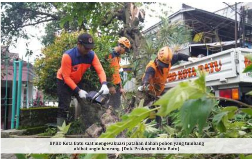
BPBD Kota Batu saat mengevakuasi patahan dahan pohon yang tumbang akibat angin kencang.

BATU - Cuaca ekstrem masih menjadi ancaman besar saat ini. Badan Penanggulangan Bencana Daerah (BPBD) Kota Batu mencatat sebanyak 27 kejadian bencana terjadi sepanjang trimester pertama 2024 ini.