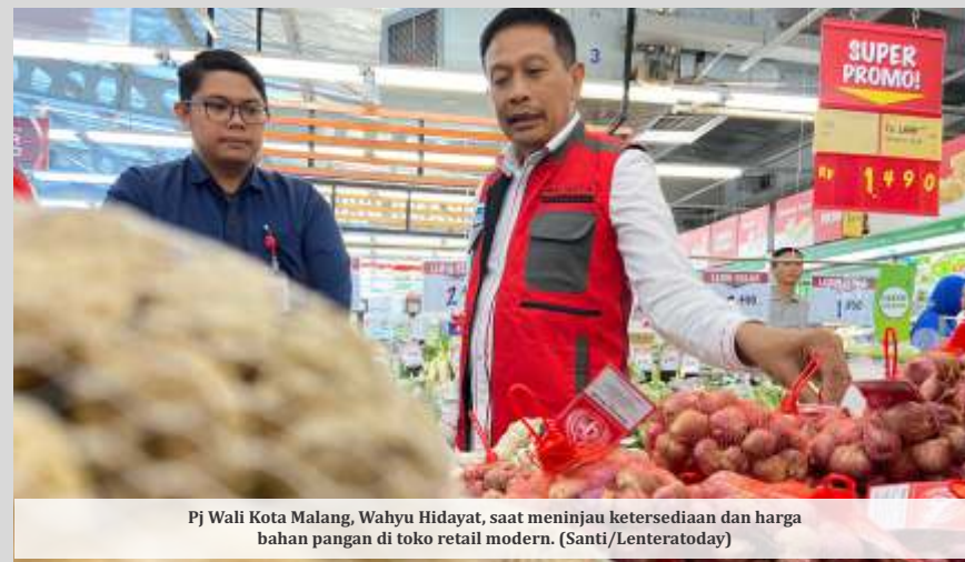
Pj Wali Kota Malang, Wahyu Hidayat, saat meninjau ketersediaan dan harga bahan pangan di toko retail modern.

Selain dengan melaku-kan kerjasama antar daerah untuk mem-perbanyak komoditi pangan yang dijual melalui WTI. Pj Wahyu juga menyampaikan rencana penggunaan anggaran Belanja Tak Terduga (BTT) senilai Rp 1 miliar. Menurut-nya, BTT ini akan dialokasikan untuk pengoptimalan