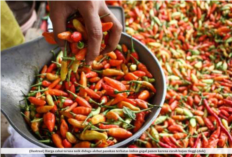
(Ilustrasi) Harga cabai terusa naik diduga akibat pasokan terbatas imbas gagal panen karena curah hujan tinggi.

JAKARTA - Menteri Perdagangan (Mendag) Zulkifli Hasan (Zulhas) mengungkapkan alasan harga cabai naik akhir-akhir ini. Hal itu dikarenakan pasokan yang terbatas imbas gagal panen akibat curah hujan tinggi.