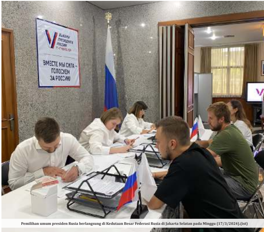
Pemilihan umum presiden Rusia berlangsung di Kedutaan Besar Federasi Rusia di Jakarta Selatan pada Minggu (17/3/2024).

Veronica juga menjelaskan bahwa meski terjadi rumor soal prajurit RI di Ukraina, hubungan antara Indonesia dan Rusia akan selalu baik-baik saja. "Hubungan Indonesia dengan Rusia tetaplah sangat baik, menurut