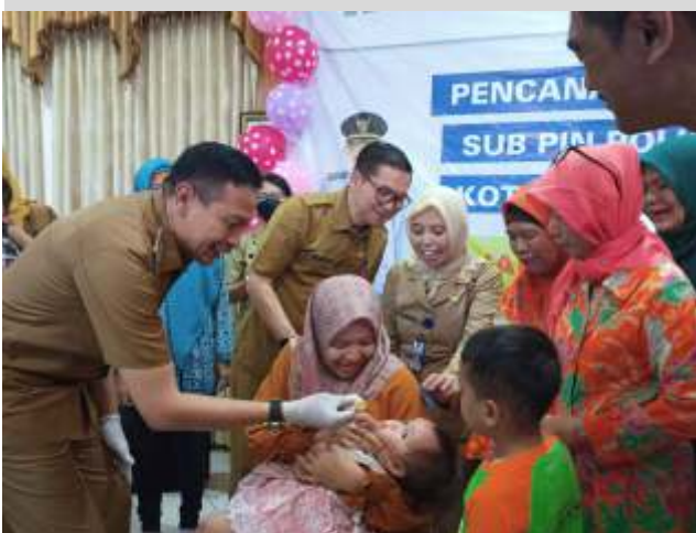
Pj Wali Kota Malang, Wahyu Hidayat, turut memberikan vaksinasi untuk balita sebagai salah satu jaminan kesehatan masyarakat.

(Pemkot) Malang dalam memastikan akses kesehatan yang merata bagi seluruh masyarakatnya.