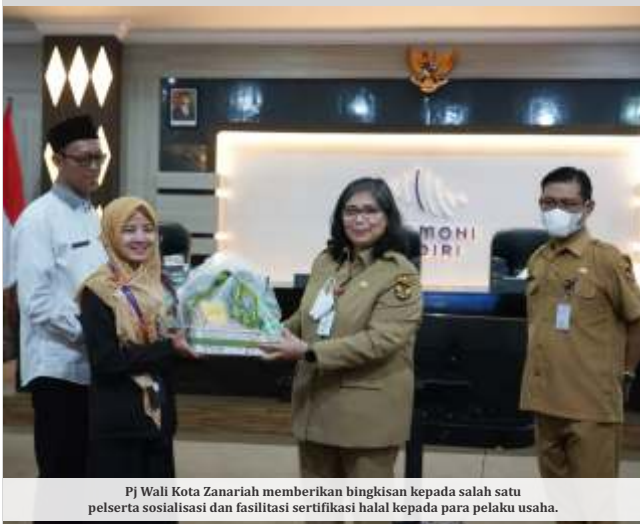
Pj Wali Kota Zanariah memberikan bingkisan kepada salah satu peserta sosialisasi dan fasilitasi sertifikasi halal kepada para pelaku usaha.

KEDIRI – Disperdagin Kota Kediri 2023 menyebutkan dari 13.133 pelaku industri termasuk 8.765 pelaku usaha makanan dan minuman, baru 3.657 pelaku usaha mendapat sertifikasi halal. Kondisi tersebut menjadi perhatian Pj Wali Kota Kediri Zanariah