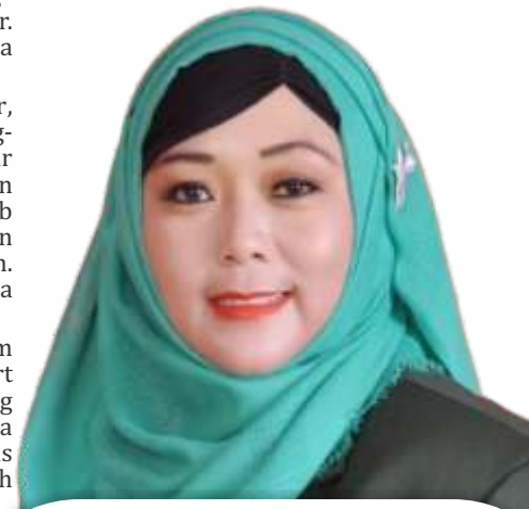
LAILA MUFIDAH WAKIL KETUA DPRD SURABAYA