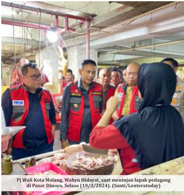
Pj Wali Kota Malang, Wahyu Hidayat, saat meninjau lapak pedagang di Pasar Dinoyo, Selasa (19/3/2024).

MALANG - Pemerintah Kota (Pemkot) Malang secara intensif memastikan ketersediaan pangan terjangkau bagi masyarakat, menjelang perayaan Idul Fitri 1445 Hijriah/2024 nanti. Tak hanya itu, stok bahan bakar minyak (BBM) juga dipantau keamanannya.