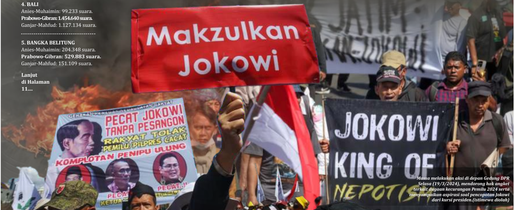
Massa melakukan aksi di depan Gedung DPR Selasa (19/3/2024), mendorong hak angket terkait dugaan kecurangan Pemilu 2024 serta menyampaikan aspirasi soal pencopotan Jokowi dari kursi presiden. (istimewa diolah)