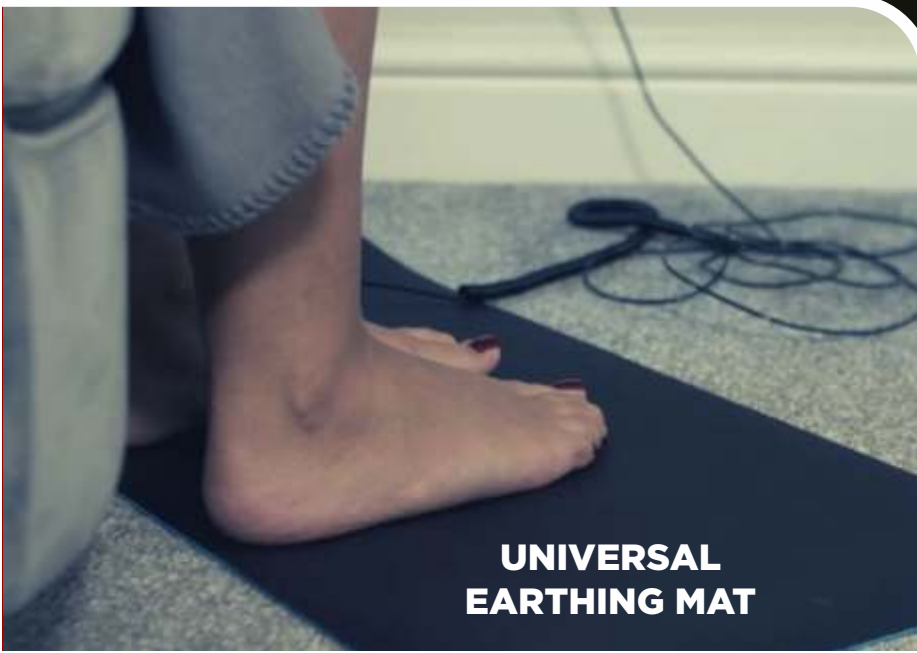
UNIVERSAL EARTHING MAT

Memang penelitian terkait grounding dan earthing masih terus dikembangkan. Namun, tak ada salahnya mencoba melakukan terapi ini dan melihat bagaimana dampaknya bagi diri sendiri. Baik di dalam maupun luar ruangan, grounding bisa dilakukan kapanpun sepanjang hari. Hanya saja, pastikan lingkungan sekitar saat melakukan grounding benar-benar aman dari risiko cedera (Kompas/ BentangPustaka)