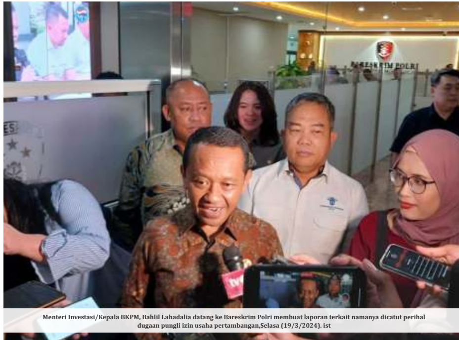
Menteri Investasi/Kepala BKPM, Bahlil Lahadalia datang ke Bareskrim Polri membuat laporan terkait namanya dicabut perihal dugaan pungli izin usaha pertambangan, Selasa (19/3/2024). ist

Adapun kementerian Investasi/BKPM mendapat mandat melakukan pencabutan IUP pada Januari-November 2022. Di sisi lain pemerintah juga