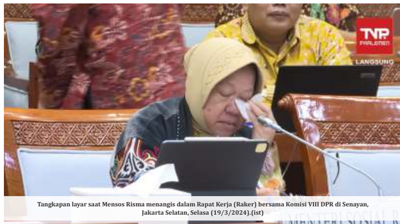
Tangkapan layar saat Mensos Risma menangis dalam Rapat Kerja (Raker) bersama Komisi VIII DPR di Senayan, Jakarta Selatan, Selasa (19/3/2024).