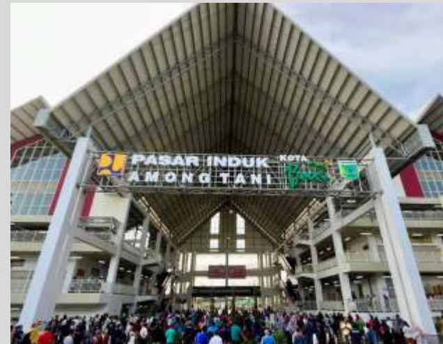
Pasar Induk Among Tani Kota Batu.

Sebagai informasi, Pasar Induk Among Tani Kota Batu sendiri telah