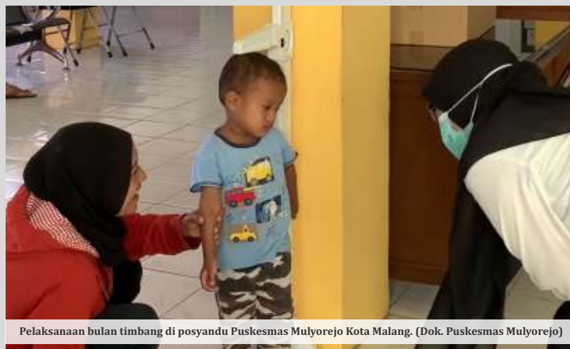
Pelaksanaan bulan timbang di posyandu Puskesmas Mulyorejo Kota Malang.

Wahyu menyampaikan, di triwulan kedua kepemimpinannya ini telah menunjukkan progres positif dalam penurunan angka stunting. Menurutnya, di awal 2024 ini angka stunting berada pada 8,38 persen