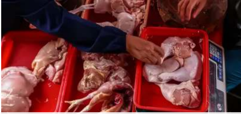
(Ilustrasi) Beberapa komoditas pangan masih terus mengalami kenaikan harga hingga H-6 lebaran. (ist-lptn6)

JAKARTA- Kondisi ekonomi Indonesia di awal tahun 2024 ini bak menghadapi tantangan ganda. Usai Pemilu Indonesia, masyarakat langsung menyambut datangnya bulan ramadan.