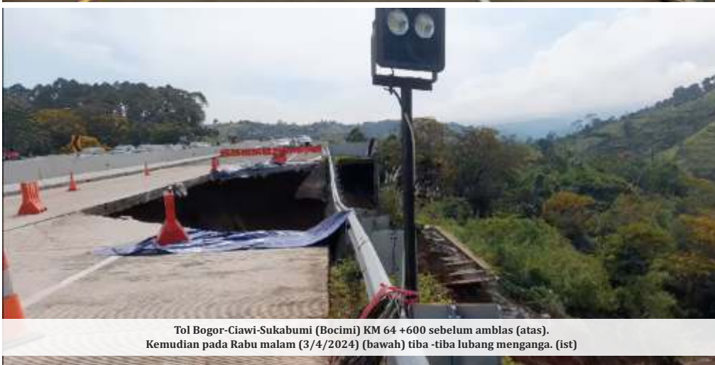
Tol Bogor-Ciawi-Sukabumi (Bocimi) KM 64 +600 sebelum amblas (atas). Kemudian pada Rabu malam (3/4/2024) (bawah) tiba-tiba lubang menganga. (ist)

JAKARTA -Ketua Komisi V DPR Lasarus meminta dilakukan audit terkait konstruksi jalan Tol Bogor-Ciawi-Sukabumi (Tol Bocimi) yang amblas pada Rabu (3/4/2024) kemarin. Dia mengatakan ada kemungkinan perencanaan dalam pembangunan jalan tol tidak dikerjakan dengan baik.