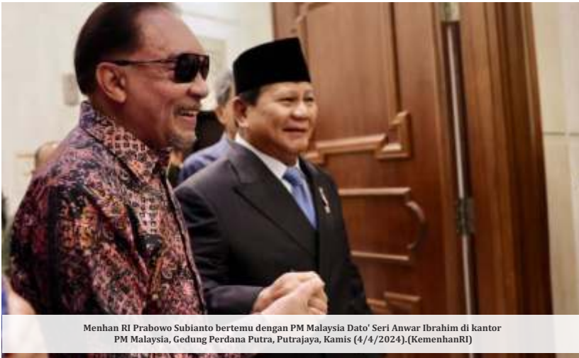
Menhan RI Prabowo Subianto bertemu dengan PM Malaysia Dato' Seri Anwar Ibrahim di kantor PM Malaysia, Gedung Perdana Putra, Putrajaya, Kamis (4/4/2024).

JAKARTA - Menteri Pertahanan RI Prabowo Subianto melanjutkan lawatan ke Malaysia selepas menyambangi Cina pada Minggu (31/3/2024) dan Jepang (3/4/2024) untuk bertemu dengan Perdana Menteri (PM) Malaysia Anwar Ibrahim di Kuala Lumpur, Kamis (4/4/2024).