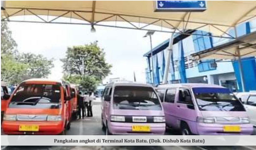
Pangkalan angkot di Terminal Kota Batu.

BATU - Pemerintah Kota (Pemkot) Batu telah menyiapkan 42 angkot gratis, untuk melayani mobilitas ratusan siswa menuju sekolah. Penjabat (Pj) Wali Kota Batu, Aries Agung Paewai mengatakan, program ini akan segera diuji coba setelah libur Lebaran 2024 mendatang.