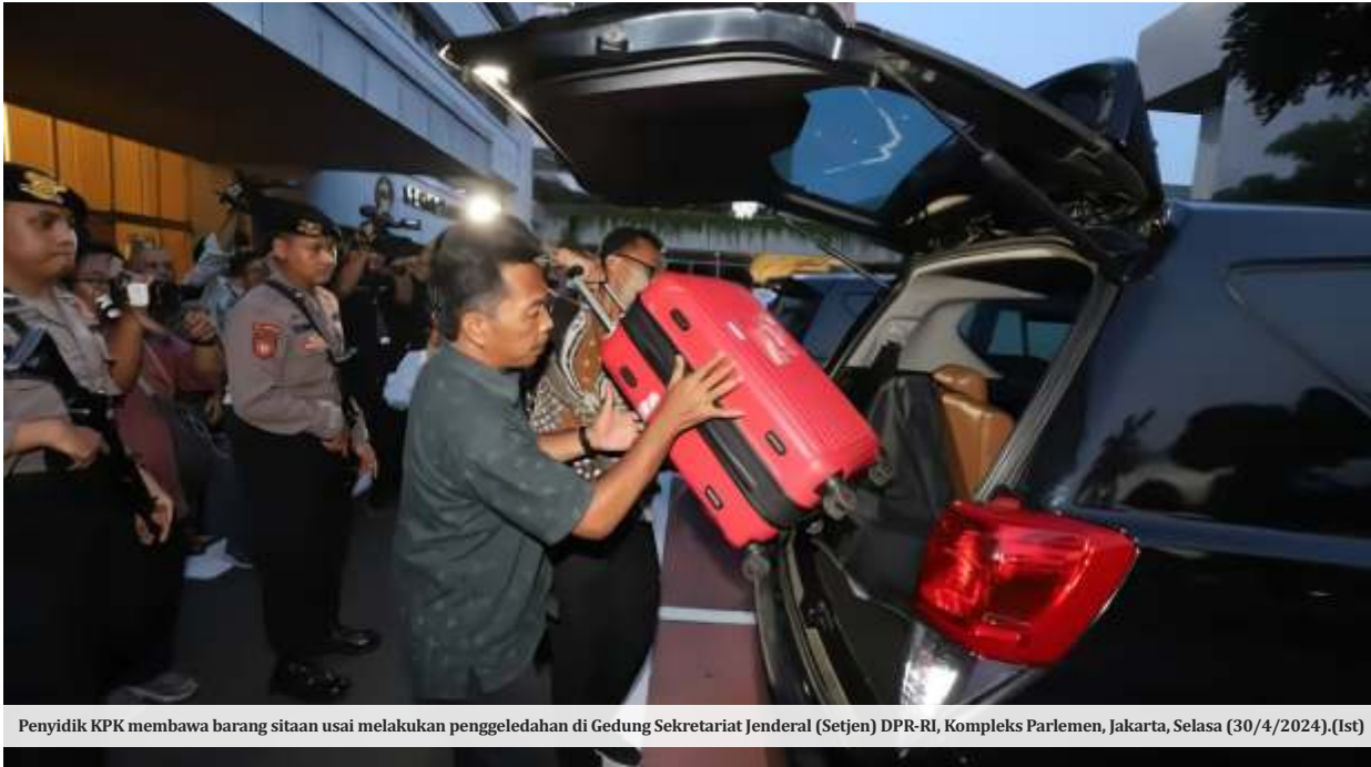
Penyidik KPK membawa barang sitaan usai melakukan penggeledahan di Gedung Sekretariat Jenderal (Setjen) DPR-RI, Kompleks Parlemen, Jakarta, Selasa (30/4/2024).