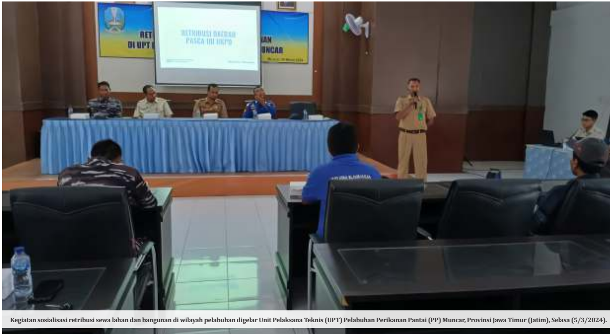
Kegiatan sosialisasi retribusi sewa lahan dan bangunan di wilayah pelabuhan digelar Unit Pelaksana Teknis (UPT) Pelabuhan Perikanan Pantai (PP) Muncar, Provinsi Jawa Timur (Jatim), Selasa (5/3/2024).

BANYUWANGI -Unit Pelaksana Teknis (UPT) Pelabuhan Perikanan Pantai (PP) Muncar, Provinsi Jawa Timur (Jatim) menggelar sosialisasi retribusi sewa lahan dan bangunan di wilayah pelabuhan, Selasa (5/3/2024).