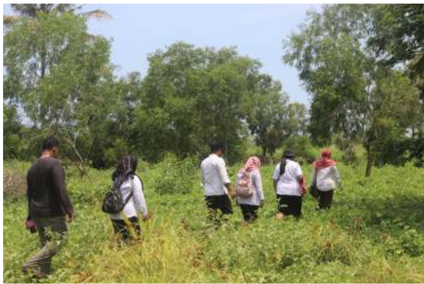
Tim dari Cabang Dinas Kelautan dan Perikanan Kabupaten Situbondo melalui Seksi Konservasi Kelautan saat melakukan ground check kondisi eksisting mangrove di Pantai Tlepek Desa Gondoruso Kabupaten Lumajang, Rabu (6/3/2024).