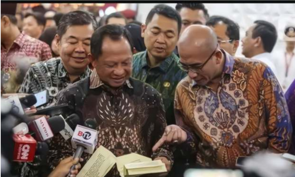
Menteri Dalam Negeri, Tito Karnavian menyerahkan Data Penduduk Potensial Pemilih Pemilu (DP4) untuk Pemilihan Kepala Daerah (Pilkada) serentak 2024 kepada Komisi Pemilihan Umum (KPU) Republik Indonesia di Kantor KPU RI, Jakarta, Kamis (2/5/2024).

JAKARTA - Menteri Dalam Negeri (Mendagri) Tito Karnavian mengatakan, anggaran penyelenggaraan Pemilihan Kepala Daerah (Pilkada) 2024 mencapai Rp 27 triliun. Total anggaran tersebut merupakan kebutuhan bagi Komisi Pemilihan Umum Daerah (KPU D) dan Badan Pengawas Pemilu (Bawaslu) daerah. Biaya tersebut seluruhnya akan ditanggung anggaran pendapatan dan belanja daerah (APBD).