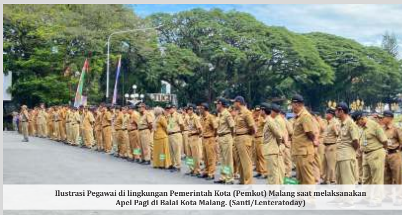
Ilustrasi Pegawai di lingkungan Pemerintah Kota (Pemkot) Malang saat melaksanakan Apel Pagi di Balai Kota Malang.

Lebih lanjut, dengan tema Hardiknas 2024 "Bergerak Bersama, Lanjutkan Merdeka Belajar" Suwarjana menyebut, hal ini