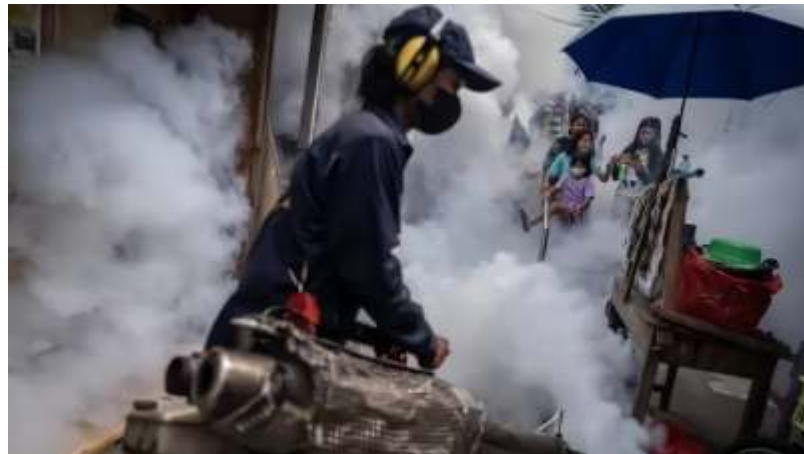
Seorang petugas melakukan pengasapan (fogging) di kawasan permukiman, Kelurahan Grogol, Jakarta, Kamis (2/5/2024) untuk mencegah DBD.

"Nah sekarang El Ninonya bisa jadi lebih sering, kalau lebih sering, dengunya juga jadi naik. Dampaknya