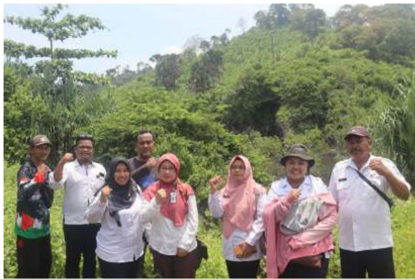
Tim dari Cabang Dinas Kelautan dan Perikanan Kabupaten Situbondo melalui Seksi Konservasi Kelautan saat melakukan ground check kondisi eksisting mangrove di Pantai Tlepek Desa Gondoruso Kabupaten Lumajang, Rabu (6/3/2024).

LUMAJANG- Dinas Kelautan dan Perikanan (DKP) Jawa Timur melalui Cabang Dinas Kelautan dan Perikanan Kabupaten Situbondo melalui Seksi Konservasi Kelautan melaksanakan kegiatan ground check kondisi eksisting mangrove di Pantai Tlepek Desa Gondoruso Kabupaten Lumajang. Kegiatan pada Rabu (6/3/2024) tersebut bertujuan untuk melihat kesesuaian hasil kegiatan pemetaan dengan kondisi eksisting.