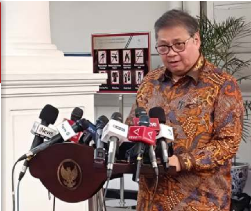
Menko Perekonomian Airlangga Hartarto

Sejak Maret 2023, Kemenag telah membentuk Tim Pelaksana Tugas Komite Fatwa Produk Halal yang terdiri dari 25 ulama dan akademisi. Pembentukan tim ini dalam rangka mempercepat capaian sertifikasi halal. Pembentukan Komite Fatwa Produk Halal ini sesuai dengan kebijakan yang tercantum dalam UU Nomor 6 tahun 2023 tentang Penetapan Peraturan Pemerintah Pengganti Undang-Undang Nomor 2 Tahun 2022 tentang Cipta Kerja menjadi Undang-Undang.