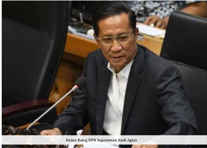
Ketua Baleg DPR Supratman Andi Agtas

Mengenai isi materi revisinya, dia mengatakan bakal diperdebatkan di tingkat panitia kerja (panja) berdasarkan kajian akademik.