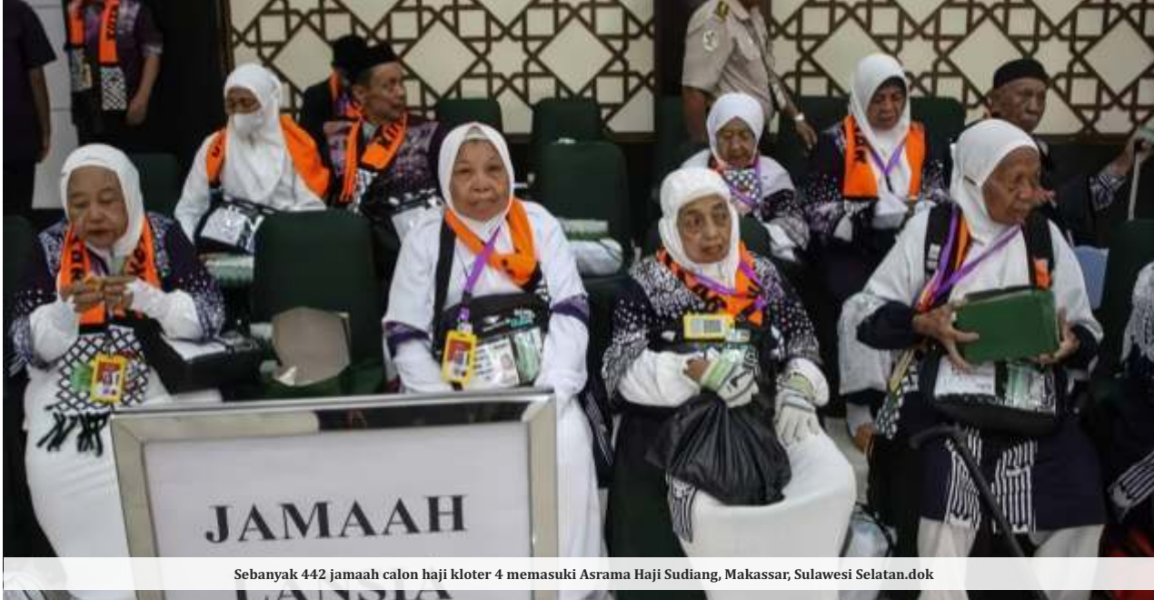
Sebanyak 442 jamaah calon haji kloter 4 memasuki Asrama Haji Sudiang, Makassar, Sulawesi Selatan.dok

JAKARTA - Pesawat yang membawa jamaah haji kloter 5 asal embarkasi Makassar kembali ke Bandara Sultan Hasanuddin. Garuda Indonesia mengatakan pesawat melakukan prosedur return to base (RTB).