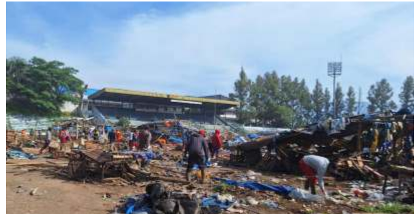
Pekerja sedang melakukan proses pembersihan Stadion Gelora Brantas.

"Perbaikan kerusakan pada permukaan lapangan, seperti memperbaiki rumput yang rusak atau mengisi lubang-lubang yang terbentuk selama penggunaan pasar. Selain itu, mungkin diperlukan juga perbaikan