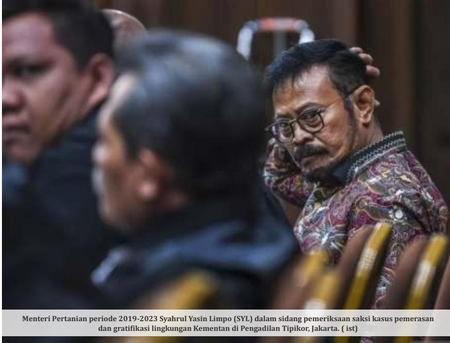
Menteri Pertanian periode 2019-2023 Syahrul Yasin Limpo (SYL) dalam sidang pemeriksaan saksi kasus pemerasan dan gratifikasi lingkungan Kementan di Pengadilan Tipikor, Jakarta.