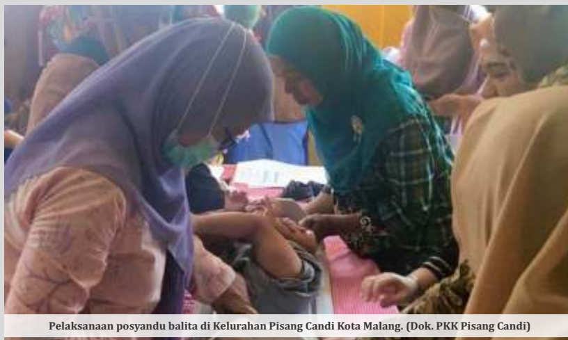
Pelaksanaan posyandu balita di Kelurahan Pisang Candi Kota Malang.

Menurut Wahyu, pekerja di perusahaan diharapkan menjadi "bapak asuh" yang secara aktif membantu memantau perkembangan dan kebutuhan anak-anak tersebut. Hal ini memungkinkan setiap