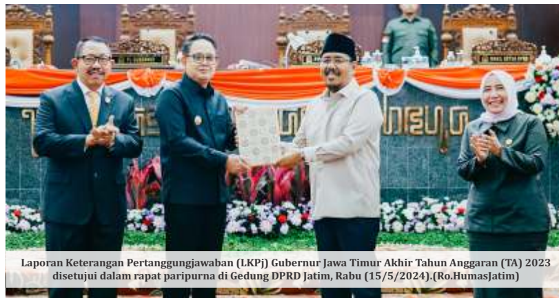
Laporan Keterangan Pertanggungjawaban (LKPJ) Gubernur Jawa Timur Akhir Tahun Anggaran (TA) 2023 disetujui dalam rapat paripurna di Gedung DPRD Jatim, Rabu (15/5/2024).

"Realisasi investasi 2023 mencapai 145 triliun, sudah melampaui target sebesar 112 triliun