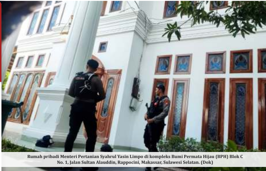
Rumah pribadi Menteri Pertanian Syahrul Yasin Limpo di kompleks Bumi Permata Hijau (BPH) Blok C No. 1, Jalan Sultan Alauddin, Rappocini, Makassar, Sulawesi Selatan. (Dok)