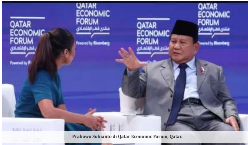
Prabowo Subianto di Qatar Economic Forum, Qatar.

"Kita tumbuh harus di atas 6, 7, 8 persen. Tentu dalam 2-3 tahun diharapkan dunia berubah, geopolitik berubah. Kalau geopolitik aman, kan kita bisa memanfaatkan bantalan fiskal yang selama ini dilakukan untuk subsidi," kata Airlangga usai rapat di Istana Kepresidenan Jakarta pada Kamis (16/5/2024).