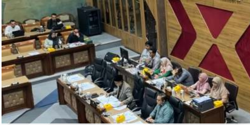
Aliansi Badan Eksekutif Mahasiswa Seluruh Indonesia (BEM SI) mengadukan kenaikan Uang Kuliah Tunggal (UKT) di beberapa universitas negeri ke Komisi X DPR RI, Kamis (16/5/2024).

Komisi X DPR RI juga mendesak Kementerian Pendidikan, Kebudayaan, Riset, dan Teknologi (Kemendikbudristek) agar memperbaiki tata kelola pembiayaan pendidikan di perguruan tinggi atau