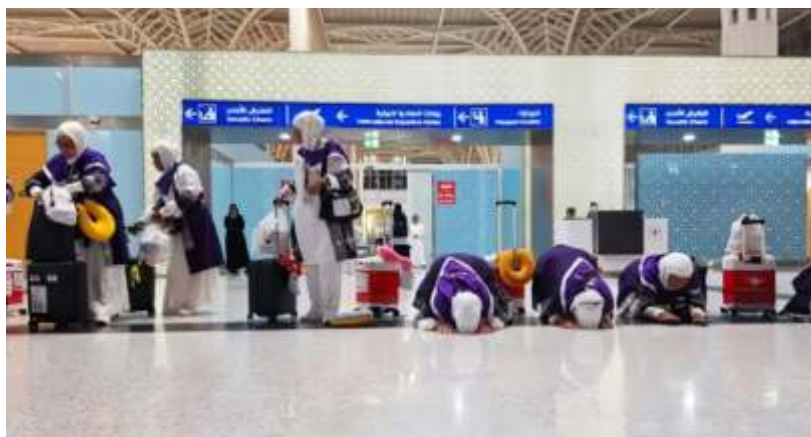
Jamaah haji Indonesia langsung sujud syukur saat tiba di bandara Bandara Amir Muhammad Bin Abdul Aziz (AMAA) Madinah.

"Pemerintah mengimbau kepada jamaah haji untuk bisa membatasi aktivitas fisik yang menguras energi bahkan menjelang keberangkatan.