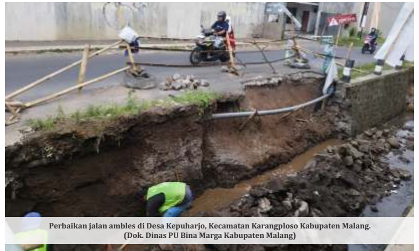
Perbaikan jalan ambles di Desa Kepuharjo, Kecamatan Karangploso Kabupaten Malang.

Oong menyebutkan, pengerjaan perbaikan jalan ambles ini akan melibatkan beberapa tahapan. Pertama, yakni akan dilakukan pemasangan plengsengan batu kali guna memperkuat fondasi jalan yang rapuh. Langkah ini, lanjut Oong, diikuti