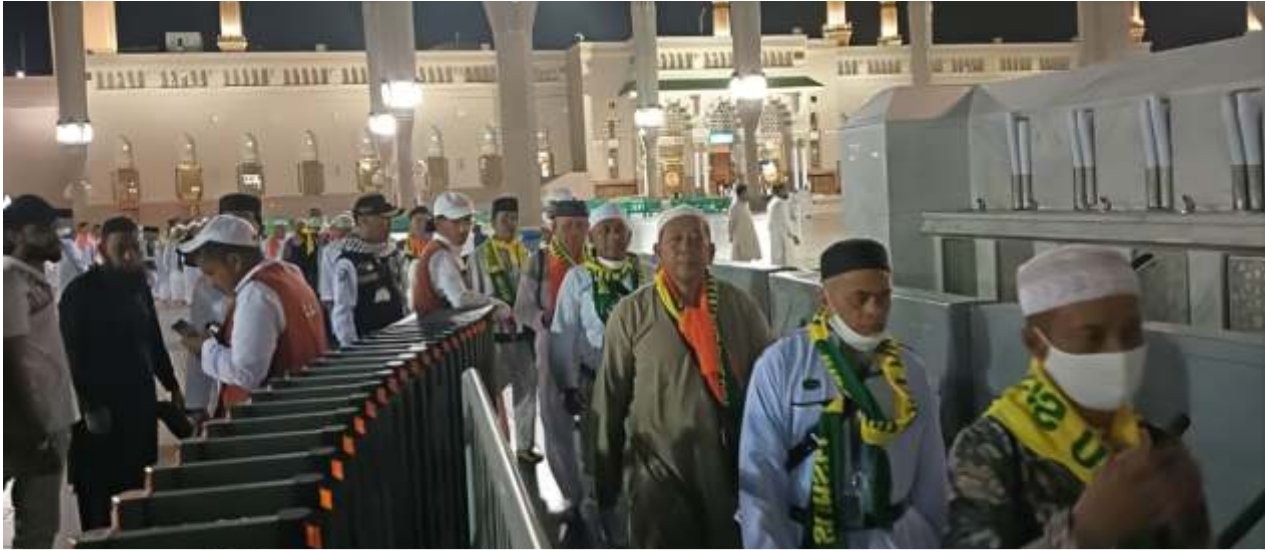
Jamaah Haji Indonesia saat antrre memasuki Raudhah di Masjid Nabawi.

JAKARTA- Jamaah haji berangsur mulai menuju kota Makkah. Di sisi lain ada kekhawatiran karena disinyalir masih banyak jamaah umrah Indonesia bertahan di tanah suci.