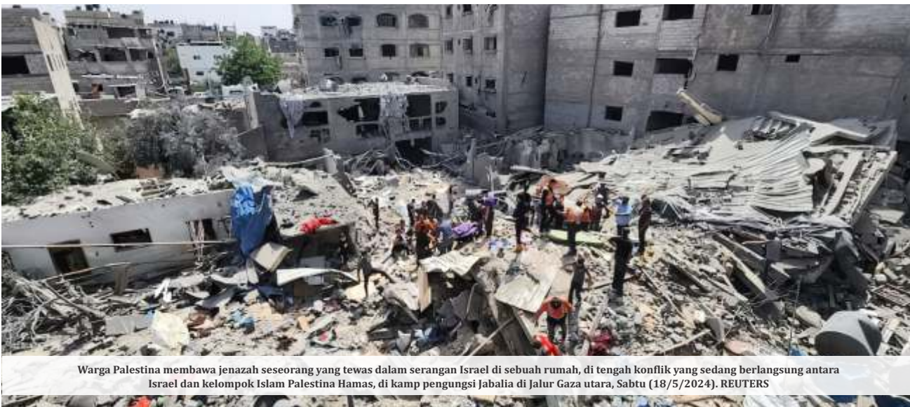
Warga Palestina membawa jenazah seseorang yang tewas dalam serangan Israel di sebuah rumah, di tengah konflik yang sedang berlangsung antara Israel dan kelompok Islam Palestina Hamas, di kamp pengungsi Jabalia di Jalur Gaza utara, Sabtu (18/5/2024).

KAIRO - Pesawat dan tank Israel menggempur daerah-daerah di Jalur Gaza pada Minggu (12/5/2024). Padahal dinsaas bersamaan, penasihat keamanan nasional Gedung Putih Jake Sullivan bertemu dengan Perdana Menteri Israel Benjamin Netanyahu. Pertemuan itu dikatakan membicarakan seruan AS untuk kampanye militer yang lebih terfokus.