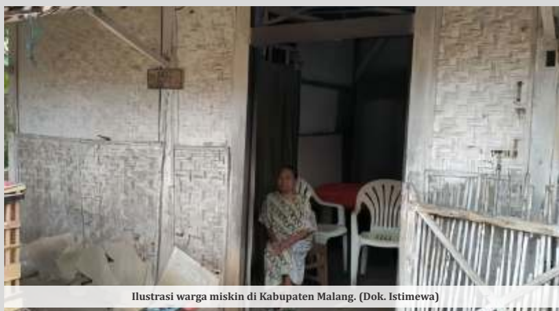
Ilustrasi warga miskin di Kabupaten Malang. (Dok. Istimewa)

Pantja menyebutkan, jenis-jenis PPKS yang menjadi prioritas pelayanan meliputi anak terlantar, anak yang berhadapan dengan hukum, anak jalanan, anak dengan disabilitas, anak yang menjadi korban kekerasan, dan anak yang memerlukan perlindungan khusus.