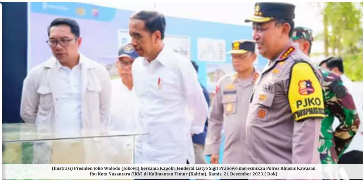
(Ilustrasi) Presiden Joko Widodo (Jokowi) bersama Kapolri Jenderal Listyo Sigit Prabowo meresmikan Polres Khusus Kawasan Ibu Kota Nusantara (IKN) di Kalimantan Timur (Kaltim), Kamis, 21 Desember 2023.

Soekarno Djojonegoro merupakan Kapolri kedua yang menjabat selama 4 tahun, 14 hari, yakni antara 15 Desember 1959 hingga 29 Desember 1963.