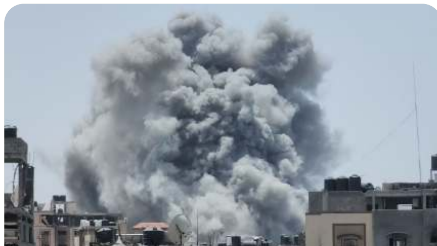
Serangan di kamp pengungsi Jabalia, Sabtu (18/5/2024).

Pada bulan Maret, ketika Presiden Joe Biden mengumumkan rencana pembangunan dermaga di negaranya, dia berkata: "Tidak ada kapal AS yang akan mendarat." (wid,reuters,rls/dya)