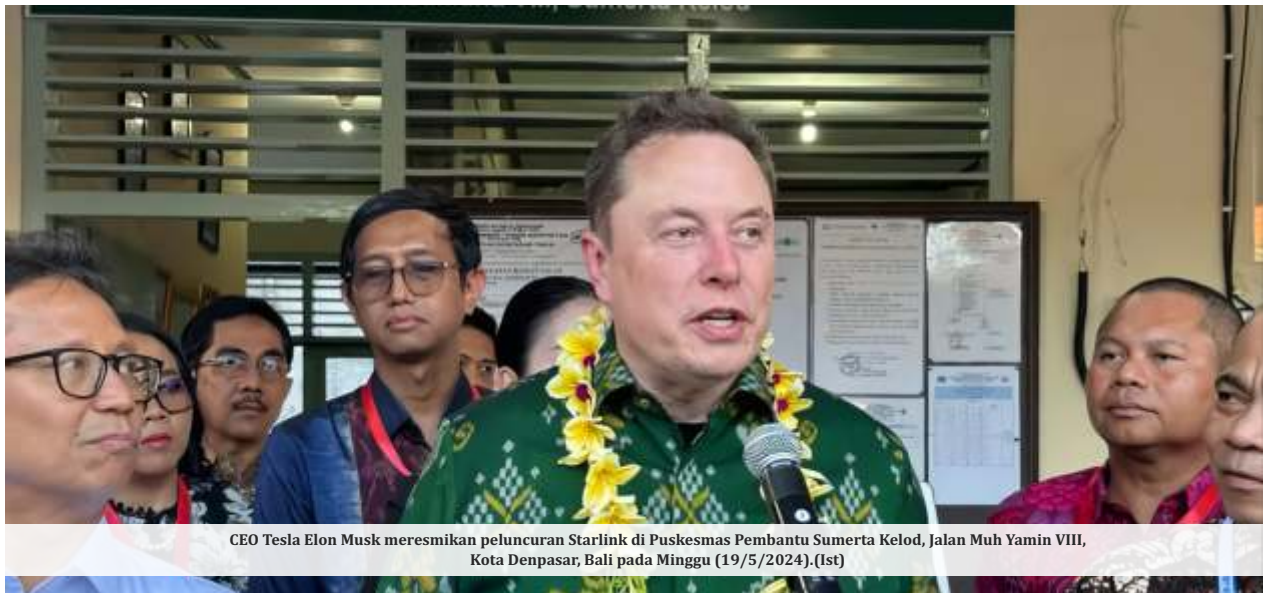
CEO Tesla Elon Musk meresmikan peluncuran Starlink di Puskesmas Pembantu Sumerta Kelod, Jalan Muh Yamin VIII, Kota Denpasar, Bali pada Minggu (19/5/2024).

DENPASAR -CEO Tesla Inc sekaligus SpaceX, Elon Musk belum memberikan sinyal kejelasan soal investasi mobil listrik atau electric vehicle (EV) Tesla di Indonesia. Dia malah memberikan kode bakal investasi melalui anak usahanya yang lain.