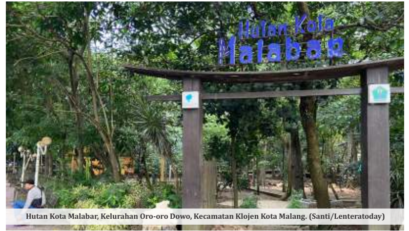
Hutan Kota Malabar, Kelurahan Oro-oro Dowo, Kecamatan Klojen Kota Malang.

Lebih lanjut, Rahman menjelaskan, Hutan Kota Malabar memiliki ribuan pohon dengan berbagai jenis yang dapat menjadi sarana edukasi bagi masyarakat. Meskipun sekilas tampak kurang terurus, menurutnya