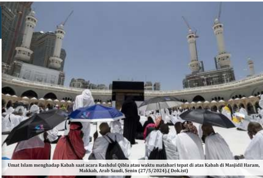
Umat Islam menghadap Kabah saat acara Rashdul Qibla atau waktu matahari tepat di atas Kabah di Masjidil Haram, Makkah, Arab Saudi, Senin (27/5/2024).

Sementara itu, resor musim panas Kerajaan diperkirakan bakal mendapat curah hujan yang lebih tinggi dibandingkan rata-rata curah hujan saat musim panas biasa.