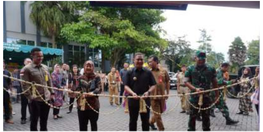
Pj Wali Kota Batu, Aries Agung Paewai, resmi membuka Batu Bisnis Festival 2024, Selasa (28/5/2024).

koordinasi dari semua pihak sangat diperlukan untuk mencapai target tersebut," tegasnya.