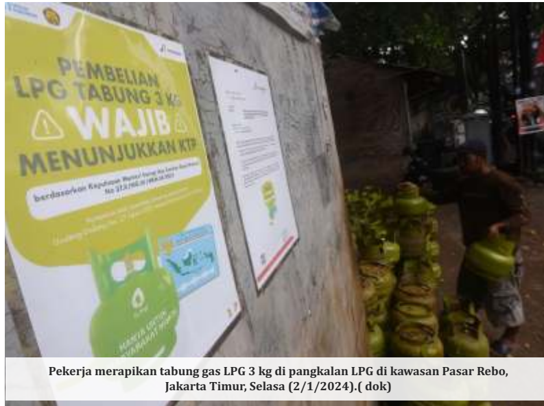
Pekerja merapikan tabung gas LPG 3 kg di pangkalan LPG di kawasan Pasar Rebo, Jakarta Timur, Selasa (2/1/2024).

"Jadi kami siapkan sistem dan infrastruktur untuk itu. Sehingga