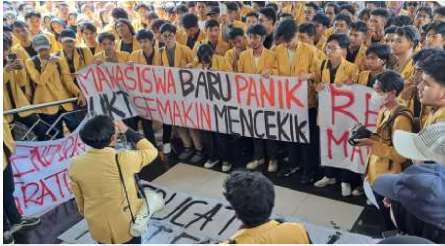
Mahasiswa demo tolak kenaikan UKT di halaman Rektorat Unsoed Purwokerto, Banyumas, Jumat (26/4/2024).

"Tentang isu IPI yang mengkomersialisasikan sistem Pendidikan. Dan juga tentang pembungkaman