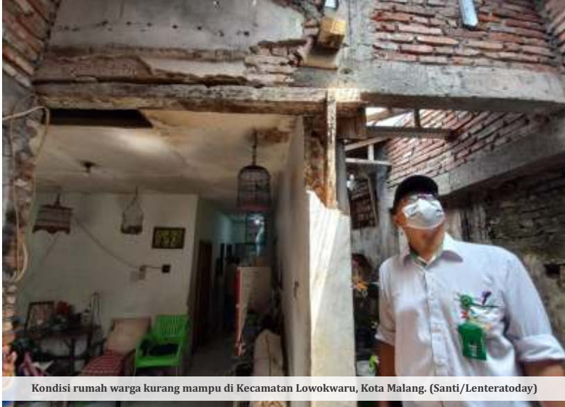
Kondisi rumah warga kurang mampu di Kecamatan Lowokwaru, Kota Malang.

MALANG - Sepanjang tahun 2023, sebanyak 400 warga miskin di Kota Malang berhasil tergraduasi dari garis kemiskinan. Kepala Dinsos-P3AP2KB Kota Malang, Donny Sandito menegaskan, meskipun telah tergraduasi, warga tersebut masih mendapatkan pendampingan berkelanjutan agar tidak kembali jatuh