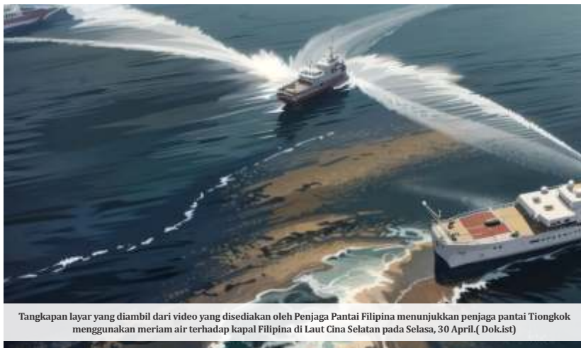
Tangkapan layar yang diambil dari video yang disediakan oleh Penjaga Pantai Filipina menunjukkan penjaga pantai Tiongkok menggunakan meriam air terhadap kapal Filipina di Laut Cina Selatan pada Selasa, 30 April.

Militer Filipina menyebut perahu karet milik Penjaga Pantai Cina mendekati BRP Sierra Madre hanya