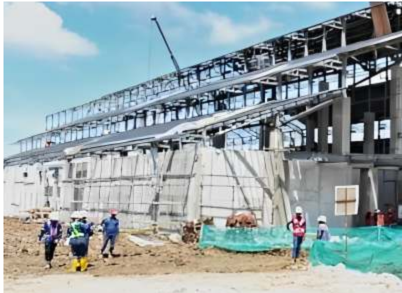
Progres pembangunan Bandara Ibu kota Nusantara (IKN) di Penajam Paser Utara, Kalimantan Timur, Senin (3/6/2024).

Ia mengakui bahwa keputusannya untuk mundur apalagi menjelang upacara HUT ke-79 RI di Nusantara