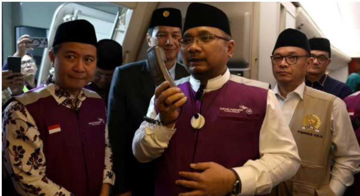
Menag Yaqut Cholil Qoumas didampingi Dirjen Penyelenggara Haji dan Umroh Hilman Latief menyampaikan ucapan selamat jalan kepada jamaah calon haji sebelum diberangkatkan ke Tanah Suci di Bandara Soekarno Hatta, Tangerang, Banten, Minggu (12/5/2024). Ist.dok

Ashabul menyampaikan, 100.000 jamaah umrah yang belum pulang ke