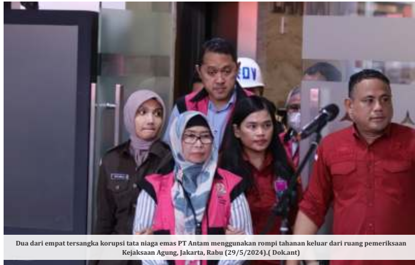
Dua dari empat tersangka korupsi tata niaga emas PT Antam menggunakan rompi tahanan keluar dari ruang pemeriksaan Kejaksaan Agung, Jakarta, Rabu (29/5/2024).

adalah perolehannya ilegal. Harusnya mereka harus melalui verifikasi, melalui studi kelayakan, semuanya itu ada prosedurnya untuk memasukkan emas ke Antam," jelasnya.