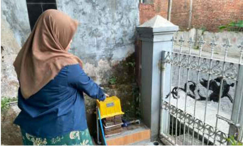
(ilustrasi) Alat meteran air di Kabupaten Malang yang banyak dicuri oleh oknum.

MALANG - Dalam kurun waktu kurang dari 6 bulan, Perusahaan Umum Daerah (Perumda) Air Minum Tirta Kanjuruhan Kabupaten Malang, mencatat 120 unit alat meteran air telah raib dicuri.