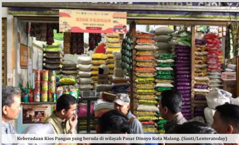
Keberadaan Kios Pangan yang berada di wilayah Pasar Dinoyo Kota Malang.

"Kita kan sudah punya Warung Tekan Inflasi (WTI). Nah kemarin Kios Pangan diresmikan, itu adalah untuk mempermudah orang-orang yang akan beli. Jadi dengan Kios Pangan, kita akan tekan juga harga-harga di sekitar kawasan yang sudah beridiri Kios Pangan," ujar Wahyu, saat dikonfirmasi awak media, Selasa (11/6/2024).