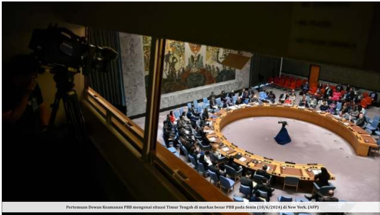
Pertemuan Dewan Keamanan PBB mengenai situasi Timur Tengah di markas besar PBB pada Senin (10/6/2024) di New York.

NEW YORK- Dewan Keamanan Persekutuan Bangsa-Bangsa (DK PBB) menyetujui resolusi yang dirancang Amerika Serikat (AS) untuk gencatan senjata di Gaza, Palestina. Resolusi tersebut diadopsi dengan 14 suara mendukung, sementara satu abstain oleh Rusia.