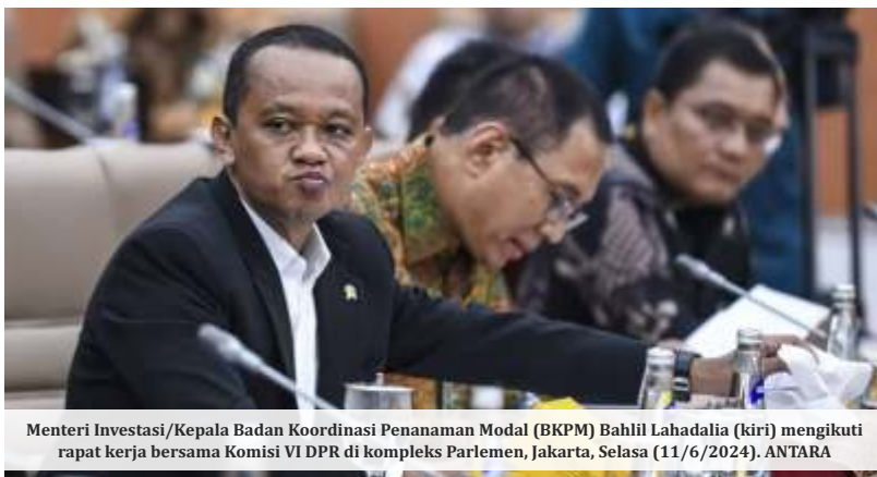
Menteri Investasi/Kepala Badan Koordinasi Penanaman Modal (BKPM) Bahlil Lahadalia (kiri) mengikuti rapat kerja bersama Komisi VI DPR di kompleks Parlemen, Jakarta, Selasa (11/6/2024).

"Jadi saya menyarankan kepada pimpinan, kita revisi saja RKP-nya, dari (target investasi 2025) Rp1.850 triliun menjadi Rp800 triliun. Itu rasionalisasi yang saya dan tim buat. Saya tidak mau menjadikan staf saya kambing hitam besok nanti," tuturnya.