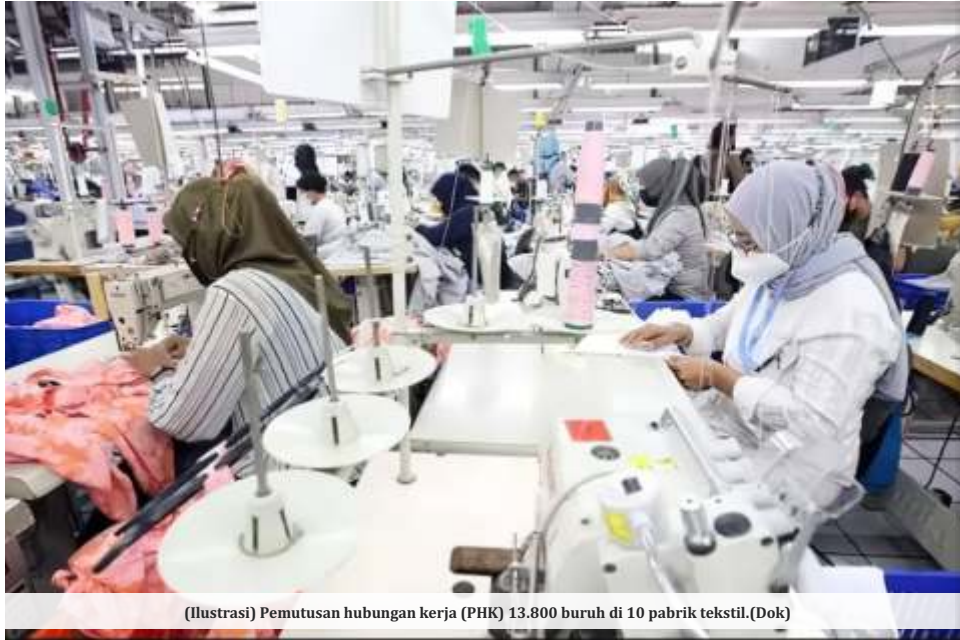
(Ilustrasi) Pemutusan hubungan kerja (PHK) 13.800 buruh di 10 pabrik tekstil.

ada uang, mempekerjakan ndak ada pekerjaan," ungkap Ristadi saat dikonfirmasi.