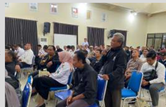
Salah satu pengurus HIPAM di Kota Malang saat menyampaikan aspirasinya kepada Pj Wahyu Hidayat, Rabu (3/7/2024). (Santi/Lenteratoday)

Sementara itu, Bupati Malang, Sanusi, menggarisbawahi pengelolaan air limbah domestik yang buruk dapat menurunkan kualitas lingkungan dan kesehatan masyarakat. "Kita perlu melestarikan sumber daya air dan fungsi lingkungan hidup. Oleh karena itu, regulasi yang dibentuk pemerintah nanti akan sangat penting," kata Sanusi.