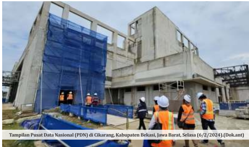
Tampilan Pusat Data Nasional (PDN) di Cikarang, Kabupaten Bekasi, Jawa Barat, Selasa (6/2/2024).

Menurut Brain Cipher, kunci PDN diberikan secara gratis lantaran perundingan dengan pemerintah menemui jalan buntu. Sebab, tulis Brain Cipher, pemerintah menggunakan pihak ketiga untuk menyelesaikan masalah.