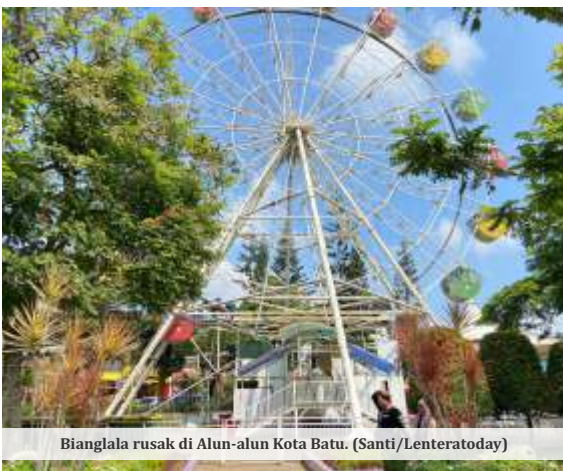
Bianglala rusak di Alun-alun Kota Batu.

BATU - Revitalisasi bianglala di Alun-alun Kota Batu direncanakan melibatkan investor atau pihak ketiga. Hal ini diaorot Dewan Perwakilan Rakyat Daerah (DPRD) Kota Batu yang mendorong Pemkot menggunakan Anggaran Pendapatan dan Belanja Daerah (APBD) saja.