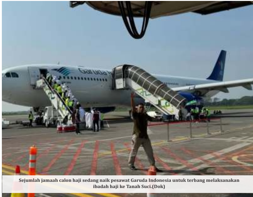
Sejumlah jamaah calon haji sedang naik pesawat Garuda Indonesia untuk terbang melaksanakan ibadah haji ke Tanah Suci.

Lebih lanjut, Irfan mengatakan, 96% keterlambatan disebabkan oleh aspek operasional dan 4% aspek teknis armada. Dia mengatakan,