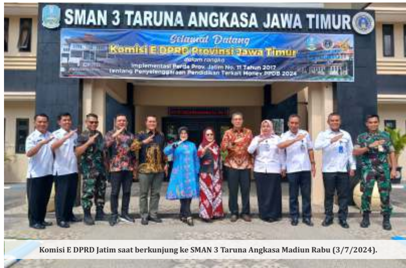
Komisi E DPRD Jatim saat berkunjung ke SMAN 3 Taruna Angkasa Madiun Rabu (3/7/2024).