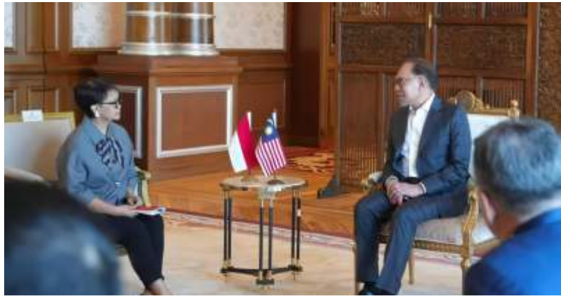
Menteri Luar Negeri Indonesia Retno Marsudi (kiri) bertemu Perdana Menteri Malaysia Anwar Ibrahim (kanan) di Kuala Lumpur, pada Rabu (3/7/2024).

Dari tujuh segmen batas tersebut, empat segmen berada di Kalimantan Barat atau Sektor Barat dan tiga segmen di Kalimantan Utara atau