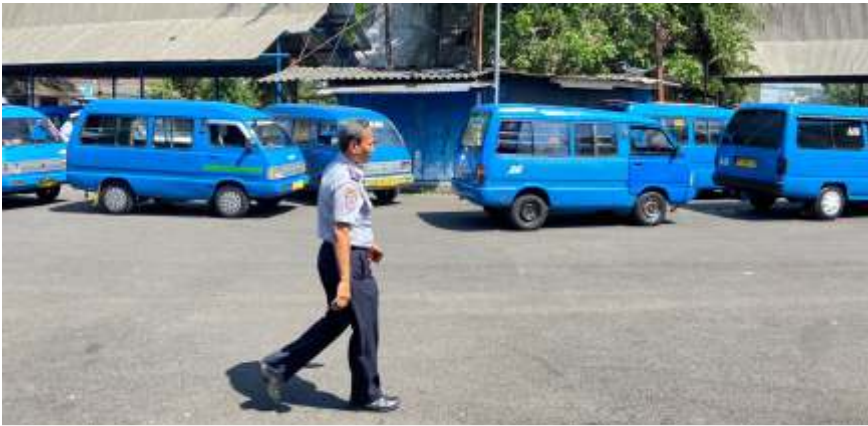
Pangkalan angkot di Terminal Arjosari Kota Malang.