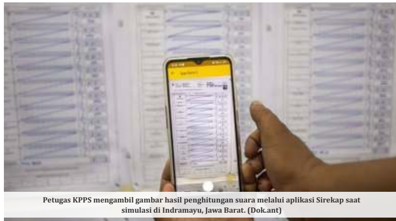
Petugas KPPS mengambil gambar hasil penghitungan suara melalui aplikasi Sirekap saat simulasi di Indramayu, Jawa Barat.

catatan evaluasi yang sudah-sudah mana yang harus diperbaiki dan seterusnya," ujarnya.