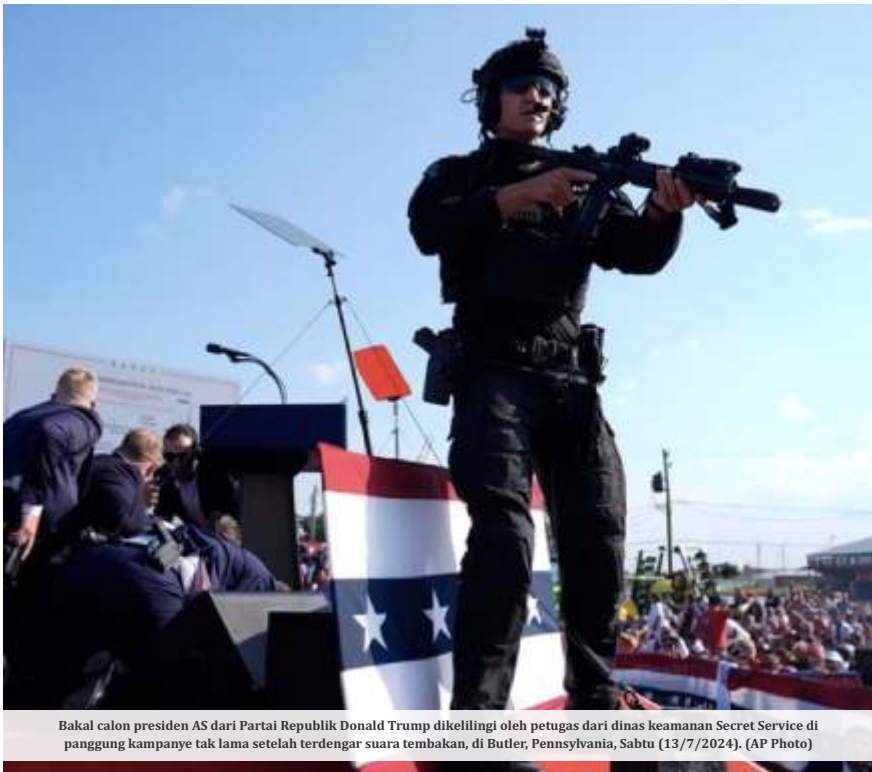
Bakal calon presiden AS dari Partai Republik Donald Trump dikelilingi oleh petugas dari dinas keamanan Secret Service di panggung kampanye tak lama setelah terdengar suara tembakan, di Butler, Pennsylvania, Sabtu (13/7/2024).

PENNSYLVANIA- Kampanye Calon Presiden AS Donald Trump di Pennsylvania, Sabtu (13/7/2024) sore waktu setempat dihujani tembakan. Trump selamat, tanpa berdarah di bagian telinga. Namun, dikabarkan 2 orang tewas, seorang pelaku dan peserta kampanye.