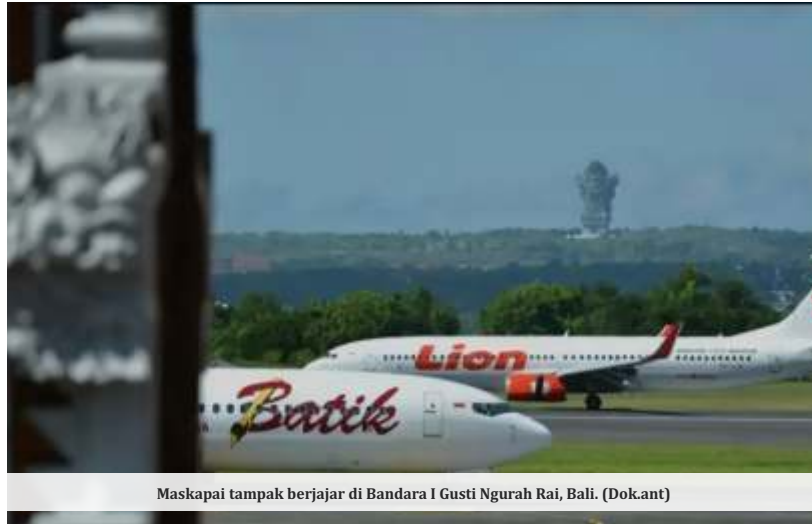
Maskapai tampak berjajar di Bandara I Gusti Ngurah Rai, Bali.

Berdasarkan data IATA, pada 2024 akan ada 4,7 miliar penumpang global