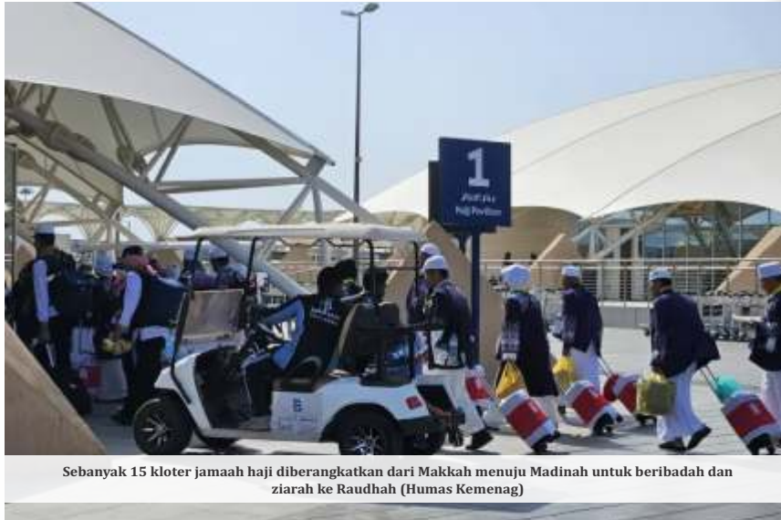
Sebanyak 15 kloter jamaah haji diberangkatkan dari Makkah menuju Madinah untuk beribadah dan ziarah ke Raudhah

"Begini ya, tentu karena semua sudah pansus, kita ingin sesuai dengan aturan, pansus bisa dilakukan kalau