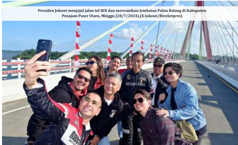
Presiden Jokowi menajal jalan tol IKN dan meresmikan Jembatan Pulau Balang di Kabupaten Penajam Paser Utara, Minggu (28/7/2024).

Sejumlah pengamat politik sependapat jika kehadiran influencer ke IKN tidak begitu diperlukan. Semestinya, kata pengamat politik Adi