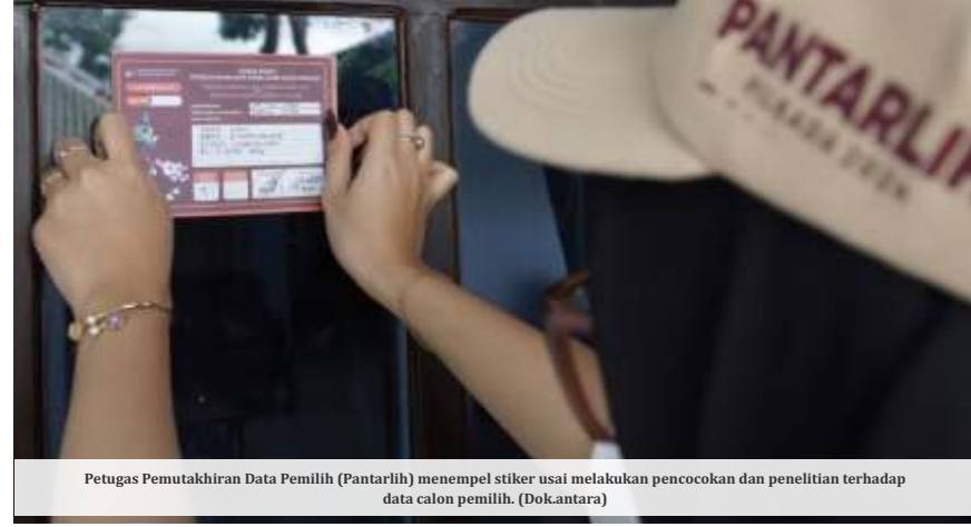
Petugas Pemutakhiran Data Pemilih (Pantarlih) menempel stiker usai melakukan pencocokan dan penelitian terhadap data calon pemilih.

Menurutnya, hasil pengawasan Bawaslu, terdapat juga pemilih disabilitas yang tidak dicantumkan ragam disabilitasnya. Kemudian,