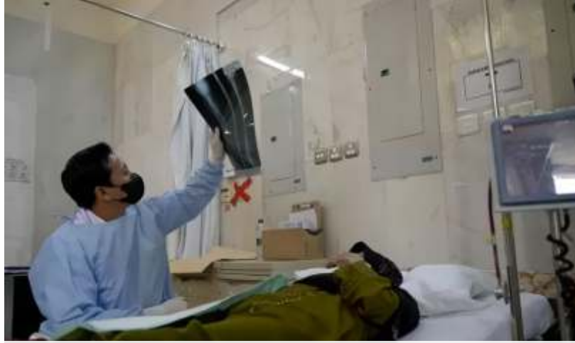
Terdapat jamaah haji Indonesia yang masih dirawat di Makkah, Madinah dan Jeddah. (dok)

Wakil Ketua DPR RI itu menegaskan, Pansus Angket Haji murni kerja wakil rakyat yang ingin membuktikan dugaannya apakah benar ada