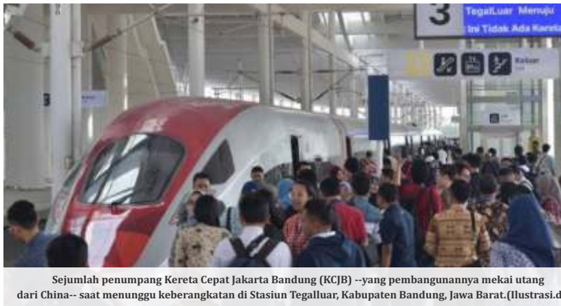
Sejumlah penumpang Kereta Cepat Jakarta Bandung (KCJB) --yang pembangunannya mekai utang dari China-- saat menunggu keberangkatan di Stasiun Tegalluar, Kabupaten Bandung, Jawa Barat. (Ilustrasi.dok)

Per akhir Juni 2024, profil jatuh tempo utang pemerintah Indonesia disebut terhitung cukup aman dengan rata-rata tertimbang jatuh tempo (average time maturity/ATM) di 8 tahun.