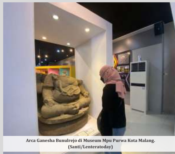
Arca Ganesha Bunulrejo di Museum Mpu Purwa Kota Malang.

"Jadi kami arahkan ke sana biar masyarakat tahu Kota Malang punya museum pendidikan. Karena kita punya museum masih kurang