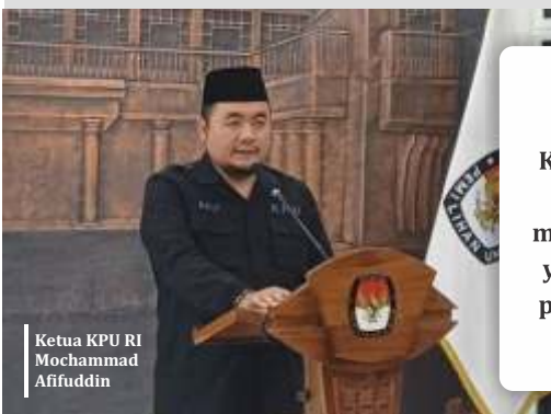
Ketua KPU RI Mochammad Afifuddin

“ Kami sudah menyiapkan PKPU terkait logistik itu yang agak mendesak. Pasti pencialonan yang sebulan lagi akan dibuka pendaftarannya dan ini sedang kita siapkan semuanya,