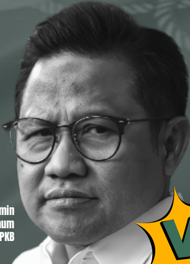
Cak Imin Ketua Umum PKB