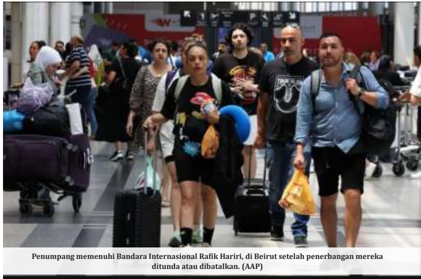
Penumpang memenuhi Bandara Internasional Rafik Hariri, di Beirut setelah penerbangan mereka ditunda atau dibatalkan.

Kedutaan Besar Republik Indonesia (KBRI) di London memberikan imbauan bagi Warga Negara Indonesia (WNI) yang berada di Inggris dan Irlandia, dikutip dari akun Instagram KBRI London