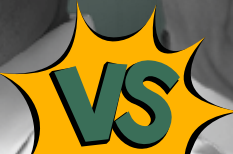
Gus Yahya Ketua Umum PBNU