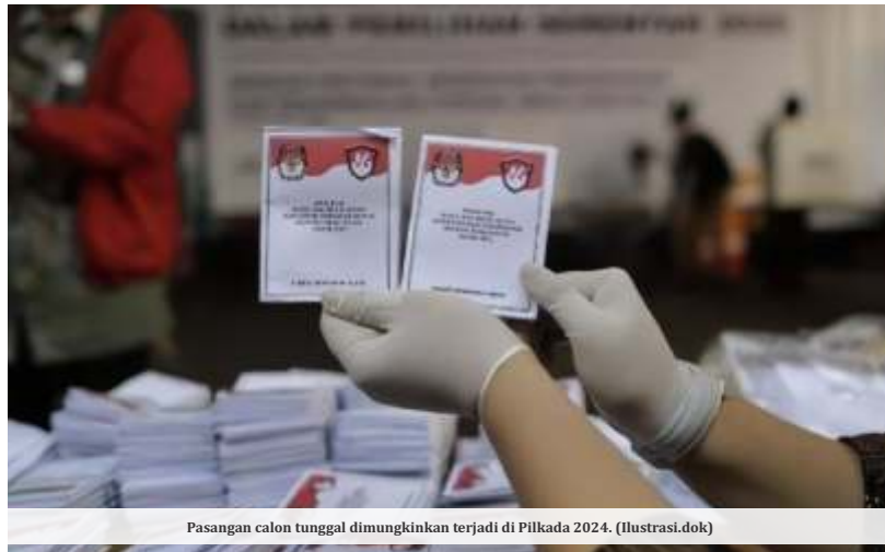
Pasangan calon tunggal dimungkinkan terjadi di Pilkada 2024. (Ilustrasi.dok)

Putusan itu memperbolehkan calon tunggal berkontestasi di pilkada. Putusan itu diikuti Peraturan MK