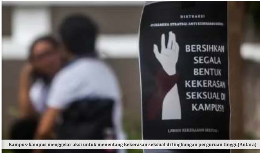
Kampus-kampus menggelar aksi untuk menentang kekerasan seksual di lingkungan perguruan tinggi.

Bahwa upaya kesehatan reproduksi dilaksanakan dengan menghormati nilai luhur yang tidak merendahkan martabat manusia sesuai dengan norma agama.