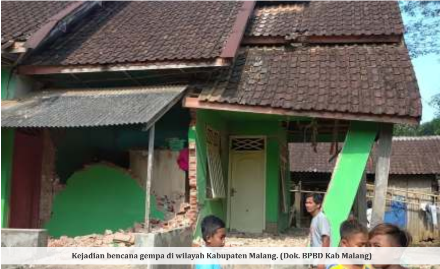
Kejadian bencana gempa di wilayah Kabupaten Malang.

MALANG - Badan Penanggulangan Bencana Daerah (BPBD) Kabupaten Malang mengungkapkan, wilayah Malang Selatan berada di zona rawan gempa bumi. Kewaspadaan dan kesiapsiagaan masyarakat terhadap potensi bencana alam yang dapat terjadi sewaktu-waktu terus digaungkan.