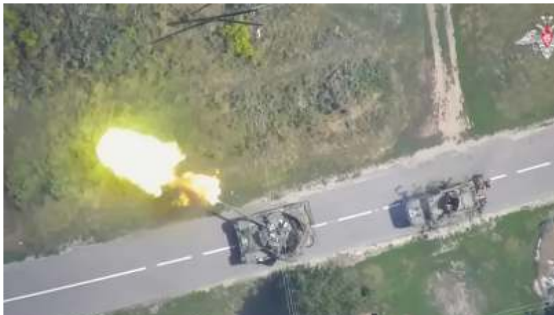
Gambar dari udara menunjukkan tank Ukraina melepas tembakan di wilayah Kursk, Rusia

"Sekarang jelas mengapa rezim Kyiv menolak usulan kami untuk kembali ke rencana penyelesaian damai."