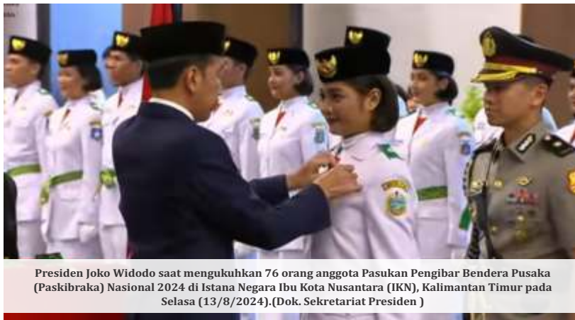
Presiden Joko Widodo saat mengukuhkan 76 orang anggota Pasukan Pengibar Bendera Pusaka (Paskibraka) Nasional 2024 di Istana Negara Ibu Kota Nusantara (IKN), Kalimantan Timur pada Selasa (13/8/2024).

penuh dendam," kata Cak Imin melalui akun Twitter @cakiminow, Rabu (14/8/2024).