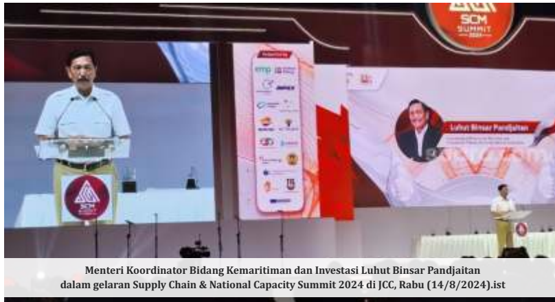
Menteri Koordinator Bidang Kemaritiman dan Investasi Luhut Binsar Pandjaitan dalam gelaran Supply Chain & National Capacity Summit 2024 di JCC, Rabu (14/8/2024).

"Investasi sampai dengan semester 1-2024 adalah US$ 5,6