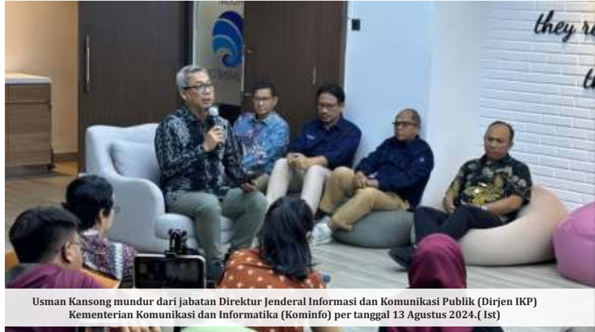
Usman Kansong mundur dari jabatan Direktur Jenderal Informasi dan Komunikasi Publik (Dirjen IKP) Kementerian Komunikasi dan Informatika (Kominfo) per tanggal 13 Agustus 2024. (Ist)

intervensi pihak eksternal yang mendorong pengunduran dirinya dari Dirjen Informasi dan Komunikasi Publik (IKP) Kementerian Komunikasi dan Informatika (Kominfo).