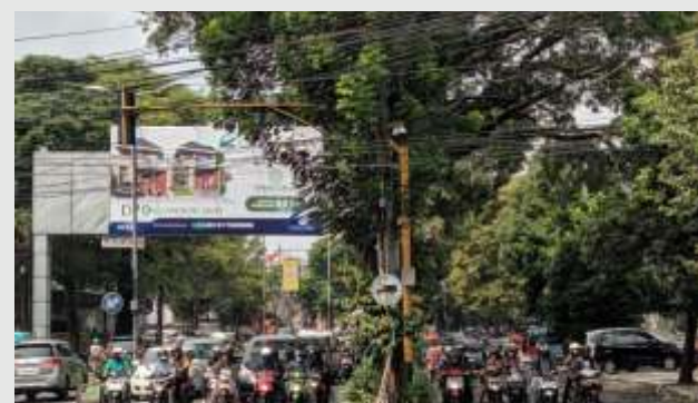
Lampu lalu lintas di Jl Letjend Sutuyo, Kota Malang.

seperti sekitar Dieng Plaza, Sumbasari, dan Kasin juga menjadi perhatian khusus karena tingginya volume lalu lintas di sana," sambungnya. (Santi/Dya)