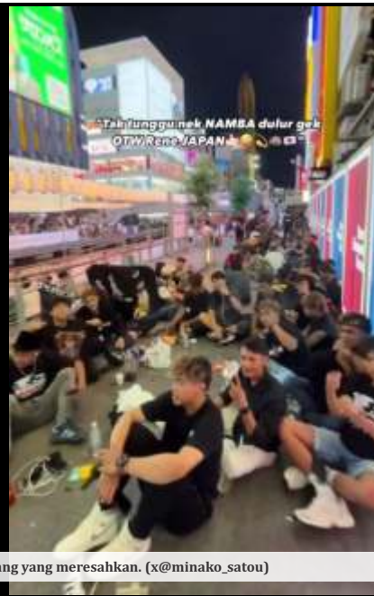
Tangkapan layar aksi oknum WNI di Jepang yang meresahkan.

OSAKA - Viral di media sosial adanya 'geng TKI' yang dibuat pekerja migran Indonesia di Jepang. Ulah geng tersebut menjadi sorotan publik Tanah Air maupun Jepang. Kementerian Luar Negeri (Kemlu RI) mengaku telah menindaklanjuti informasinya ini.