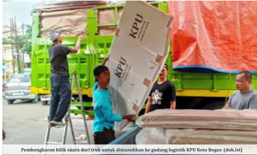
Pembongkaran bilik suara dari truk untuk dimasukkan ke gudang logistik KPU Kota Bogor. (dok.ist)

"Saya mengapresiasi adanya putusan MK Nomor 69 Tahun 2024