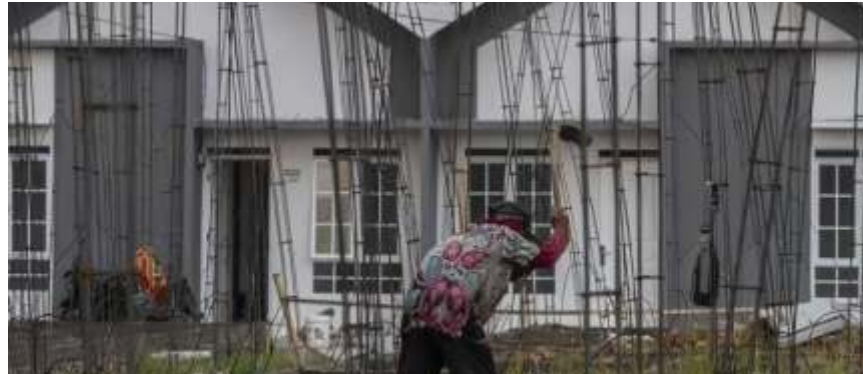
Pekerja menyelesaikan pembangunan rumah subsidi di salah satu perumahan di Kota Serang, Banten, Sabtu (14/9/2024).

Di sisi lain, menurut Raden, PPN KMS salah satu pengenaan PPN yang