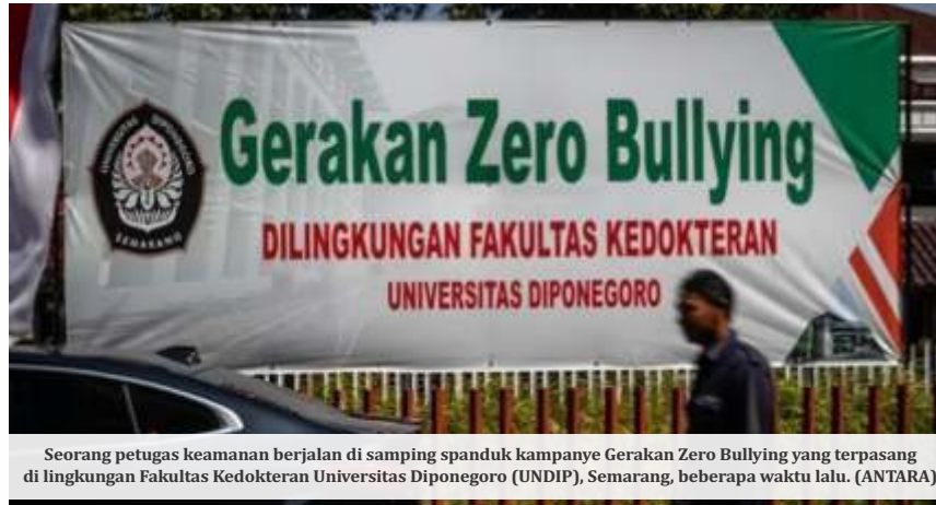
Seorang petugas keamanan berjalan di samping spanduk kampanye Gerakan Zero Bullying yang terpasang di lingkungan Fakultas Kedokteran Universitas Diponegoro (UNDIP), Semarang, beberapa waktu lalu.

"Kami mendorong ada langkah terobosan agar penanggulangan praktik perundungan dilakukan secara komprehensif. Tidak lagi menjadi tanggung jawab satu kementerian atau lembaga saja. Harus dibentuk satgas lintas kementerian/