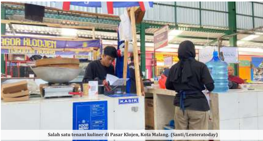
Salah satu tenant kuliner di Pasar Klojen, Kota Malang.

MALANG - Pasar tradisional di Kota Malang kini mulai menarik minat generasi muda. Jika sebelumnya identik dengan ibu-ibu rumah tangga, desain modern dan kuliner kekinian diyakini relevan bagi kaum milenial dan Generasi Z (Gen-Z).