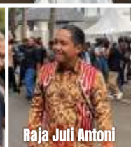
Raja Juli Antoni