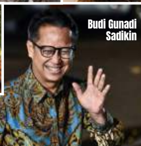
Budi Gunadi Sadikin