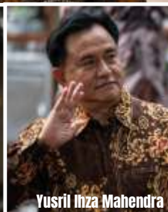
Yusril Ihza Mahendra