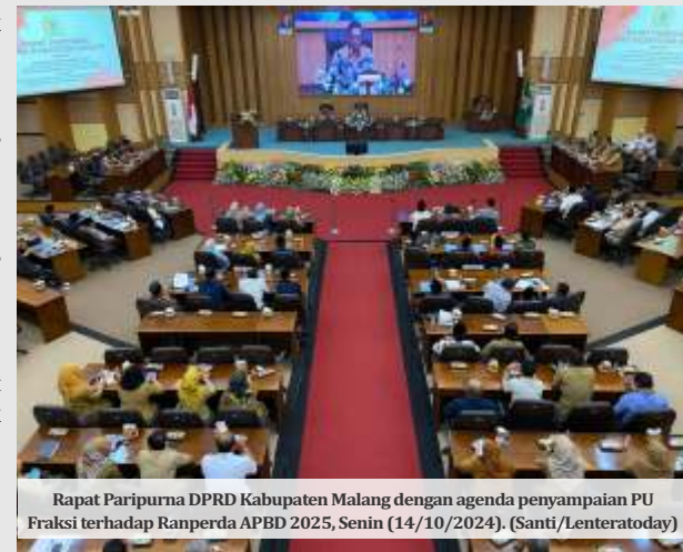
Rapat Paripurna DPRD Kabupaten Malang dengan agenda penyampaian PU Fraksi terhadap Ranperda APBD 2025, Senin (14/10/2024). (Santi/Lenteratoday)

Didik juga memfokuskan pentingnya pengelolaan belanja daerah yang efisien serta penetapan PAD yang rasional untuk mendukung