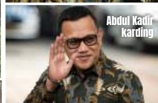
Abdul Kadir Karding