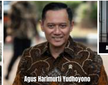
Agus Harimurti Yudhoyono