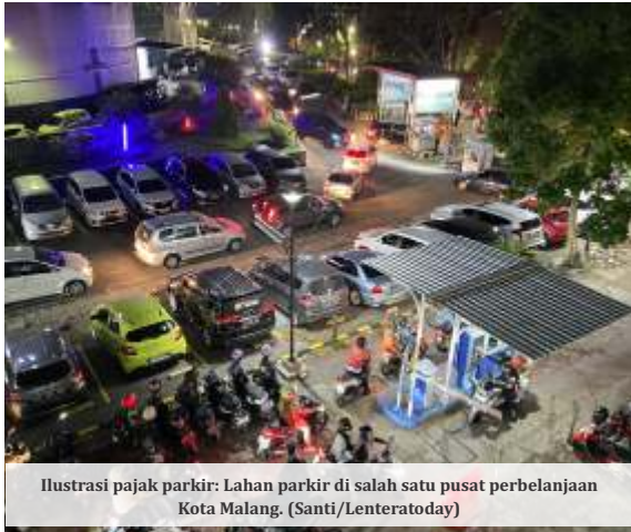
Ilustrasi pajak parkir: Lahan parkir di salah satu pusat perbelanjaan Kota Malang.