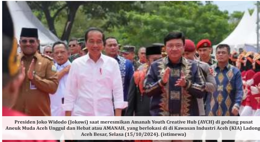
Presiden Joko Widodo (Jokowi) saat meresmikan Amanah Youth Creative Hub (AYCH) di gedung pusat Aneuk Muda Aceh Unggul dan Hebat atau AMANAH, yang berlokasi di di Kawasan Industri Aceh (KIA) Ladang, Aceh Besar, Selasa (15/10/2024).