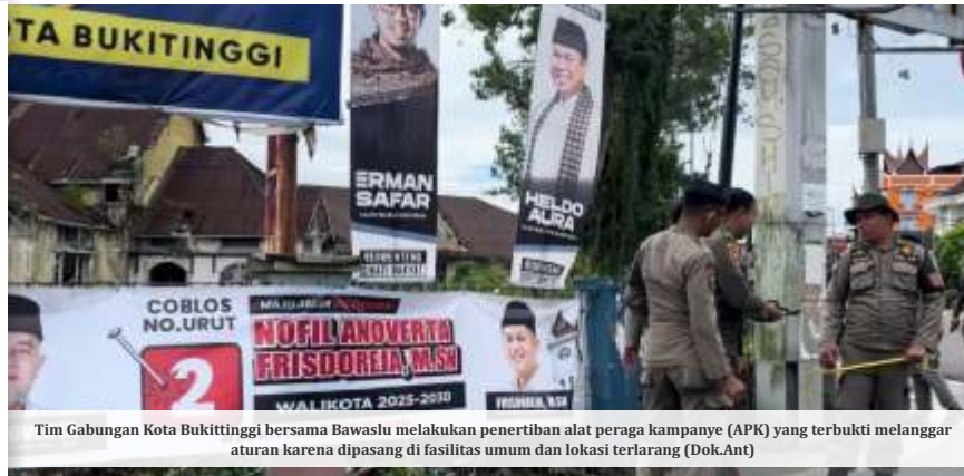
Tim Gabungan Kota Bukittinggi bersama Bawaslu melakukan penertiban alat peraga kampanye (APK) yang terbukti melanggar aturan karena dipasang di fasilitas umum dan lokasi terlarang

Dia memaparkan, perubahan terpenting yang termuat dalam Perbawaslu 9/2024 adalah terkait dengan masa penanganan laporan pelanggaran.