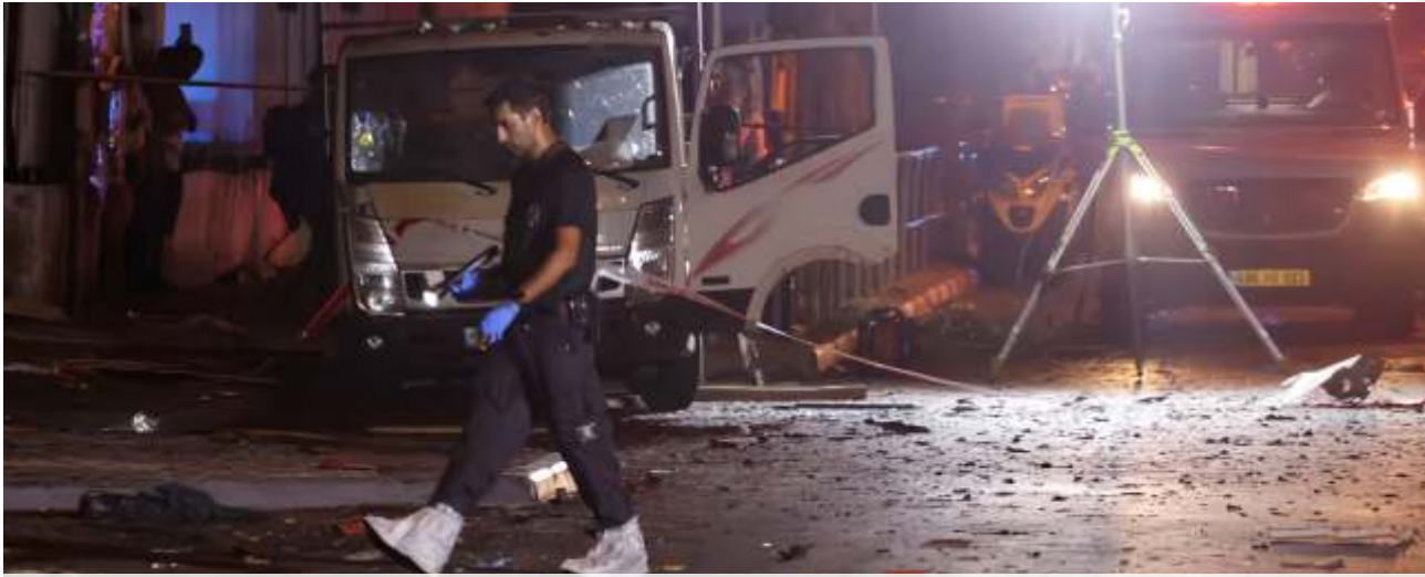
Satu orang tewas setelah bom meledak di Tel Aviv.

TEL AVIV - Perdana Menteri (PM) Israel Benjamin Netanyahu dievakuasi ke tempat aman saat sirene peringatan serangan udara meraung-raung ketika dia mengunjungi sebuah rumah sakit di wilayah utara negara tersebut. Insiden ini terjadi saat Netanyahu menjenguk tentara Israel yang luka-luka akibat serangan drone Hizbullah.