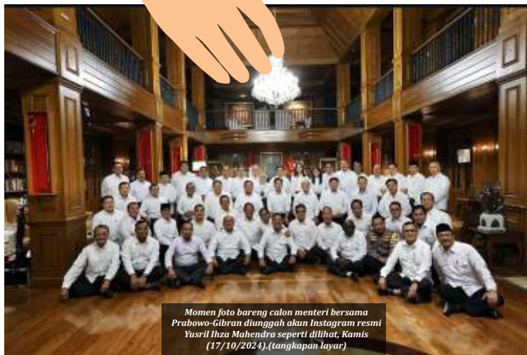
Momen foto barang calon menteri bersama Prabowo-Gibran diunggah akan Instagram resmi Yusril Ihsa Mahendra seperti dilihat, Kamis (17/10/2024). (tangkap layar)