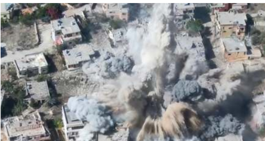
Tampak dari udara lokasi penyimpanan senjata bawah tanah di wilayah Yaman yang dikuasai Houthi dibom oleh pesawat pembom B-2 AS.

Ia lantas menekankan bahwa kekerasan terhadap warga sipil dan serangan membabi buta terhadap objek sipil tak bisa dibenarkan. (rtr, ajz, Anadolu, Tgu/dya)