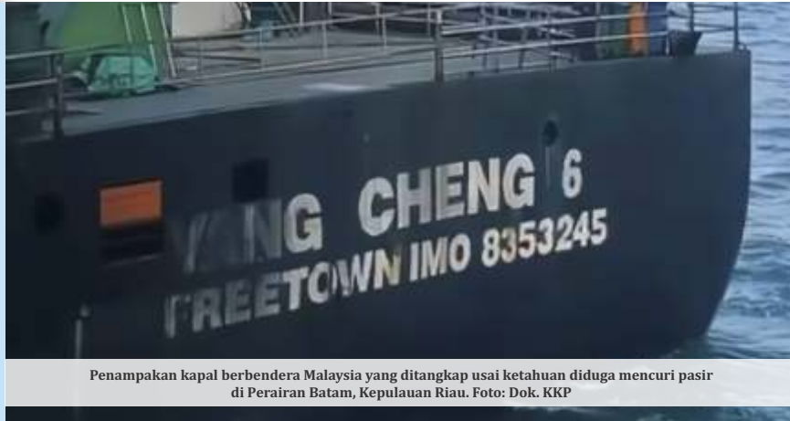
Penampakan kapal berbendera Malaysia yang ditangkap usai ketahuan diduga mencuri pasir di Perairan Batam, Kepulauan Riau.

Sumber: regulasi pemerintah, Kepmen KKP No. 6 Tahun 2024,