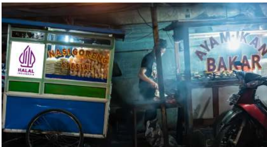
Pengusaha skala mikro dan kecil diberikan perpanjangan waktu hingga 2026 untuk memiliki sertifikasi halal. (Dok)

"Kalau belum (bersertifikat halal), kita ingin tahu kenapa belum," lanjut Aqil.