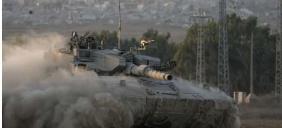
Dengan latar bangunan yang hancur di Jalur Gaza, seorang tentara Israel melambai dari sebuah tank, dekat perbatasan Israel-Gaza di Israel selatan, Kamis, 1 Agustus 2024.

Saluran berita satelit al-Masirah milik Houthi melaporkan serangan udara di sekitar Sana'a, dan di sekitar benteng Houthi di Saada. Mereka tidak