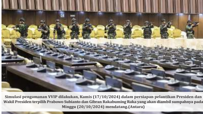
Simulasi pengamanan VVIP dilakukan, Kamis (17/10/2024) dalam persiapan pelantikan Presiden dan Wakil Presiden terpilih Prabowo Subianto dan Gibran Rakabuming Raka yang akan diambil sumpahnya pada Minggu (20/10/2024) mendatang.

"Setelah kemudian kami umumkan tentu saja kami akan mengumumkan