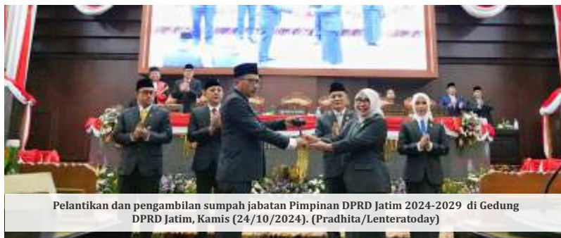
Pelantikan dan pengambilan sumpah jabatan Pimpinan DPRD Jatim 2024-2029 di Gedung DPRD Jatim, Kamis (24/10/2024).

dilakukan adalah melengkapi alat kelengkapan dewan, termasuk menetapkan ketua, wakil ketua, dan anggota di setiap komisi. Setelah itu, Banggar akan mulai mengelola pembahasan Anggaran Pendapatan dan Belanja Daerah (APBD), hari ini semua diselesaikan," jelasnya.