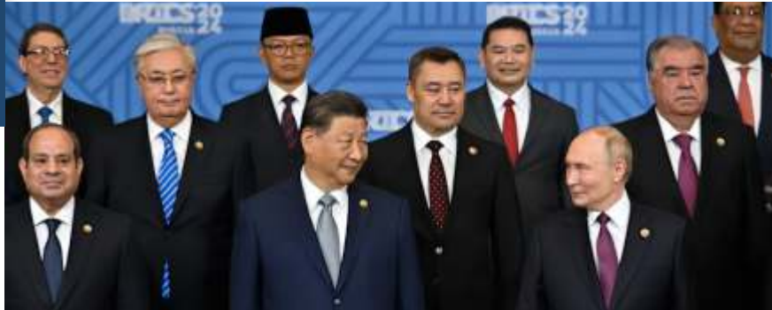
Presiden Rusia Vladimir Putin (kanan), Presiden China Xi Jinping dan semua peserta KTT BRICS Plus foto bersama di Kazan, Rusia, Kamis (24/10/2024).

Karena negara-negara BRICS telah mengadopsi kebijakan netralitas terkait konflik Rusia-Ukraina, deklarasi tersebut tidak mengikat kelompok tersebut untuk mendukung kedua belah pihak.