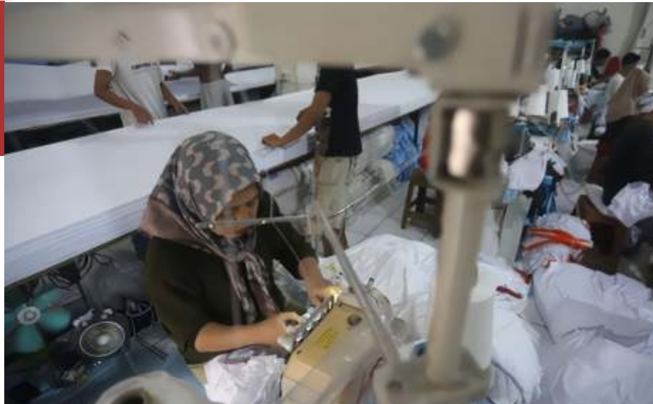
Sejumlah pekerja menyelesaikan kaos pesanan di konveksi Sinergi Adv, kawasan Serengeng Sawah, Jakarta, Rabu (23/10/2024).

Bisnis ritel dengan format hypermarket ini sebenarnya sudah mulai melemah sejak 2015. Pada saat itu, perusahaan memutuskan untuk menutup 75 gerai Giant di sejumlah daerah karena faktor rendahnya penjualan.