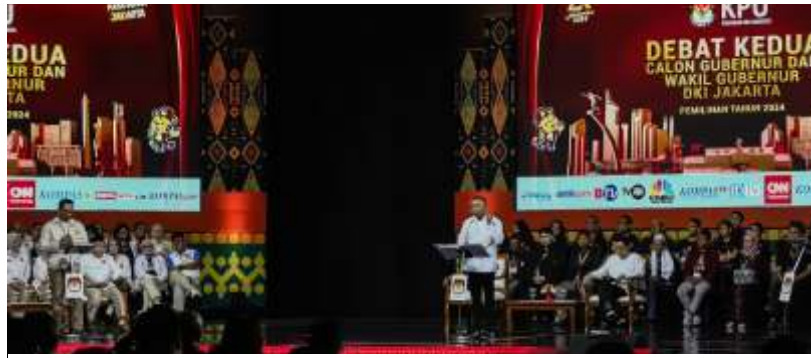
Debat kedua pemilihan kepala daerah (pilkada) Jakarta 2024 digelar pada Minggu (27/10/2024), di Ecovention, Ancol, Jakarta Utara.

Kartu unggulan juga diungkapkan oleh Cawagub nomor urut 1 Suswono. Pasangan Ridwan Kamil itu