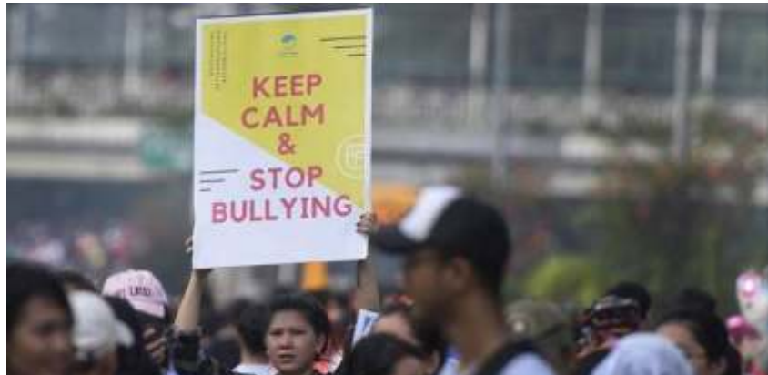
(Ilustrasi) Seorang warga dari Komunitas Sudah Dong membentangkan poster berisikan ajakan tidak melakukan "bullying" saat hari bebas kendaraan bermotor di kawasan Bundaran HI, Jakarta.

Nantinya, grup yang perlu didaftarkan merupakan grup yang berfungsi untuk komunikasi kegiatan