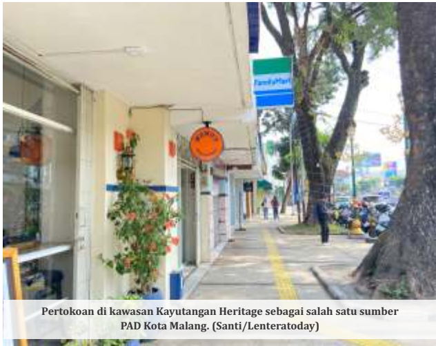
Pertokoan di kawasan Kayutangan Heritage sebagai salah satu sumber PAD Kota Malang.

MALANG - Pemerintah Kota (Pemkot) Malang mengakui realisasi Pendapatan Asli Daerah (PAD) hingga akhir tahun 2024 diperkirakan sulit mencapai target 100 persen. Meski begitu, Badan Pendapatan Daerah (Bapenda) optimistis mampu menutup tahun dengan realisasi di atas 80 persen.