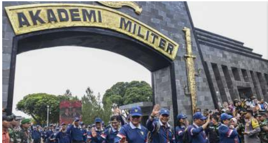
Sejumlah Menteri berbaris meninggalkan Akademi Militer usai mengikuti kegiatan pembekalan, rapat kerja dan retreat Kabinet Merah Putih 2024-2029 di Akademi Militer Magelang, Jawa Tengah, Minggu (27/10/2024).

Dalam kesempatan tersebut, Prasetyo mengaku belum mendapatkan informasi kapan Pak Bas dilantik sebagai Kepala Otorita IKN dan siapa yang akan mendampingi mengisi di posisi tersebut. "Belum-belum," katanya.