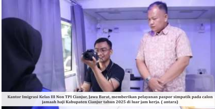
Kantor Imigrasi Kelas III Non TPI Cianjur, Jawa Barat, memberikan pelayanan paspor simpatik pada calon jemaah haji Kabupaten Cianjur tahun 2025 di luar jam kerja.

Kemudian, dia menilai revisi juga perlu untuk pengaturan haji khusus dan umrah. Dia menuturkan, regulasi harus memberikan kejelasan lebih lanjut mengenai pengelolaan haji reguler dan haji khusus atau haji plus. "Terutama terkait transparansi biaya