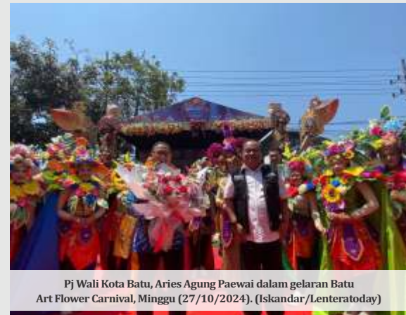
Pj Wali Kota Batu, Aries Agung Paewai dalam gelaran Batu Art Flower Carnival, Minggu (27/10/2024).

karnavalnya semakin seru dengan tema lebih beragam," ungkap Indri.