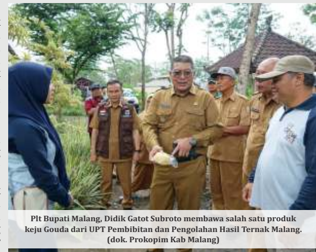
Plt Bupati Malang, Didik Gatot Subroto membawa salah satu produk keju Gouda dari UPT Pembibitan dan Pengolahan Hasil Ternak Malang.

Menurutnya, masih ada beberapa wilayah yang belum optimal dalam mengelola limbah kotoran sapi, yang dapat berdampak pada kesehatan masyarakat sekitar. Didik pun meminta agar edukasi tentang pengelolaan limbah yang ramah lingkungan menjadi salah satu fokus