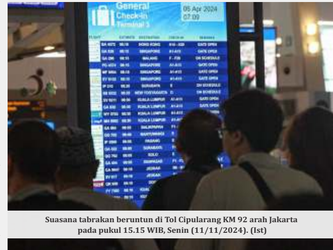
Suasana tabrakan beruntun di Tol Cipularang KM 92 arah Jakarta pada pukul 15.15 WIB, Senin (11/11/2024).

Hal ini untuk mengatasi monopoli oleh Pertamina telah disetujui dan diharapkan mampu menekan harga, mengingat harga bahan bakar pesawat di Indonesia 43% lebih tinggi