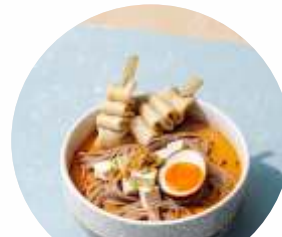
Feel Good Food