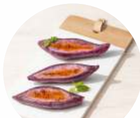
Modernized Comfort Food