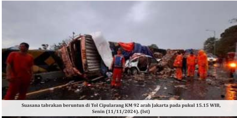
Suasana tabrakan beruntun di Tol Cipularang KM 92 arah Jakarta pada pukul 15.15 WIB, Senin (11/11/2024).