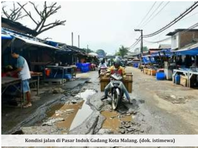
Kondisi jalan di Pasar Induk Gadang Kota Malang.

MALANG - Dinas Pekerjaan Umum, Penataan Ruang, Perumahan, dan Kawasan Permukiman (PUPR-PKP) Kota Malang mendapatkan tambahan anggaran sebesar Rp 34 miliar pada hasil pembahasan Kebijakan Umum Anggaran Prioritas Plafon Anggaran Sementara (KUA-PPAS) APBD 2025.