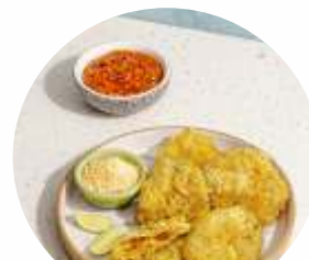
The New Sharing