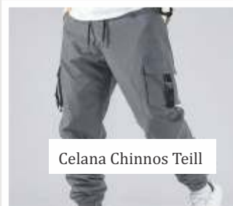
Celana Chinnos Teill