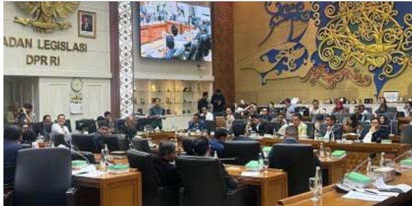
Baleg DPR menggelar rapat pleno dengan pimpinan Komisi I hingga XIII membahas penyusunan Prolegnas dan RUU Prioritas, Selasa (12/11/2024). (ist)

"Ya, memang harus diselesaikan sebelum pencoblosan. Kami khawatir kalau sesudah pencoblosan nanti kan banyak gugatan-gugatan lagi terhadap undang-undang tersebut. Kami