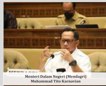
Menteri Dalam Negeri (Mendagri) Muhammad Tito Karnavian

"Kalau dia nggak cuti, kena semprit Bawaslu Pak. Bahkan nanti bisa berpengaruh di MK. Ya dicatet