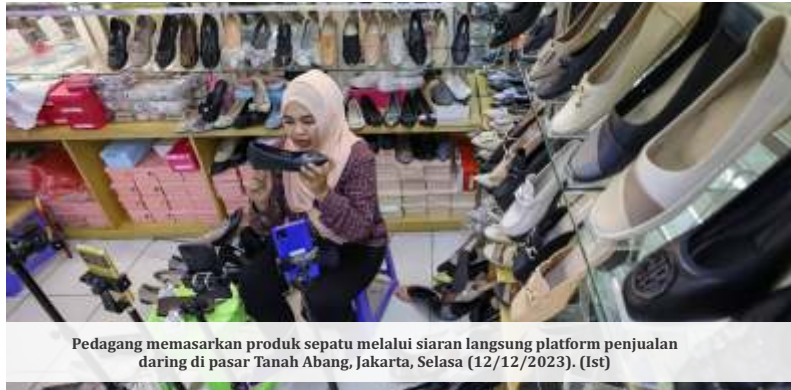
Pedagang memasarkan produk sepatu melalui siaran langsung platform penjualan daring di pasar Tanah Abang, Jakarta, Selasa (12/12/2023). (Ist)

menjadi indikator penilaian kredit berasal dari catatan pembayaran utilitas seperti tagihan listrik, telepon, apartemen, dan lain-lain. Kemudian juga, kegiatan calon debitur itu di sosial media.