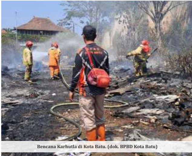
Bencana Karhutla di Kota Batu.

BATU - Pemerintah Kota (Pemkot) Batu telah menetapkan status siaga bencana yang berlaku sejak 1 November 2024 hingga 30 April 2025. Ada 6 potensi bencana yang kerap terjadi, yakni tanah longsor, banjir bandang, gempa bumi, letusan gunung berapi, cuaca ekstrem, dan kebakaran hutan.