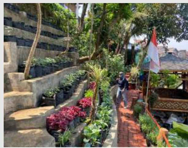
Salah satu urban farming di kelurahan Rampil Celaket, Kecamatan Klojen Kota Malang.

pasar-pasar ini berperan penting dalam menjamin kelancaran distribusi bahan pangan, baik yang berasal dari dalam maupun luar Kota Malang. "Kita didukung dengan adanya 26 pasar sehingga arus ketersediaan pangan itu lumayan besar di Kota Malang," tukasnya. (Santi/Dya)