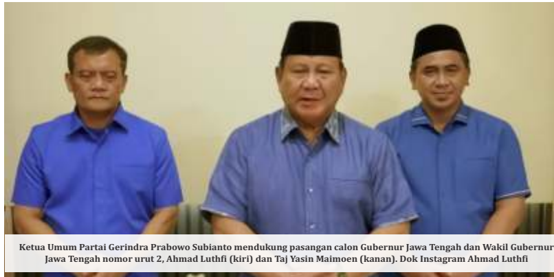
Ketua Umum Partai Gerindra Prabowo Subianto mendukung pasangan calon Gubernur Jawa Tengah dan Wakil Gubernur Jawa Tengah nomor urut 2, Ahmad Luthfi (kiri) dan Taj Yasin Maimoen (kanan).

"Saya mohon dengan sangat, berilah suaramu kepada Jenderal Ahmad Luthfi dan Gus Taj Yasin