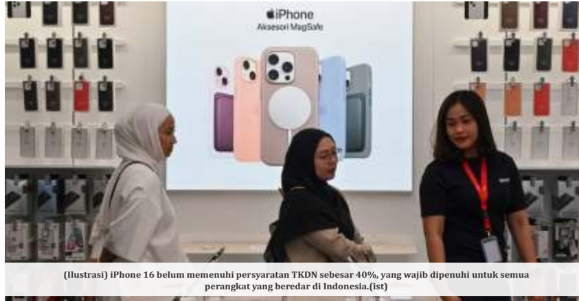
(Ilustrasi) iPhone 16 belum memenuhi persyaratan TKDN sebesar 40%, yang wajib dipenuhi untuk semua perangkat yang beredar di Indonesia. (ist)

Ia juga berharap pemerintah mengkaji ulang insentif dan kebijakan investasi asing, agar perusahaan yang mendapatkan keuntungan besar di tanah air memberikan kontribusi