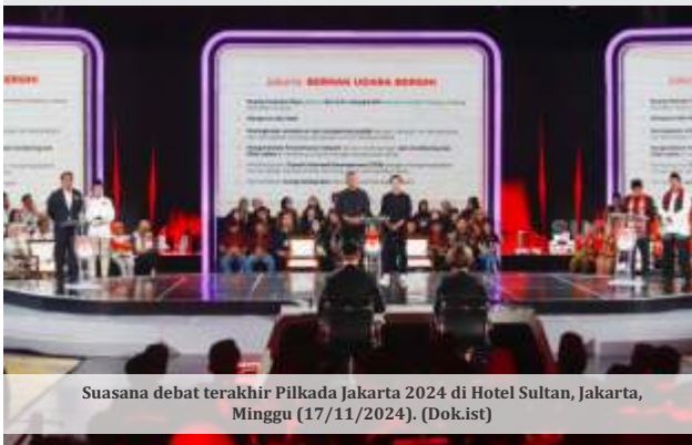
Suasana debat terakhir Pilkada Jakarta 2024 di Hotel Sultan, Jakarta, Minggu (17/11/2024).

JAKARTA -Ketiga cawagub Jakarta kompak berjanji tak melakukan pengusuran bila terpilih nanti. Hal itu disampaikan saat ditanya soal strategi dan langkah mengatasi konflik agraria.