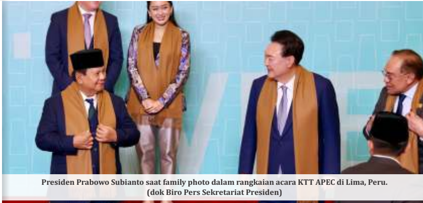
Presiden Prabowo Subianto saat family photo dalam rangkaian acara KTT APEC di Lima, Peru.

kesempatan yang baik APEC ya, kita meneruskan suatu jaringan, network antara pemimpin-pemimpin di Pasifik," ujar Prabowo.