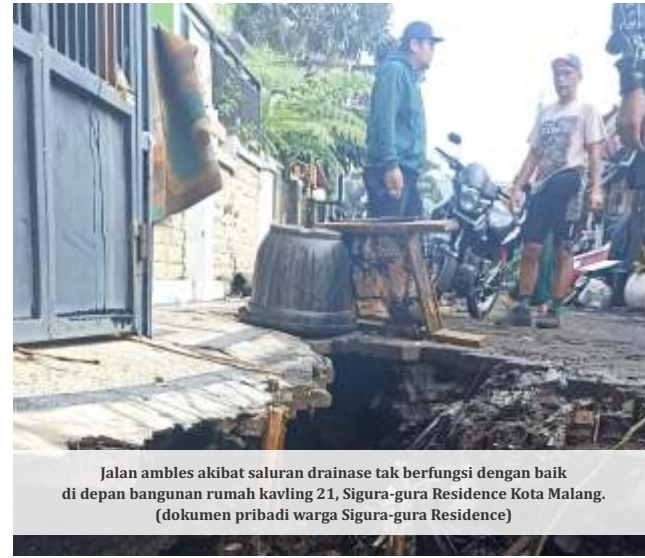
Jalan ambles akibat saluran drainase tak berfungsi dengan baik di depan bangunan rumah kavling 21, Sigura-gura Residence Kota Malang. (dokumen pribadi warga Sigura-gura Residence)

terhambat dan menyebabkan banjir di kompleks perumahan. Warga setempat juga berharap agar permasalahan ini segera diatasi, agar tidak terjadi lagi banjir yang merugikan mereka. (Santi/Dya)