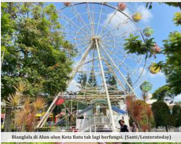
Bianglala di Alun-alun Kota Batu tak lagi berfungsi.

MALANG - Bianglala ikonik yang telah menjadi simbol Alun-Alun Kota Batu akan segera diganti dengan model baru pada tahun 2025 mendatang. Pemerintah Kota (Pemkot) telah menyiapkan anggaran sebesar Rp 7 miliar untuk proyek ini, yang rencananya akan dimasukkan dalam Rancangan APBD (RAPBD) 2025.