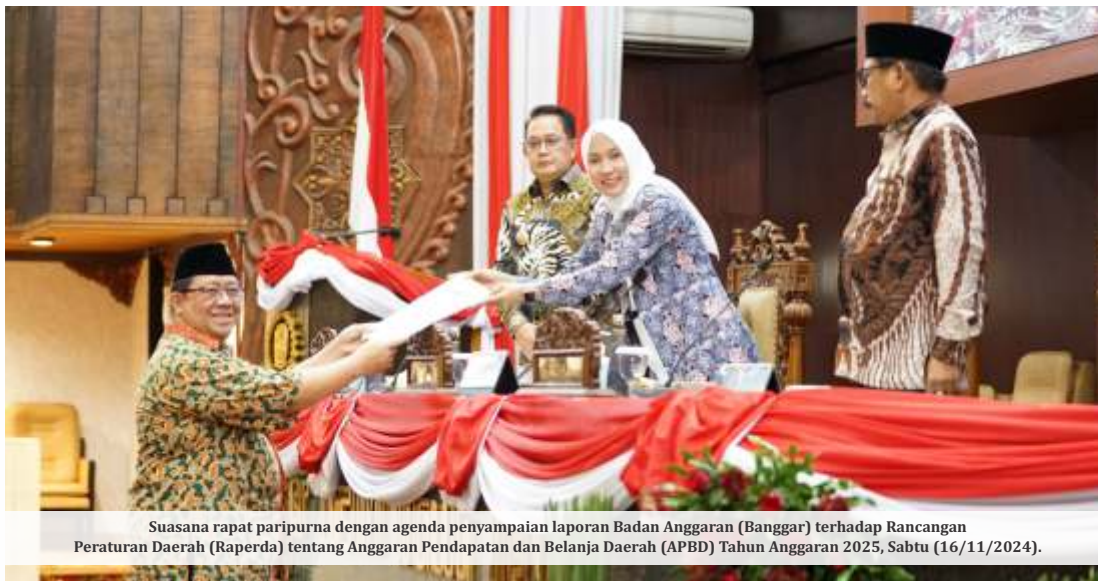
Suasana rapat paripurna dengan agenda penyampaian laporan Badan Anggaran (Banggar) terhadap Rancangan Peraturan Daerah (Raperda) tentang Anggaran Pendapatan dan Belanja Daerah (APBD) Tahun Anggaran 2025, Sabtu (16/11/2024).

Ia menjelaskan kenaikan tersebut dirancang untuk mendukung pencapaian prioritas pembangunan sesuai dengan Rencana Kerja Pemerintah Daerah (RKPD) 2025 dan Kebijakan Umum Anggaran serta Prioritas Plafon Anggaran Sementara (KUA-PPAS) 2025.