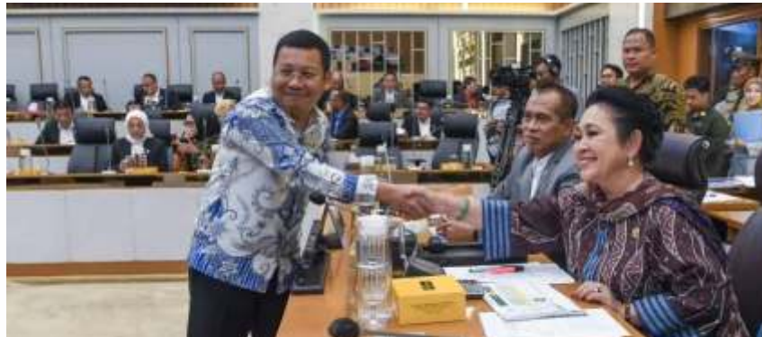
Kepala Badan Pangan Nasional (Bapanas) Arief Prasetyo Adi (kiri) berjabat tangan dengan Ketua Komisi IV DPR Siti Hediati Hariyadi (kanan) sebelum mengikuti rapat kerja dengan Komisi IV DPR di Kompleks Parlemen, Senayan, Jakarta, Selasa (19/11/2024). (ant)

Bantuan beras, Arief menjelaskan, tujuannya untuk sekaligus stabilisasi pasokan dan harga beras di masyarakat. Program itu yang diklaim