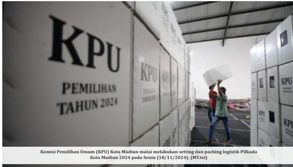
Komisi Pemilihan Umum (KPU) Kota Madiun mulai melakukan setting dan packing logistik Pilkada Kota Madiun 2024 pada Senin (18/11/2024).

Rahmat Bagja juga mengungkap beberapa daerah rawan konflik yang bisa menyebabkan korban jiwa akibat