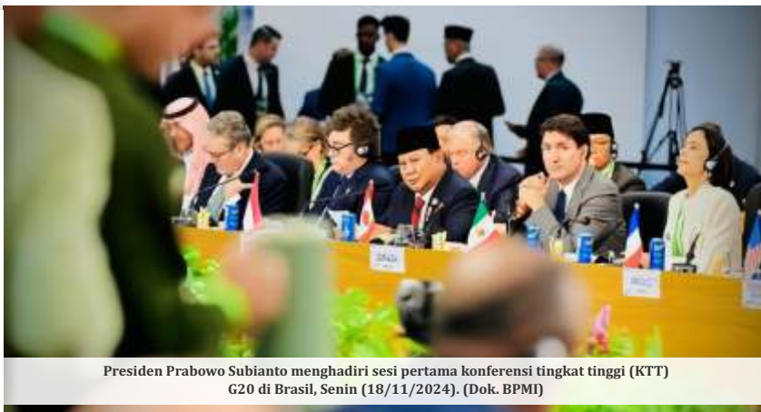
Presiden Prabowo Subianto menghadiri sesi pertama konferensi tingkat tinggi (KTT) G20 di Brasil, Senin (18/11/2024).