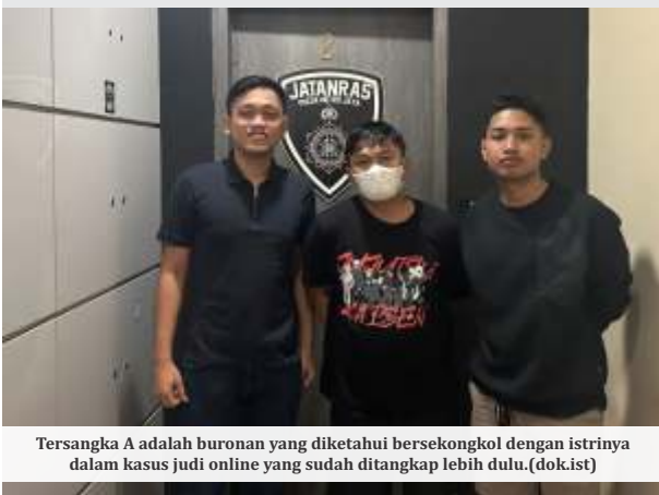
Tersangka A adalah buronan yang diketahui bersekongkol dengan istrinya dalam kasus judi online yang sudah ditangkap lebih dulu.

JAKARTA- Polisi mengungkapkan peran tiga tersangka AK, AJ, dan A alias M dalam kasus dugaan penyalahgunaan wewenang pemblokiran situs judi online yang melibatkan pegawai Kementerian Komunikasi dan Digital (Komdigi).