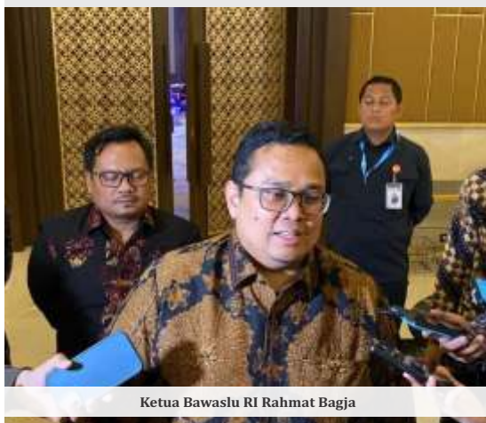
Ketua Bawaslu RI Rahmat Bagja

JAKARTA - Ketua Bawaslu RI Rahmat Bagja mengungkapkan pihaknya telah menemukan titik temu dari penelusuran video singkat yang menampilkan Presiden Prabowo Subianto mengajak warga Jawa Tengah untuk mendukung pasangan calon nomor urut 2 Ahmad Luthfi-Taj Yasin pada Pemilihan Gubernur (Pilgub) 2024.