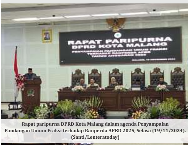
Rapat paripurna DPRD Kota Malang dalam agenda Penyampaian Pandangan Umum Fraksi terhadap Ranperda APBD 2025, Selasa (19/11/2024).

MALANG - Persiapan Kota Malang sebagai salah satu tuan rumah Pekan Olahraga Provinsi (Porprov) Jawa Timur 2025 mendapat sorotan dari DPRD Kota Malang. Fraksi Gerindra mengingatkan pentingnya pengelolaan anggaran yang profesional dan proporsional agar penyelenggaraan Porprov berjalan sukses tanpa menimbulkan permasalahan baru.