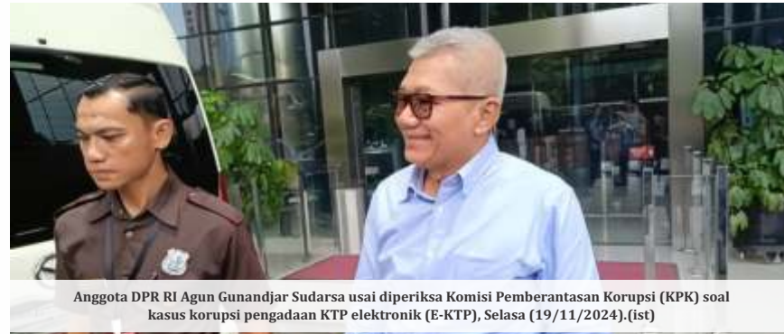
Anggota DPR RI Agun Gunandjar Sudarsa usai diperiksa Komisi Pemberantasan Korupsi (KPK) soal kasus korupsi pengadaan KTP elektronik (E-KTP), Selasa (19/11/2024).

Agun enggan mengungkapkan identitas dua tersangka tersebut. Ia mengatakan, KPK yang memiliki kewenangan untuk mengumumkan