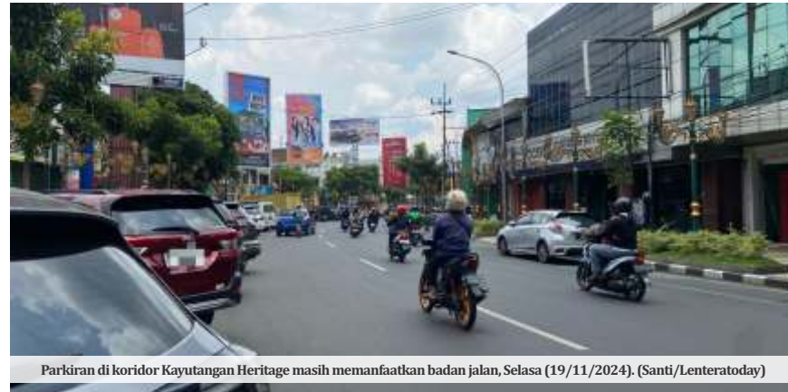
Parkiran di koridor Kayutangan Heritage masih memanfaatkan badan jalan, Selasa (19/11/2024).

Dalam kesempatannya ini, Jaya juga menyampaikan fasilitas parkir baru akan dirancang dengan tetap menjaga nilai sejarah bangunan eks