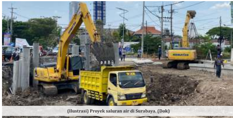
(Ilustrasi) Proyek saluran air di Surabaya. (Dok)

Ditegaskan, yang bisa dilakukan adalah memastikan proyek penanganan banjir dengan pembuatan saluran air, box culvert, gorong-