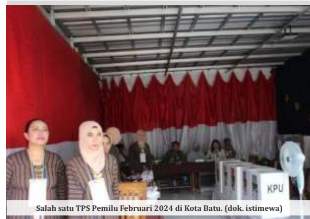
Salah satu TPS Pemilu Februari 2024 di Kota Batu. (dok. istimewa)

Tidak hanya itu, sambung Yogi, aspek logistik juga menjadi perhatian serius dalam pemetaan ini. Bawaslu