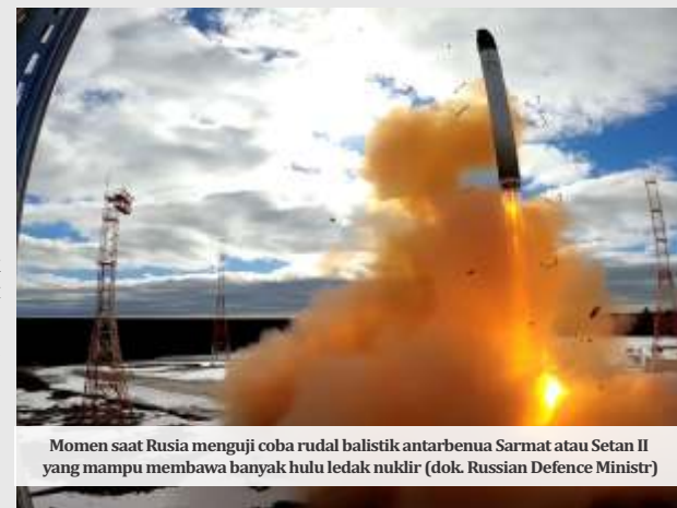
Momen saat Rusia menguji coba rudal balistik antarbenua Sarmat atau Setan II yang mampu membawa banyak hulu ledak nuklir

Sejumlah media Inggris melaporkan Ukraina berani menggunakan rudal Inggris dalam perangnya melawan Rusia itu setelah mendapat lampu hijau dari London.