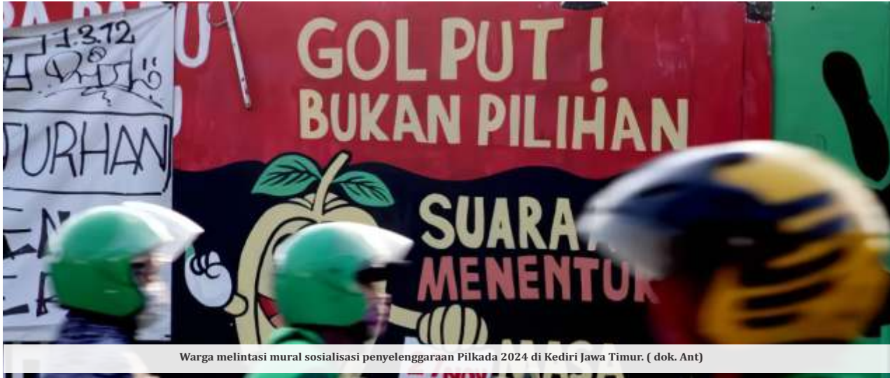
Warga melintasi mural sosialisasi penyelenggaraan Pilkada 2024 di Kediri Jawa Timur.

JAKARTA -Menteri Agama (Menag) Nasaruddin Umar mengungkap angka perceraian akibat perbedaan pilihan politik besar. Dikatakan dalam satu provinsi yang tidak disebut namanya, tercatat ada 500 perceraian suami istri karena alasan tersebut.