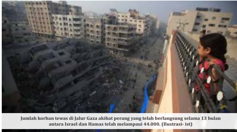
Jumlah korban tewas di Jalur Gaza akibat perang yang telah berlangsung selama 13 bulan antara Israel dan Hamas telah melampaui 44.000. (Ilustrasi- ist)

Pada saat itu, AS tidak menggunakan hak vetonya, yang menjadi terobosan baru dari dukungan tradisional Washington terhadap Israel dalam isu sensitif mengenai permukiman Yahudi di wilayah Palestina. Tapi itu 2016, sudah cukup lama.