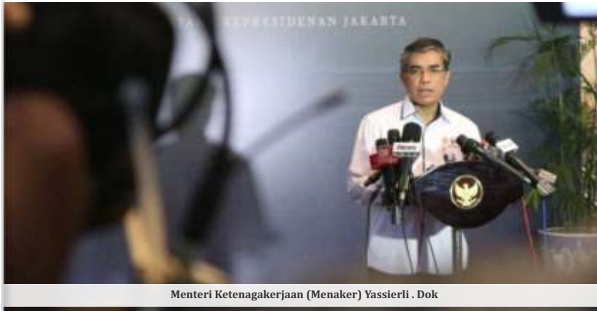
Menteri Ketenagakerjaan (Menaker) Yassierli.

penentuan UMP sejak Mahkamah Konstitusi (MK) mengabulkan permohonan peninjauan kembali Partai Buruh terkait dengan Undang-Undang (UU) Nomor 6 Tahun 2023 tentang Cipta Kerja.