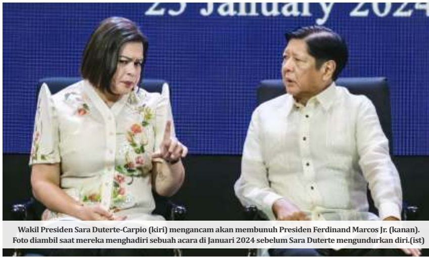
Wakil Presiden Sara Duterte-Carpio (kiri) mengancam akan membunuh Presiden Ferdinand Marcos Jr. (kanan). Foto diambil saat mereka menghadiri sebuah acara di Januari 2024 sebelum Sara Duterte mengundurkan diri.

Melansir CBC News, ancaman publik yang terang-terangan ia paparkan tersebut bukanlah sebuah lelucon. Hal itu disampaikan Sara Duterte menanggapi seorang warganet yang memintanya untuk tetap aman. Dikatakan bahwa Sara