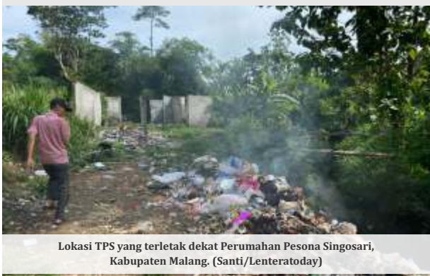
Lokasi TPS yang terletak dekat Perumahan Pesona Singosari, Kabupaten Malang.

MALANG - Warga Perumahan Singosari mendesak Pemerintah Kabupaten (Pemkab) Malang segera menyelesaikan masalah sampah di wilayah mereka. Tidak adanya tempat penampungan sampah (TPS) di RW 5, Dusun Sempol, Desa Ardimulyo, membuat warga terpaksa membakar sampah guna mengurangi volume limbah yang terus meningkat setiap harinya. .