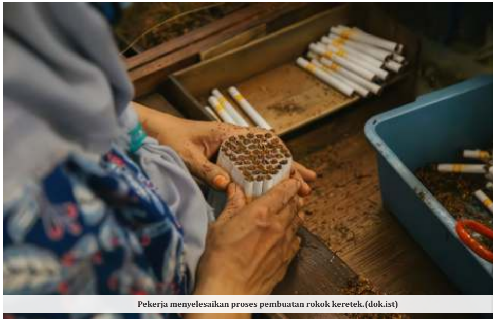
Pekerja menyelesaikan proses pembuatan rokok keretek.

"Downtrading kalau itu memang murni ekonomi tidak bisa kita lawan, tapi itu dengan kemudian melakukan yang tidak pas, salah personifikasi, salah peruntukan itu yang akan kami tindak," kata dia.