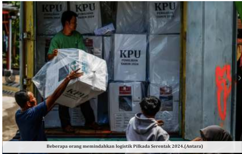
Beberapa orang memindahkan logistik Pilkada Serentak 2024.

"Tugas penyelenggara pemilu itu bukan hanya saat masuk tahapan pileg, pilpres, dan pilkada. Di tahun-tahun tidak menyelenggarakan pemilihan, KPU dan Bawaslu serta