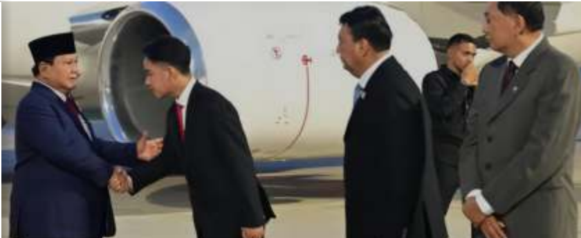
Presiden Indonesia Prabowo Subianto disambut oleh Wakil Presiden Gibran Rakabuming Raka bersama sejumlah menteri Kabinet Merah Putih saat kepulangannya dari lawatan ke 6 negara di Bandara Halim Perdanakusuma, Jakarta Timur, Minggu (24/11/2024).

Indonesia dan Uni Emirat Arab sepakat untuk memperkuat kerja sama di beberapa bidang, seperti energi dan pariwisata. Prabowo dalam pertemuan dengan Presiden UEA Mohammed bin Zayed Al Nahyan alias MBZ juga menyatakan ketertarikan Indonesia untuk belajar dari negara tersebut dalam memperbesar Sovereign Wealth Fund, Indonesia Investment Authority alias INA.