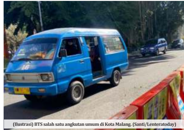
(Ilustrasi) BTS salah satu angkutan umum di Kota Malang.

Sawojajar hanya dilalui di Jalan Danau Toba. Sedangkan wilayah di dalamnya tidak terjangkau, sehingga masyarakat cenderung menggunakan kendaraan pribadi. Karena kan dari titik satu (di dalam kampung) mau ke jalan raya itu jauh, malas jalan kaki," katanya.