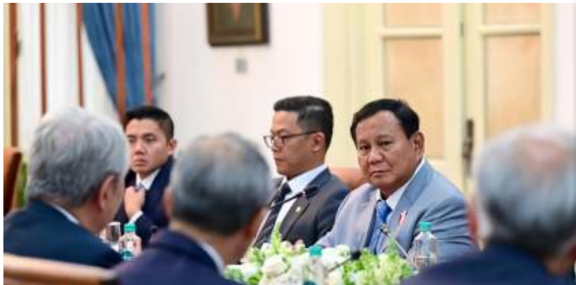
Presiden Prabowo Subianto menerima kunjungan delegasi Japan-Indonesia Association (JAPINDA) di Istana Merdeka, Jakarta, pada Kamis (5/12/2024). Ist

bunga SBN 10 tahun ditargetkan sebesar 7,0 persen. Berdasarkan Perkembangan Indikator Stabilitas Nilai Rupiah yang diumumkan Bank Indonesia 29 November 2024, imbal hasil SBN 10 tahun sebesar 6,88 persen.