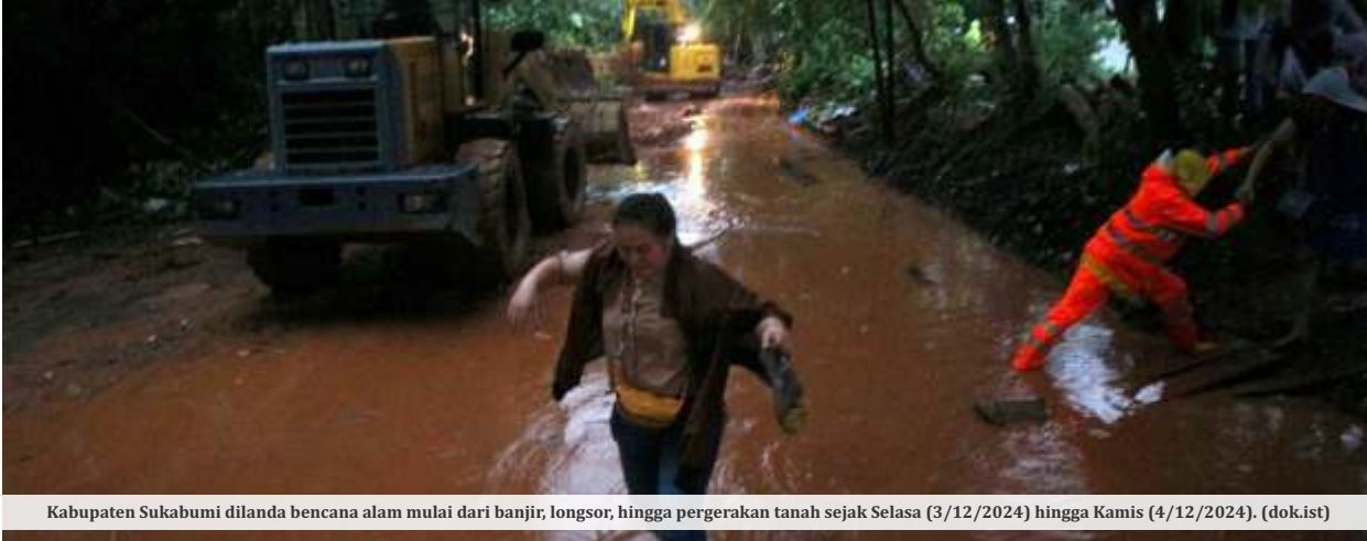
Kabupaten Sukabumi dilanda bencana alam mulai dari banjir, longsor, hingga pergerakan tanah sejak Selasa (3/12/2024) hingga Kamis (4/12/2024).

SUKABUMI -Pemerintah Kabupaten Sukabumi resmi menetapkan status tanggap darurat, dari masifnya kejadian bencana di berbagai wilayah. Penetapan status tanggap darurat itu dimulai sejak (4/12/2024) hingga sepekan ke depan.