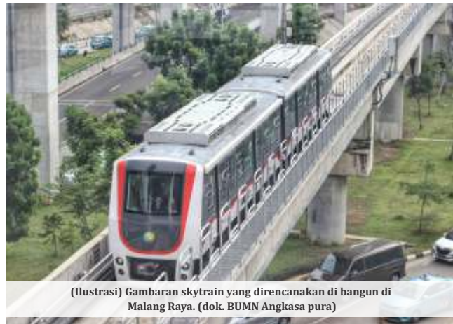
(Ilustrasi) Gambaran skytrain yang direncanakan di bangun di Malang Raya. (dok. BUMN Angkasa pura)

Sanusi menyebutkan bahwa infrastruktur transportasi ini akan menjadi solusi untuk kemacetan yang sering terjadi, terutama di wilayah perbatasan Kota Batu dan Kota Malang menuju Kabupaten Malang, khususnya pada akhir pekan.