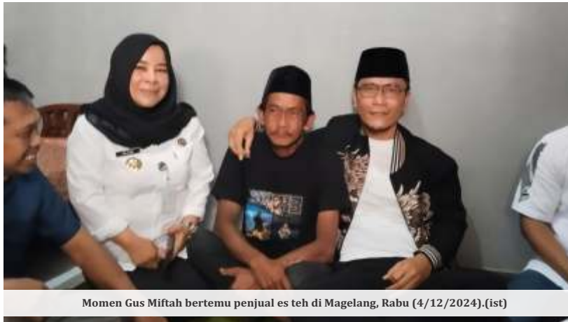
Momen Gus Miftah bertemu penjual es teh di Magelang, Rabu (4/12/2024). (ist)

Gus Miftah masih mendapatkan banyak kritikan meskipun sudah