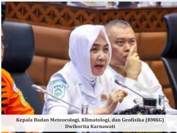
Kepala Badan Meteorologi, Klimatologi, dan Geofisika (BMKG) Dwikorita Karnawati

JAKARTA -Badan Meteorologi, Klimatologi, dan Geofisika (BMKG) memperkirakan terjadi badai dan potensi banjir besar pada masa libur natal dan tahun baru (Nataru). Hal ini disebabkan oleh pergerakan seruak udara dingin.