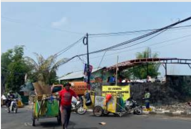
(Ilustrasi) Tampak penggerobak sampah mengangkut dari lingkungan warga ke salah satu TPS di Kota Malang. (Santi/Lenteratoday)

MALANG - Tidak adanya aturan hukum menjadi alasan belum terealisasinya insentif bagi penggerobak/tukang sampah di Kota Malang. Penggerobak sampah selama ini bertugas mengangkut sampah dari rumah warga ke Tempat Penampungan