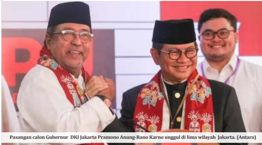
Pasangan calon Gubernur DKI Jakarta Pramono Anung-Rano Karno unggul di lima wilayah Jakarta.

JAKARTA -Calon Gubernur dan Calon Wakil Gubernur DKI Jakarta Pramono Anung-Rano Karno meraih kemenangan di seluruh wilayah di Jakarta dari hasil rekapitulasi hasil suara tingkat kota dan kabupaten. Pasangan dengan nomor urut 3 ini unggul dengan total 2.183.239 suara atau 50,07%.