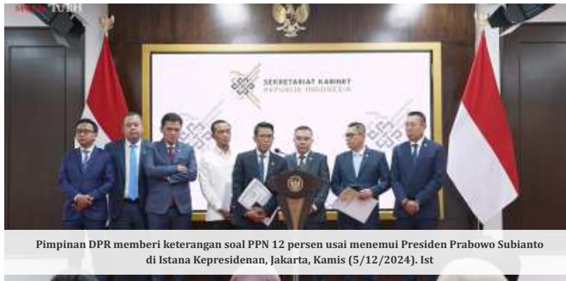
Pimpinan DPR memberi keterangan soal PPN 12 persen usai menemui Presiden Prabowo Subianto di Istana Kepresidenan, Jakarta, Kamis (5/12/2024). Ist

Selektif kepada beberapa komunitas baik itu barang dalam negeri maupun impor yang berkaitan dengan barang mewah. Sehingga pemerintah hanya memberikan beban itu kepada konsumen pembeli barang