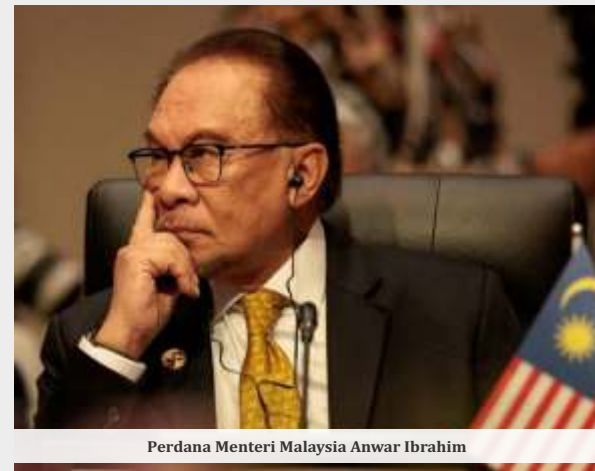
Perdana Menteri Malaysia Anwar Ibrahim

Sinar Harian mengangkat judul berita "Peniaga teh dihina depan khalayak, pendakwah mohon maaf". Berita tersebut juga diunggah di platform media sosial Facebook, Instagram hingga Tiktok Sinar