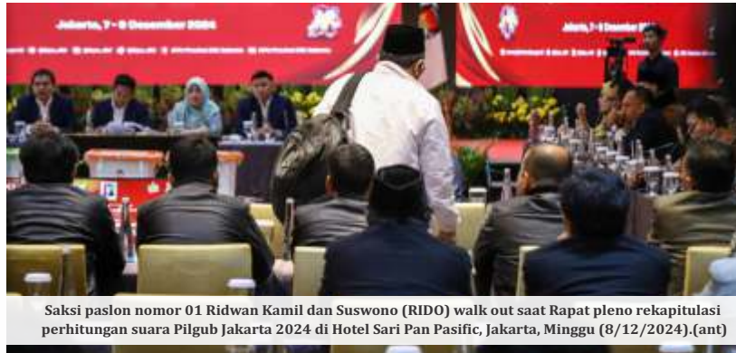
Saksi paslon nomor 01 Ridwan Kamil dan Suswono (RIDO) walk out saat Rapat pleno rekapitulasi perhitungan suara Pilgub Jakarta 2024 di Hotel Sari Pan Pasific, Jakarta, Minggu (8/12/2024).

"Tidak lupa juga kami mengucapkan terima kasih kepada jurnalis dan teman-teman media yang sudah kebersamai kami juga, baik dari pemilu legislatif dan eksekutif, dan