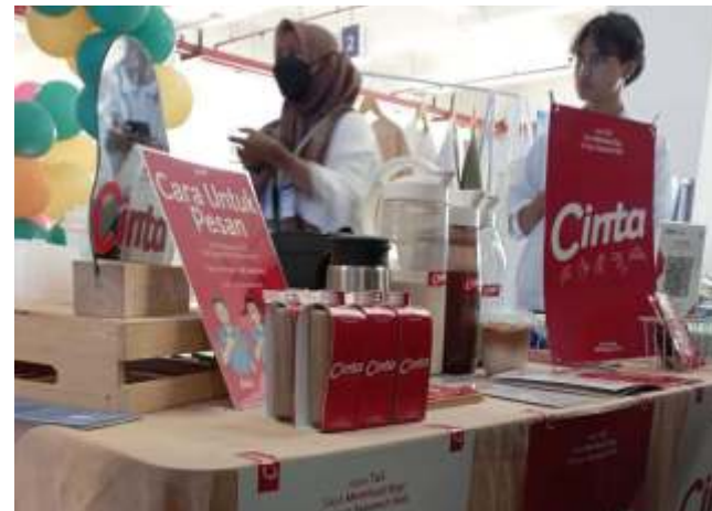
Salah satu produk UMKM dari penyandang difabel di Kota Malang.

Pasalnya diketahui, dari total 15 ribu penyandang difabel di Kota Malang, sebanyak 7 ribu di antaranya merupakan difabel yang berada langsung di bawah perhatian Pemkot