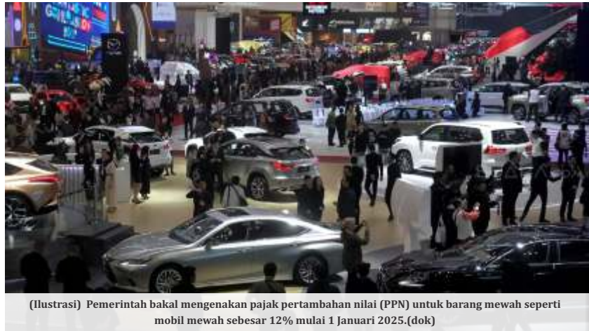
(Ilustrasi) Pemerintah bakal mengenakan pajak pertambahan nilai (PPN) untuk barang mewah seperti mobil mewah sebesar 12% mulai 1 Januari 2025.(dok)

"Daripada beli barang mewah kan lebih baik ditempatkan di deposito atau beli SBN," lanjut Bhima. 'Kekhawatiran' masyarakat kelas atas juga semakin memuncak, ketika pemerintah mendorong untuk melakukan pengungkapan harta sukarela atau tax amnesty Jilid III. Di mana pemerintah memberikan ruang 'pengampunan' bagi orang-orang kaya yang memarkirkan harta seperti rumah kendaraan mewah yang berada di dalam maupun luar negeri—yang belum tercatat—agar tercatat dan