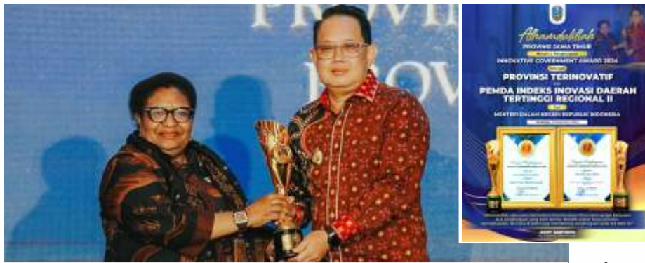
Pj Gubernur Adhy saat menerima penghargaan dari Wamendagri Ribka Haluk dalam ajang Penganugerahan Innovative Government Awards (IGA) 2024 di Mercure Surabaya Grand Mirama Hotel, Kamis (5/12/2024).

untuk mencari persoalan, membuat inovasi, dan kemudian melombakan di setiap tahapan dalam pemerintahan. Ini menandakan ekosistem inovasi di Jawa Timur sangat luar biasa. Masing-masing bupati/walikota berlomba-lomba bahkan kami harus membatasi," ungkapnya menambahkan.