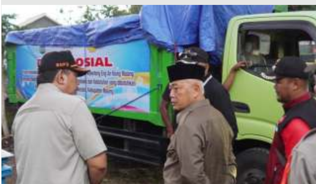
(Ilustrasi) Bupati Malang, Sanusi saat meninjau salah satu kecamatan terdampak bencana hidrometeorologi beberapa waktu lalu.

MALANG - Pemerintah Kabupaten (Pemkab) Malang mengalokasikan anggaran Belanja Tidak Terduga (BTT) sebesar Rp 3,5 miliar untuk tahun 2025. Anggaran ini disiapkan untuk mendukung penanganan kejadian tak terduga, seperti bencana alam dan kebutuhan darurat lainnya