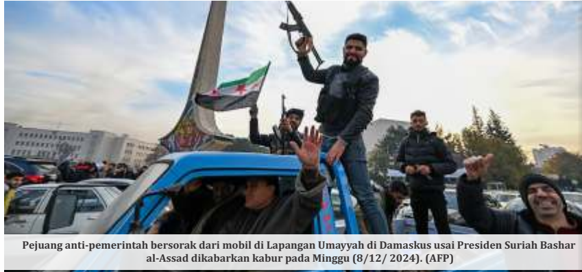
Pejuang anti-pemerintah bersorak dari mobil di Lapangan Umayyah di Damaskus usai Presiden Suriah Bashar al-Assad dikabarkan kabur pada Minggu (8/12/2024).

Penjara ini menjadi tempat ribuan tahanan mengalami penyiksaan dan kekerasan ekstrem sejak dimulainya perang saudara pada 2011.