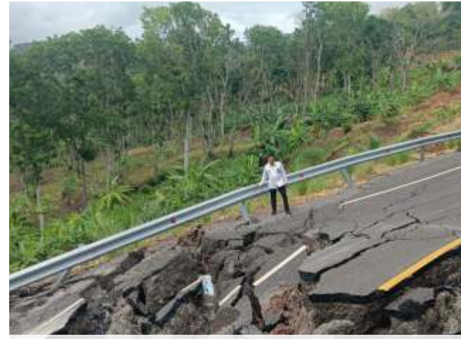
Jalur Lintas Selatan (JLS) Kelok 9 di Donomulyo, Kabupaten Malang rusak parah akibat longsor, Rabu (11/12/2024).

"Meskipun tidak ada korban jiwa atau luka, upaya pemulihan dan perbaikan jalur yang terdampak longsor terus dilakukan. Kami terus memantau lokasi untuk memastikan tidak ada warga yang terisolasi akibat penutupan jalan. Masyarakat juga