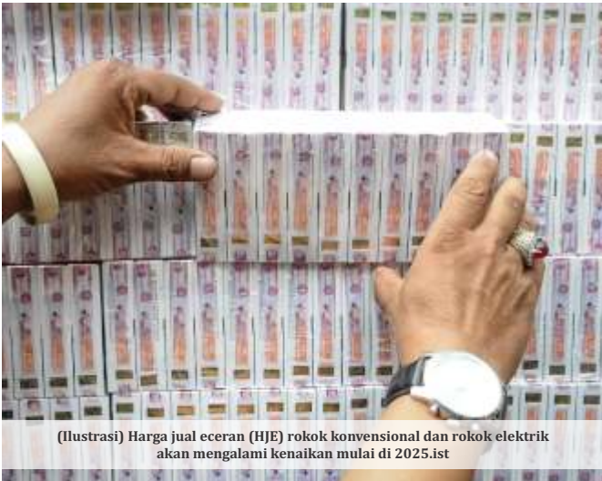
(Ilustrasi) Harga jual eceran (HJE) rokok konvensional dan rokok elektrik akan mengalami kenaikan mulai di 2025.ist

JAKARTA - Kementerian Keuangan (Kemenkeu) memastikan harga jual eceran (HJE) rokok konvensional dan rokok elektrik akan mengalami kenaikan mulai di 2025. Sementara cukai hasil tembakau (CHT) dipastikan