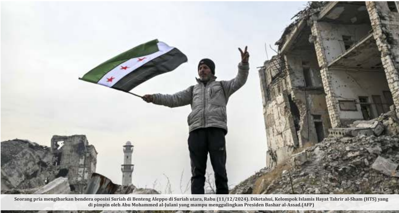
Seorang pria mengibarkan bendera oposisi Suriah di Benteng Aleppo di Suriah utara, Rabu (11/12/2024). Diketahui, Kelompok Islamis Hayat Tahrir al-Sham (HTS) yang di pimpin oleh Abu Mohammed al-Julani yang mampu menggulingkan Presiden Bashar al-Assad.

TEHERAN - Pemimpin tertinggi Iran, Ayatollah Ali Khamenei, menyalahkan Amerika Serikat (AS) dan Israel sebagai dalang di balik tumbangnya rezim Presiden Suriah Bashar al-Assad.