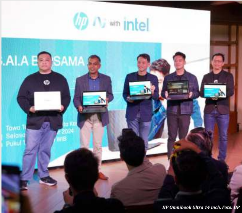
HP OmniBook Ultra 14 inch.

HP OmniBook Ultra 14-inch dibekali prosesor AMD Ryzen AI 300