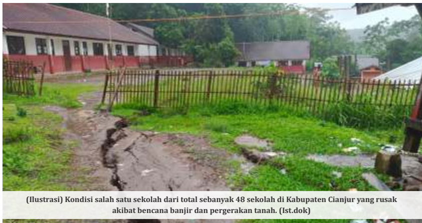
(Ilustrasi) Kondisi salah satu sekolah dari total sebanyak 48 sekolah di Kabupaten Cianjur yang rusak akibat bencana banjir dan pergerakan tanah.