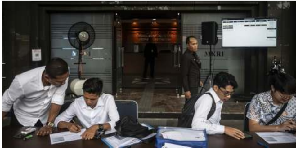
(Ilustrasi) Mahkamah Konstitusi (MK) telah menerima 277 pendaftaran sengketa hasil Pilkada serentak 2024 hingga pukul Kamis (12/12/2024) sore.

putaran kedua, Jakarta bisa segera berbenah. Menurutnya, saat ini Jakarta sedang menghadapi banyak tantangan.