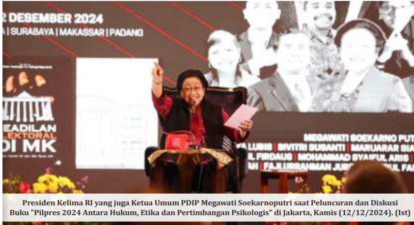
Presiden Kelima RI yang juga Ketua Umum PDIP Megawati Soekarnoputri saat Peluncuran dan Diskusi Buku "Pilpres 2024 Antara Hukum, Etika dan Pertimbangan Psikologis" di Jakarta, Kamis (12/12/2024).

Presiden RI ke-5 itu, mengatakan nilai Rp10 ribu tersebut tidak sepadan dengan harga bahan makanan yang