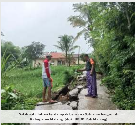
Salah satu lokasi terdampak bencana Satu dan longsor di Kabupaten Malang.

MALANG - Pemerintah Kabupaten (Pemkab) Malang mengakui keterbatasan anggaran Belanja Tidak Terduga (BTT) tahun 2024 untuk memperbaiki 12 jembatan yang rusak akibat banjir dan longsor. Dengan kebutuhan mencapai Rp 20 miliar, Bupati Malang, Sanusi, mengungkapkan alokasi anggaran perbaikan tersebut diproyeksikan melalui mekanisme di APBD 2025, baik