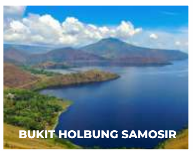
BUKIT HOLBUNG SAMOSIR