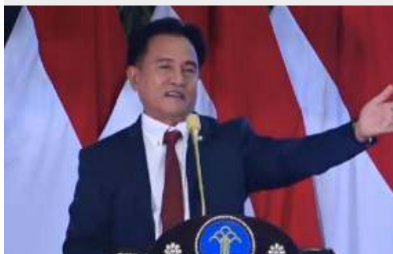
Menteri Koordinator Bidang Hukum, Hak Asasi Manusia, Imigrasi, dan Pemasarakatan Yusril Ihza Mahendra

JAKARTA - Menteri Koordinator Bidang Hukum, HAM, Imigrasi, dan Pemasarakatan Yusril Ihza Mahendra mengatakan bahwa di dalam ketentuan Kitab Undang-Undang Hukum Pidana (KUHP) yang baru, pengguna narkotika harus direhabilitasi, bukan lagi dijatuhi hukuman pidana penjara.