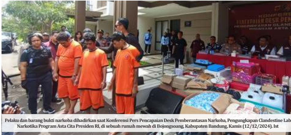
Pelaku dan barang bukti narkoba dihadirkan saat Konferensi Pers Pencapaian Desk Pemberantasan Narkoba, Pengungkapan Clandestine Lab Narkotika Program Asta Cita Presiden RI, di sebuah rumah mewah di Bojongsong, Kabupaten Bandung, Kamis (12/12/2024).

Sementara itu, dari kompleks perumahan Podomoro, Bojongsong, Kabupaten Bandung, yang merupakan kediaman SP dan IV ditemukan 7.333 saset kemasan berisikan serbuk happy water, 494 botol liquid air berukuran 20 mililiter, 62 butir pil warna hijau kuning mengandung MDMA, 95