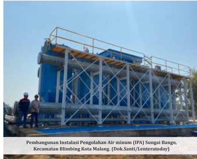
Pembangunan Instalasi Pengolahan Air minum (IPA) Sungai Bango, Kecamatan Blimbing Kota Malang.

"Proyek ini merupakan langkah penting untuk mengurangi ketergantungan pada air tanah sekaligus menjawab tantangan kebutuhan air bersih masyarakat," ungkap Iwan. (Santi/Dya)