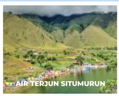
AIR TERJUN SITUMURUN

Terletak di tepi Danau Toba, Desa Paropo menawarkan pengalaman liburan yang berbeda. Nuansa desa yang masih otentik, kehangatan dari masyarakat setempat, pemandangan pegunungan nan hijau dan kecantikan Danau Toba yang berpadu menjadi satu kesatuan dijamin membuatmu terkesima. Jika ingin berlama-lama menikmati keindahan ini, jangan ragu untuk kemah di lokasi ini, ya. Biasanya ada banyak wisatawan yang memilih untuk bermalam di sini dengan tenda warna-warni dibandingkan menyewa hotel, karena tertarik merasakan suasana baru yang lebih dekat dengan alam. (nei,ist/dya)