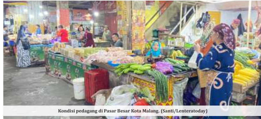
Kondisi pedagang di Pasar Besar Kota Malang.

Iwan menjelaskan, Pemkot Malang bersama DPRD telah mengadakan