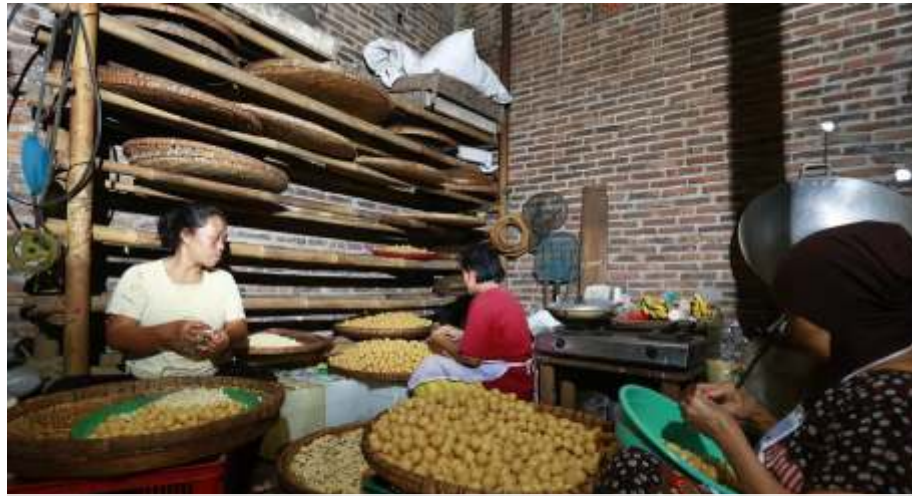
Pemerintah Indonesia akan mengumumkan kebijakan perpanjangan periode pemanfaatan pajak penghasilan (PPh) final 0,5 persen bagi UMKM. (Ilustrasi. Dok)

"Kita lihat perubahan PP nya nanti ya, threshold yang mana ini kan harus ubah PP, nanti pasti pemerintah akan sampaikan hitung-hitungannya, kita perlu juga arah kajiannya bagaimana meski sudah ada ke sana terkait rekomendasi OECD, cuma konteks sekarang kan ke