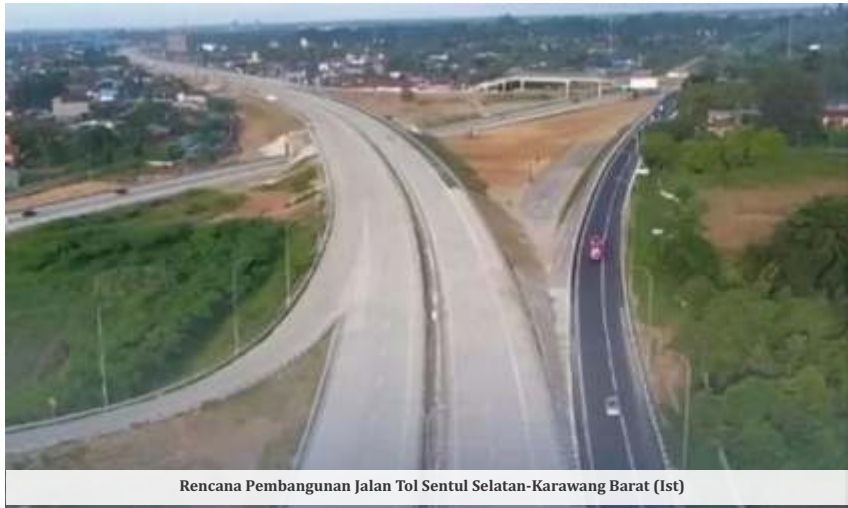
Rencana Pembangunan Jalan Tol Sentul Selatan-Karawang Barat (Ist)

JAKARTA - Presiden Prabowo Subianto meminta pembangunan proyek-proyek infrastruktur yang baru dihentikan dulu. Arahan ini turut berdampak kepada proyek jalan tol.