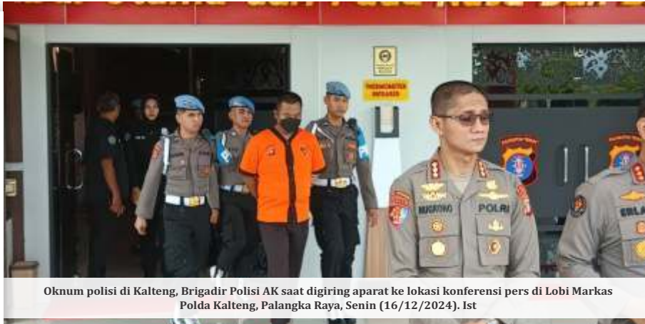
Oknum polisi di Kalteng, Brigadir Polisi AK saat digiring aparat ke lokasi konferensi pers di Lobi Markas Polda Kalteng, Palangka Raya, Senin (16/12/2024).

JAKARTA- DPR RI menyoroti maraknya penembakan yang dilakukan oleh anggota polisi selama tahun 2024. Meski mengaku prihatin, tapi para wakil rakyat tidak setuju kalau harus senjata api polisi dilucuti.