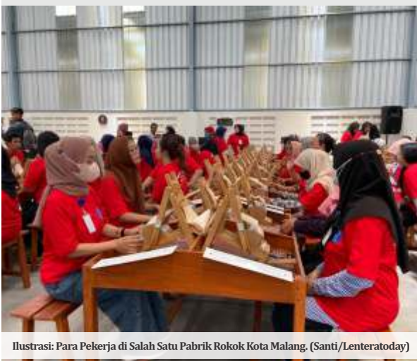
Ilustrasi: Para Pekerja di Salah Satu Pabrik Rokok Kota Malang.

MALANG- Pemerintah Kota (Pemkot) Malang membuka posko pengaduan untuk menampung keluhan pengusaha maupun pekerja, terkait kebijakan kenaikan Upah Minimum Kota (UMK) 2025.