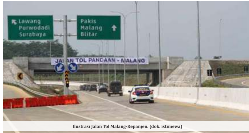
Ilustrasi Jalan Tol Malang-Kepanjen.

Didik juga menjelaskan beberapa alasan mendesak pembangunan tol Malang-Kepanjen, termasuk potensi pariwisata Kabupaten Malang yang dikenal dengan keindahan pantainya. Selain itu, tol ini juga mendukung pengembangan pendidikan melalui akses lebih baik ke kampus besar seperti Universitas Brawijaya (UB) dan lembaga pendidikan lainnya.