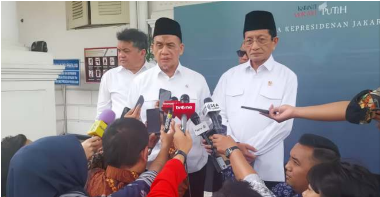
Menag Nasaruddin Umar (kanan) didampingi Wamenag Romo Syafi'i usai bertemu Mensesneg Prasetyo Hadi dan Seskab Teddy Indra Wijaya di Istana Kepresidenan, Jakarta.

JAKARTA- Kementerian Agama (Kemenag) mengatakan, ada potensi Biaya Penyelenggaraan Ibadah Haji (BPIH) tahun 2025 lebih murah dibanding tahun ini.