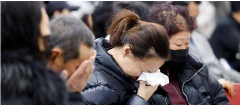
Keluarga penumpang Jeju Air yang mengalami kecelakaan menangis di Bandara Internasional Muan, Provinsi Jeolla, Korea Selatan, Minggu (29/12/2024).

SEOUL -Seluruh penumpang dan awak kabin Jeju Air yang mengalami kecelakaan di Bandara Muan, Korea Selatan, hampir dipastikan meninggal dunia. Hanya ada dua orang yang berhasil selamat.