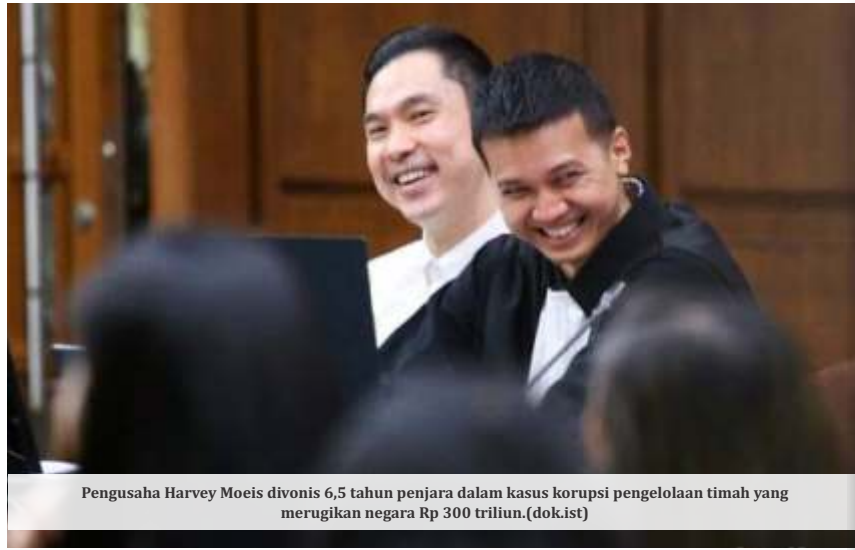
Pengusaha Harvey Moeis divonis 6,5 tahun penjara dalam kasus korupsi pengelolaan timah yang merugikan negara Rp 300 triliun. (dok.ist)

Teguh mengatakan saat ini pemprov sedang membahas langkah-langkah percepatan perbaikan soal kepesertaan PBI APBD. Dia juga mengatakan pemda sedang merevisi Peraturan Gubernur 46 Tahun 2021 tentang Penyelenggaraan JKN untuk menyesuaikan kriteria peserta PBI APBD agar bantuan diberikan kepada masyarakat yang membutuhkan.