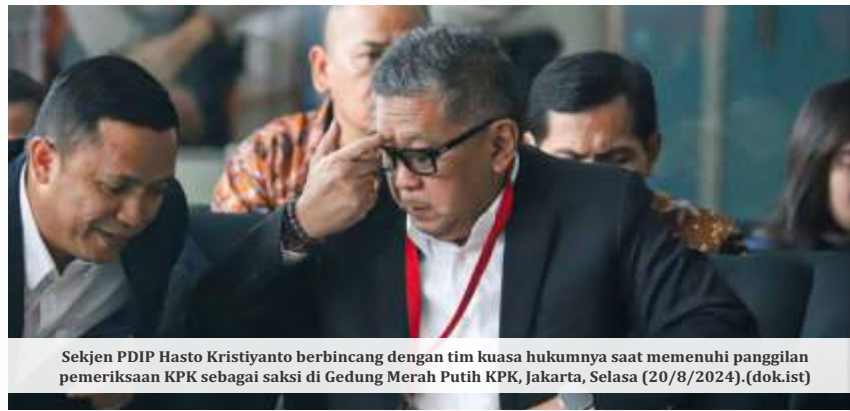
Sekjen PDIP Hasto Kristiyanto berbincang dengan tim kuasa hukumnya saat memenuhi panggilan pemeriksaan KPK sebagai saksi di Gedung Merah Putih KPK, Jakarta, Selasa (20/8/2024).

Buntut penetapan ini, Juru Bicara PDIP Guntur Romli mengatakan Hasto akan melakukan perlawanan dengan menyiapkan puluhan video yang mengungkapkan skandal dugaan korupsi para petinggi negara. Guntur meyakini video tersebut akan mengagetkan dan mengubah peta