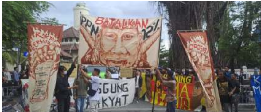
Sejumlah massa menggelar aksi menolak kenaikan PPN 12 persen di Yogyakarta pada Senin (30/12/2024). (dok)

"Yang mengadukan saudara karena adanya dugaan pelanggaran kode etik atas pernyataan saudara