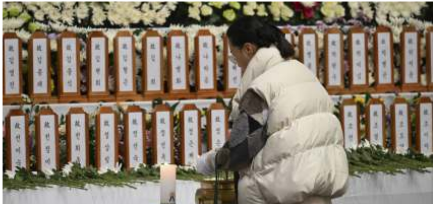
Warga saat mengunjungi altar peringatan untuk para korban kecelakaan pesawat Jeju Air di Bandara Internasional Muan, di Muan Sports Park di Muan, Korea Selatan, Minggu (30/12/2024).