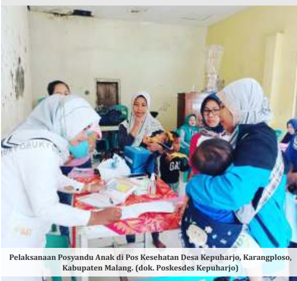
Pelaksanaan Posyandu Anak di Pos Kesehatan Desa Kepuharjo, Karangploso, Kabupaten Malang.

ditargetkan angka stunting dapat ditekan hingga menyentuh 5 persen.