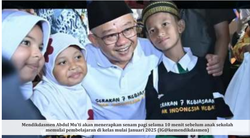
Mendikdasmen Abdul Mu'ti akan menerapkan senam pagi selama 10 menit sebelum anak sekolah memulai pembelajaran di kelas mulai Januari 2025

Sebelumnya, Badan Riset dan Inovasi Nasional (BRIN) menyambut baik upaya pelaksanaan kembali Ujian Nasional di seluruh satuan pendidikan