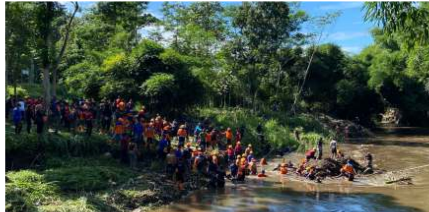
Pembersihan tumpukan sampah di Sungai Amprong, Kedungkandang Kota Malang, Senin (30/12/2024).

"Saya lihat di sini ada 2 jembatan yang rusak, terjadi penurunan konstruksi. Dampak dari hujan yang cukup deras dan aliran sungai yang cukup deras. Maka untuk itu Pemkot Malang, melalui Dinas PUPR akan melakukan intervensi untuk memperbaiki jembatan itu. Nanti akan kita eksekusi di tahun anggaran 2025," tambahnya.