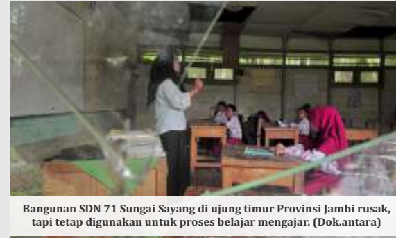
Bangunan SDN 71 Sungai Sayang di ujung timur Provinsi Jambi rusak, tapi tetap digunakan untuk proses belajar mengajar.

Dia menyebut, puluhan ribu sekolah yang akan direnovasi pada