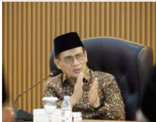
Wakil Menteri Agama Romo HR Muhammad Syafii

JAKARTA - Kementerian Agama (Kemenag) mengusulkan Biaya Penyelenggaraan Ibadah Haji (BPIH) 2025 rerata sebesar Rp93.389.684,99 atau Rp 93,38 juta. Usulan ini sedikit lebih rendah dibandingkan tahun lalu, yakni Rp 93,41 juta. Usulan Kemenag ini selanjutnya akan dibahas oleh Panja BPIH.