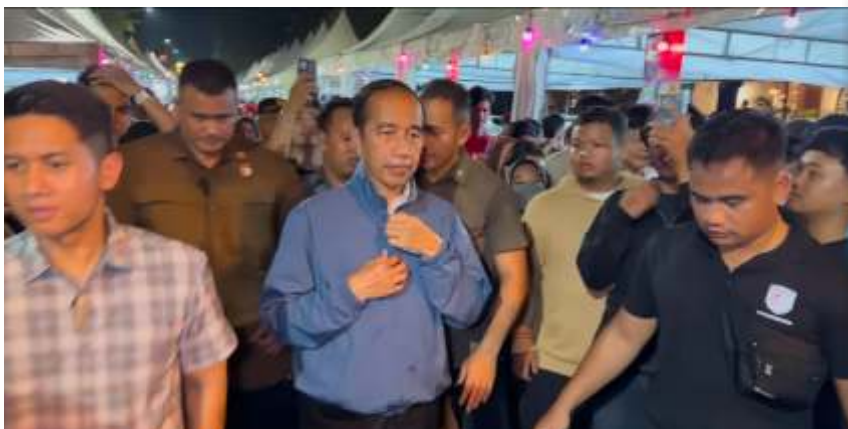
Mantan Presiden Joko Widodo atau Jokowi di tengah kerumunan warga pada perayaan malam tahun baru di Ngarsopuro Solo, Rabu (1/1/2025) dini hari.

"Kami meminta (voting) nominasi dari para pembaca, jurnalis, juri Person of the Year, dan pihak lain dalam jaringan global OCCRP. Para finalis yang memperoleh suara terbanyak tahun ini adalah: Presiden Kenya William Ruto, Mantan Presiden Indonesia Joko Widodo, Presiden Nigeria Bola Ahmed Tinubu, Mantan