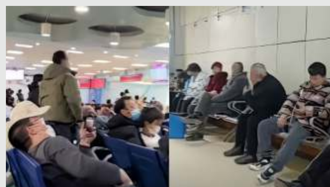
Tangkapan layar video di media sosial yang memperlihatkan sejumlah rumah sakit di China penuh diduga imbas kenaikan kasus penyakit pernapasan. (x)

CDC telah mengeluarkan sejumlah rekomendasi guna memutus rantai penyebaran virus, yakni meminta masyarakat China memakai masker di