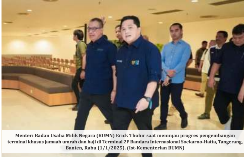
Menteri Badan Usaha Milik Negara (BUMN) Erick Thohir saat meninjau progres pengembangan terminal khusus jamaah umrah dan haji di Terminal 2F Bandara Internasional Soekarno-Hatta, Tangerang, Banten, Rabu (1/1/2025). (Ist-Kementerian BUMN)

"Kami berkomitmen mendukung dan bekerja sama untuk meningkatkan layanan bagi jamaah. Tujuan kami adalah menciptakan ekosistem haji dan umrah yang