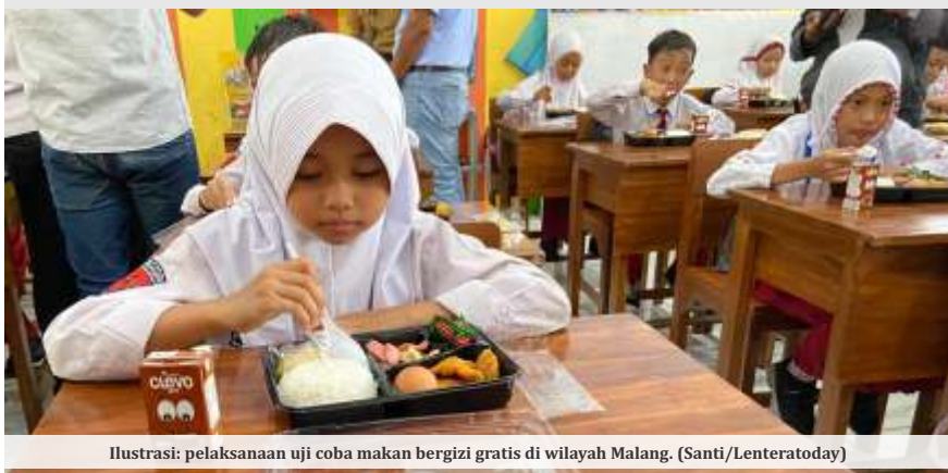
Ilustrasi: pelaksanaan uji coba makan bergizi gratis di wilayah Malang.

MALANG - Pemerintah Kota (Pemkot) Malang masih menunggu petunjuk teknis (juknis) dari pemerintah pusat terkait pelaksanaan program makan bergizi gratis (MBG) bagi siswa. DPRD memproyeksikan anggaran yang dibutuhkan untuk menjalankan program ini mencapai sekitar Rp 50 miliar per bulan.