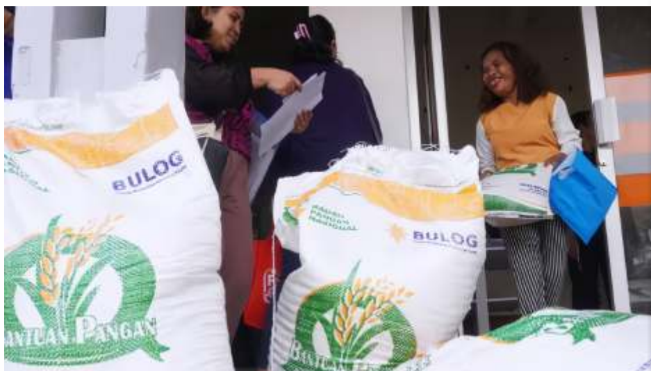
(Ilustrasi) Bulog siap mendistribusikan 960 ribu ton beras ke 16 juta Penerima Bantuan Pangan (PBP) di 2025 selama 6 bulan. (Dok)

Berdasarkan data Badan Pusat Statistik (BPS), bantuan pangan peras menjadi salah satu program pemerintah yang memiliki andil terhadap penurunan tingkat kemiskinan. Ini terjadi selama periode