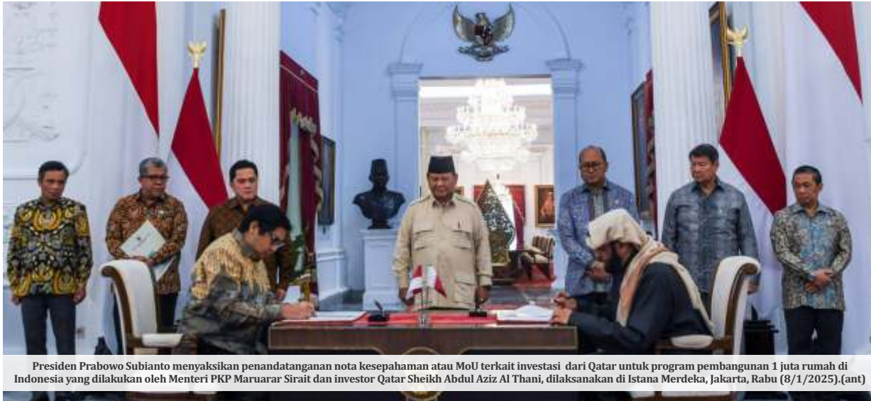
Presiden Prabowo Subianto menyaksikan penandatanganan nota kesepahaman atau MoU terkait investasi dari Qatar untuk pembangunan 1 juta rumah di Indonesia yang dilakukan oleh Menteri PKP Maruarar Sirait dan investor Qatar Sheikh Abdul Aziz Al Thani, dilaksanakan di Istana Merdeka, Jakarta, Rabu (8/1/2025). (ant)

JAKARTA-Qatar secara resmi menanamkan dananya untuk menjalankan program 3 juta rumah besutan Presiden Prabowo Subianto. Hal ini setelah kedua negara menandatangani nota kesepahaman atau memorandum of understanding (MoU) untuk sektor perumahan terkait pendanaan 1 juta hunian bagi masyarakat ber-penghasilan rendah (MBR).