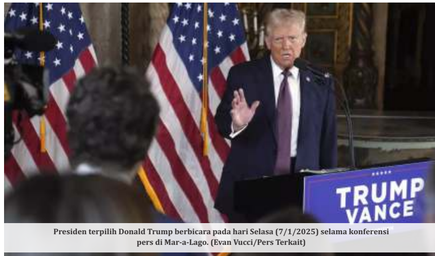
Presiden terpilih Donald Trump berbicara pada hari Selasa (7/1/2025) selama konferensi pers di Mar-a-Lago.

Menteri Luar Negeri Kanada, Melanie Joly, juga menanggapi pernyataan Trump di X. "Komentar Presiden terpilih Trump menunjukkan kurangnya pemahaman tentang apa