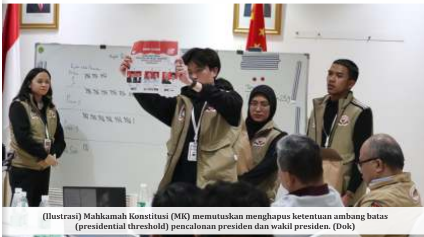
(Ilustrasi) Mahkamah Konstitusi (MK) memutuskan menghapus ketentuan ambang batas (presidential threshold) pencalonan presiden dan wakil presiden. (Dok)

Menkum menegaskan pihaknya menghormati dan mematuhi putusan MK yang menghapus syarat ambang batas pencalonan presiden dan wakil