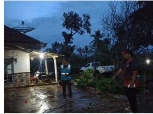
Salah satu lokasi terdampak tanah gerak di Desa Tumpakrejo Kabupaten Malang.

Hingga laporan terakhir dari Pusdalops BPBD Kabupaten Malang pada 6 Januari 2025, sambungnya, kondisi pergeseran tanah masih berlangsung dan diperkirakan akan terus bertambah parah apabila hujan deras terus terjadi.