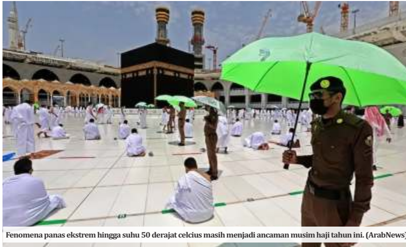
Fenomena panas ekstrem hingga suhu 50 derajat celsius masih menjadi ancaman musim haji tahun ini. (ArabNews)

Sebanyak 110.000 jamaah haji Indonesia dijadwalkan tiba di Bandara Amir Mohammad Bin Abdul Azis di Madinah dan kembali melalui Bandara