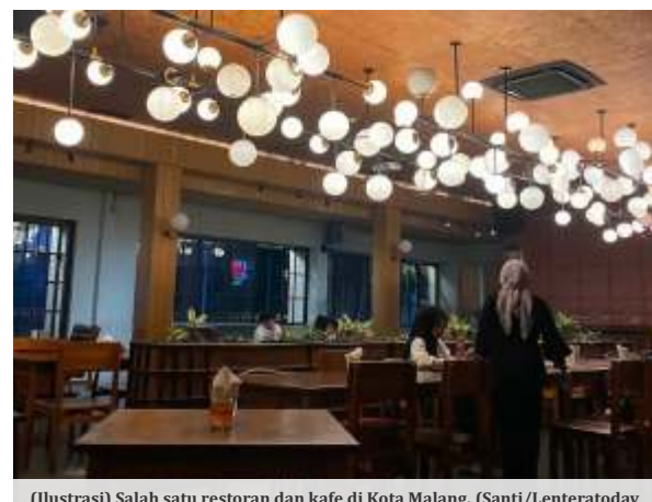
(Ilustrasi) Salah satu restoran dan kafe di Kota Malang.

"Kalau memang itu diskotik, ya masukkan itu ke izin diskotik (hiburan), yang nantinya dari Bapenda kita bisa menyerap itu sebagai tarif, memasukkan itu sebagai pajak hiburan kalau keluarnya itu. Izinnya itu adalah pajak restoran maka Bapenda tidak bisa mengambil, menarifkan itu ke pajak hiburan