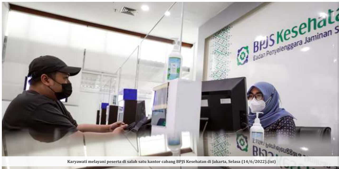
Karyawati melayani peserta di salah satu kantor cabang BPJS Kesehatan di Jakarta, Selasa (14/6/2022).

JAKARTA- Menteri Kesehatan (Menkes) Budi Gunadi Sadikin mengakui BPJS Kesehatan tidak mampu meng-cover seluruh jenis penyakit. Dia mengimbau agar masyarakat dapat memiliki asuransi swasta.