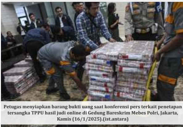
Petugas menyiapkan barang bukti uang saat konferensi pers terkait penetapan tersangka TPPU hasil judi online di Gedung Bareskrim Mebes Polri, Jakarta, Kamis (16/1/2025).

JAKARTA - Direktorat Tindak Pidana Ekonomi Khusus (Dittipideksus) Bareskrim Polri menetapkan tersangka dalam kasus Tindak Pidana Pencucian Uang (TPPU) judi online. Kamis (16/1/2025) mereka mengumumkan bahwa PT AJP dan seorang individu berinisial FH sebagai tersangka dalam kasus tersebut. Mereka juga sudah menyita uang Rp 103,27 miliar yang tersebar di 15 rekening bank.