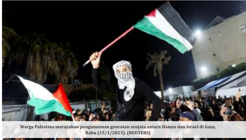
Warga Palestina merayakan pengumuman gencatan senjata antara Hamas dan Israel di Gaza, Rabu (15/1/2025).

Tayyip Erdogan berharap gencatan senjata Gaza akan bermanfaat bagi kawasan negaranya dan seluruh umat manusia.