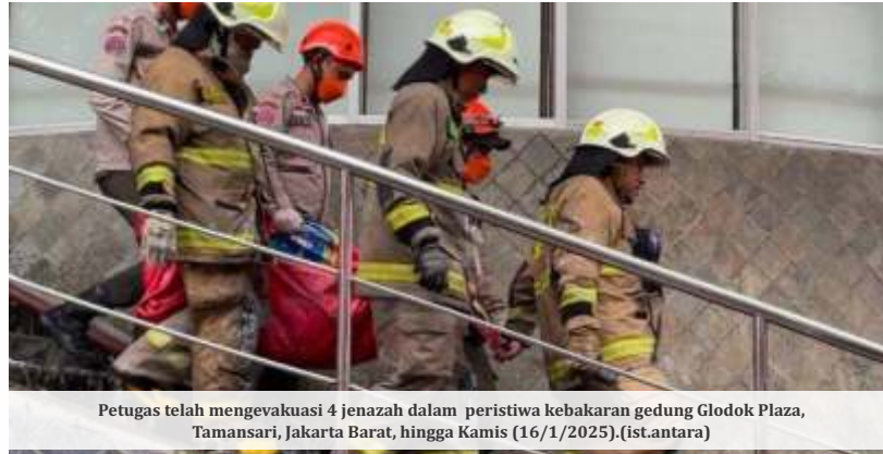
Petugas telah mengevakuasi 4 jenazah dalam peristiwa kebakaran gedung Glodok Plaza, Tamansari, Jakarta Barat, hingga Kamis (16/1/2025).

"Betul demikian. Nah, karena posisi jasad ini tidak dikenali, bahkan