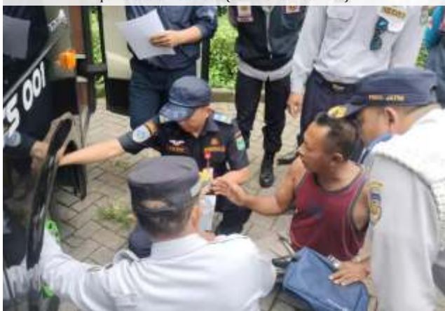
Dishub Kota Batu beserta tim gabungan saat melakukan ramp check bus-bus pariwisata di Kota Batu.

BATU - Dinas Perhubungan (Dishub) Kota Batu memperketat pengawasan terhadap bus-bus pariwisata yang beroperasi di wilayahnya. Setiap akhir pekan, Dishub bersama tim gabungan melakukan ramp check di sejumlah objek wisata utama di Kota Batu.