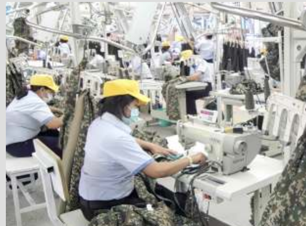
(Ilustrasi) PT Sri Rejeki Isman Tbk (Sritex) dinyatakan pailit setelah gagal memenuhi kewajiban pembayaran.

Hingga saat ini, total tagihan utang PT Sritex yang telah diterima oleh kurator mencapai Rp 32,6 triliun. Tagihan utang terbesar, kata dia, berasal dari kreditor konkuren atau kreditor yang tidak memegang jaminan kebendaan apa pun yang nilainya mencapai Rp 24,7 triliun.